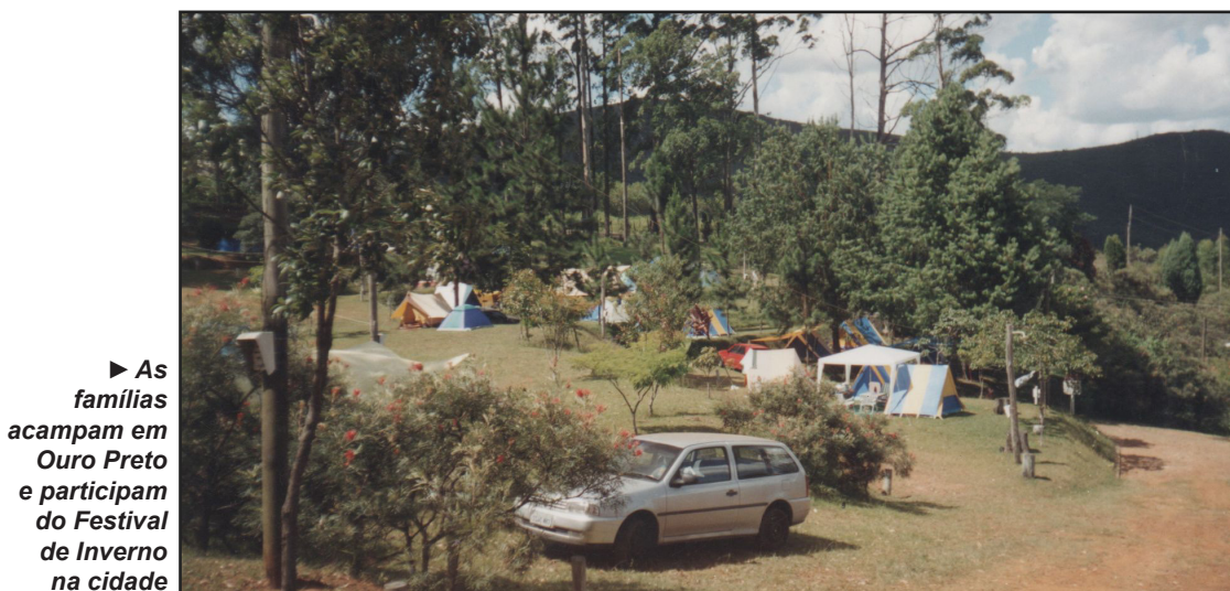
► As famílias acampam em Ouro Preto e participam do Festival de Inverno na cidade