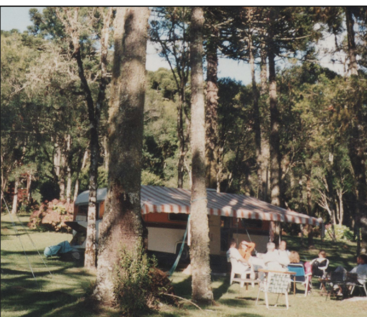
► As instalações do camping estão sempre preparadas para apoiar os eventos naquela região

Os campistas que visitarem Canela durante esse inverno podem participar de mais uma edição do projeto Canela em Festa, três eventos simultâneos para a cidade: a Festa Colonial, a Cidade das Crianças e Feira de Inverno.