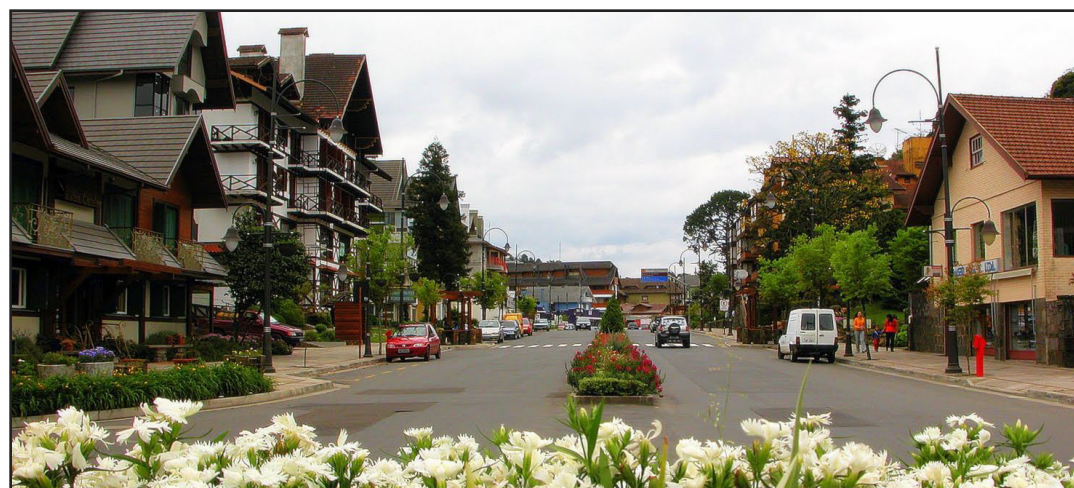
▶ Já é tempo de garantir as reservas para o Natal Luz de Canela e Gramado

-Embarque no Navio - Hotel Iberostar Grand Amazon e explore os encantos do Amazonas, contando com uma infraestrutura de luxo e um roteiro inesquecível. Ligue para a gente para saber mais detalhes.