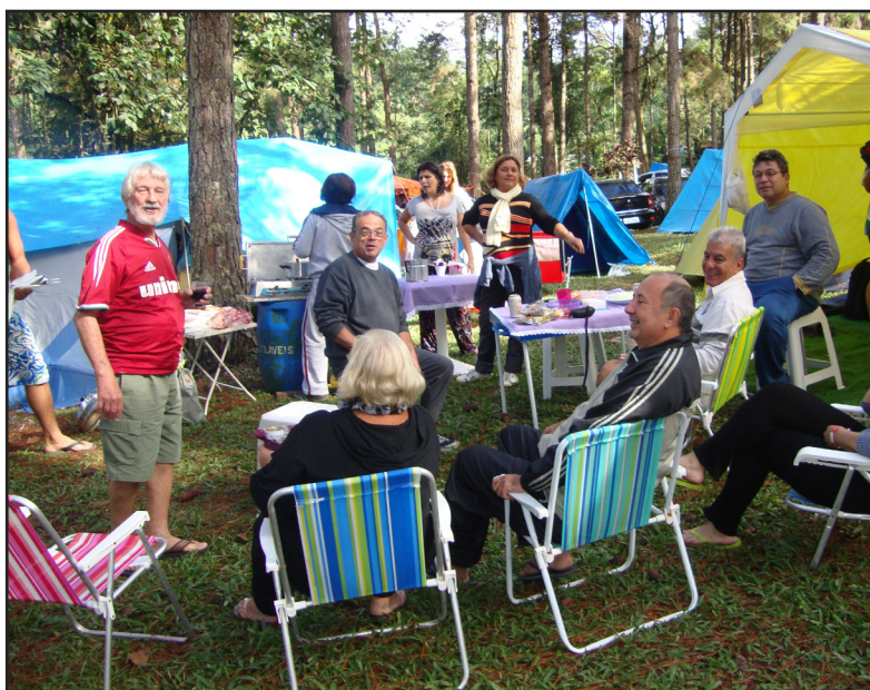
► No sábado, sob sol de montanha, churrascos e bate-papos antecederam os momentos da festa