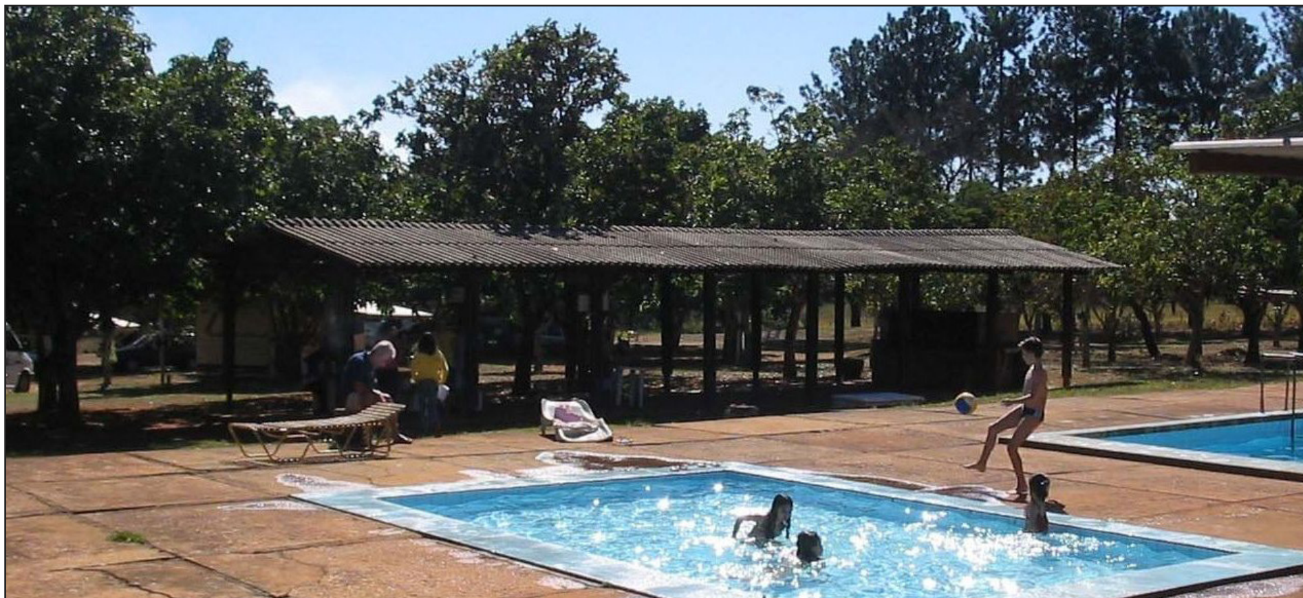
► O inverno de Caldas Novas garante sempre sol firme e ainda oferece este mês o Carneiro no Buraco e a XVI Costelada (Pág. 7)