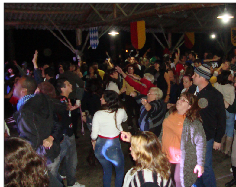
► À noite, mais um sucesso da Banda Tureck animando os campistas