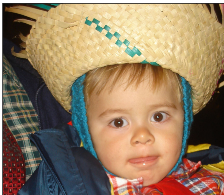
► As festas julinas nos campings agradam campistas de qualquer idade (Página 10)