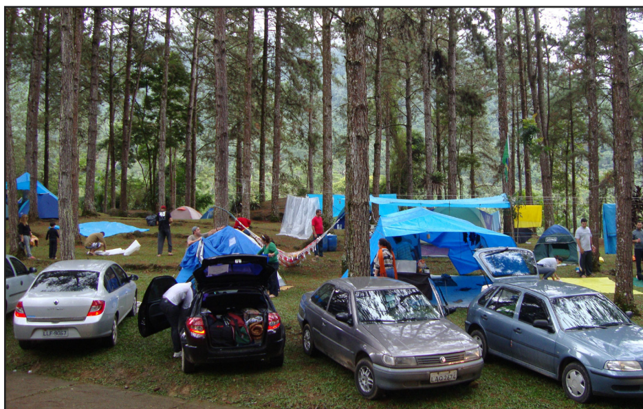
► No domingo, dia seco para recuperar as energias e desmontar o acampamento

caneco comemorativo. E tome vinho para espantar o frio. Vinho tinto e refrigerante à vontade, além da tradicional embalagem com cinco qualidades de queijos, patê, manteiga e pão. Ao contrário do que muitos acreditaram a chuva miúda só caiu mesmo na sexta feira à noite. No sábado o sol convidou a animados churrascos e as tradicionais rodas de amigos numa grande confraternização. À noite, apenas frio e muito vinho e no domingo o sol gostoso para curar os excessos da noite anterior com a certeza de que ano que vem tem mais.