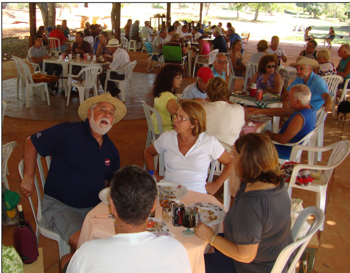
► No pavilhão de eventos, o momento maior da confraternização da Costelada