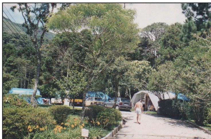
► O feriadão da Independência e a cantina sob nova concessão vão garantir o sucesso do cozido

Informações de como adquirir os ingressos para a festa serão publicadas nesse jornal, na edição do mês de agosto.