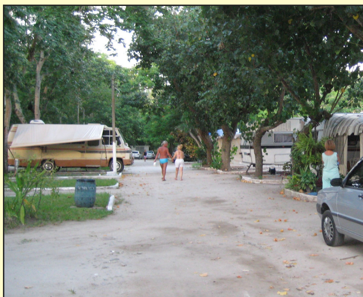
► Em 1966, o Camping de Cabo Frio foi a primeira incorporação patrimonial do CCB

Atualmente, o CCB tem unidades em doze estados, promovendo uma integração de Norte a Sul do país, a saber: Bahia, Espírito Santo, Goiás, Minas Gerais, Paraíba, Paraná, Rio de Janeiro, Rio Grande do Norte,