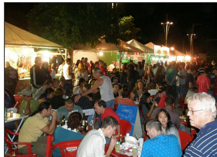
► Não podia ser melhor: cinco minutos a pé separam o camping dos estandes da "exposição"

Acesso – A cidade de Paraty fica a 240km do Rio de Janeiro e a 305km de São Paulo. O acesso é feito pela BR-101 (Rio/Santos). Após a construção da rodovia, na década de 70, a cidade tornou-se um importante pólo de turismo nacional e internacional. Paraty possui também um pequeno aeródromo para aviões mono ou bimotor, com pista de 30 metros de largura e 585 de comprimento, revestida de asfalto.