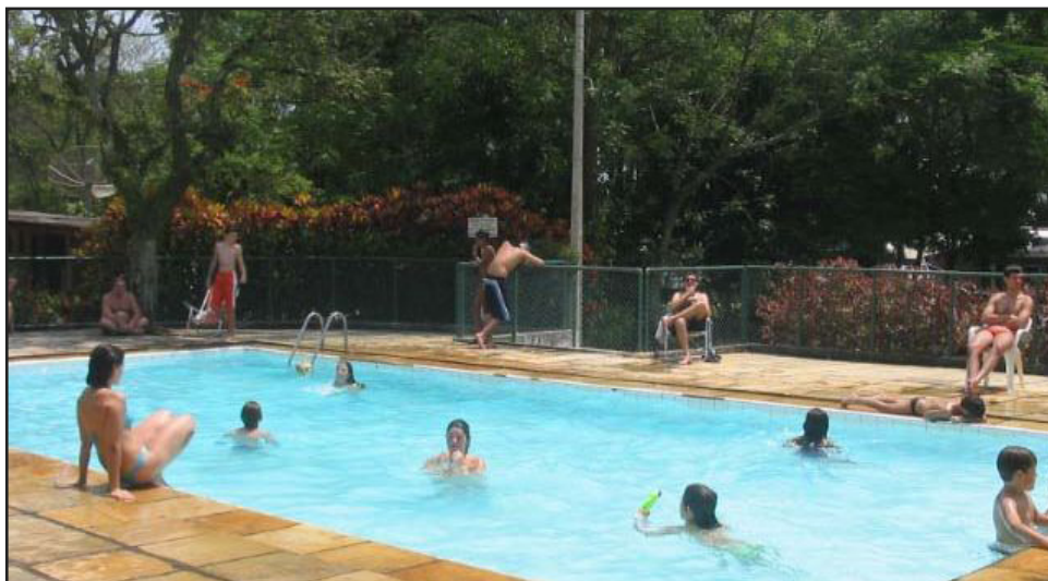
► O Camping do Clube dos 500 fica a meio caminho entre o Rio e São Paulo

tro da cidade, na Estrada dos Inconfidentes, onde os campistas dispõem de instalações-padrão, chuveiros quentes e quadra de esportes. O MG-01 tem capacidade para 130 barracas, além de 20 trailers e motor-homes.