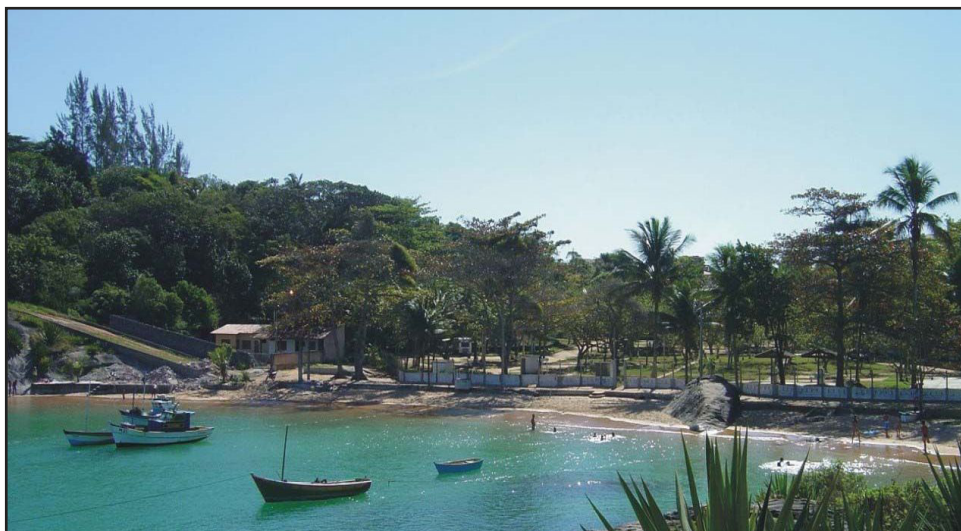
► Defronte à serena enseada de Setiba, o Camping de Guarapari

Camping - O camping de Ouro Preto fica próximo ao Cen-