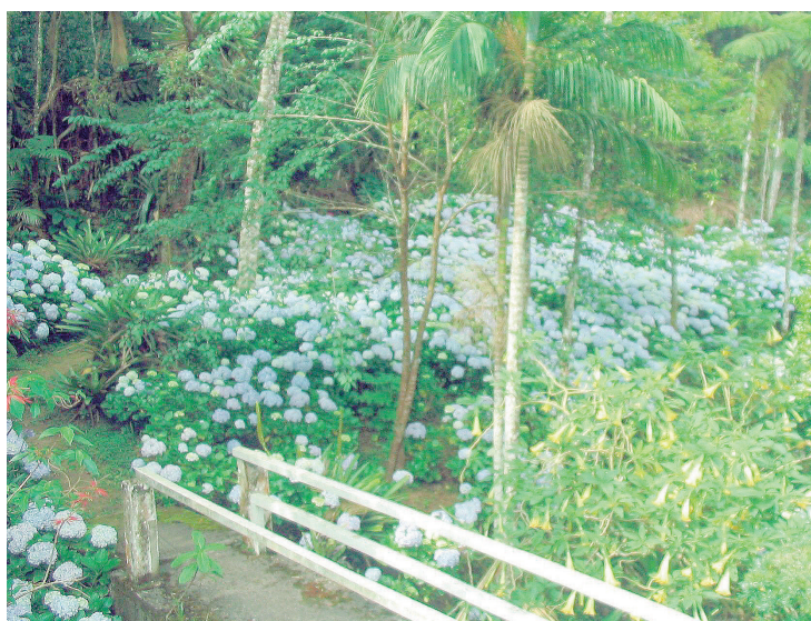
► Nada melhor do que rever a primavera em Mury ao som de um sambão com feijão (Página 4)

Mury em clima de Sambão e Feijão agita a região serrana este mês