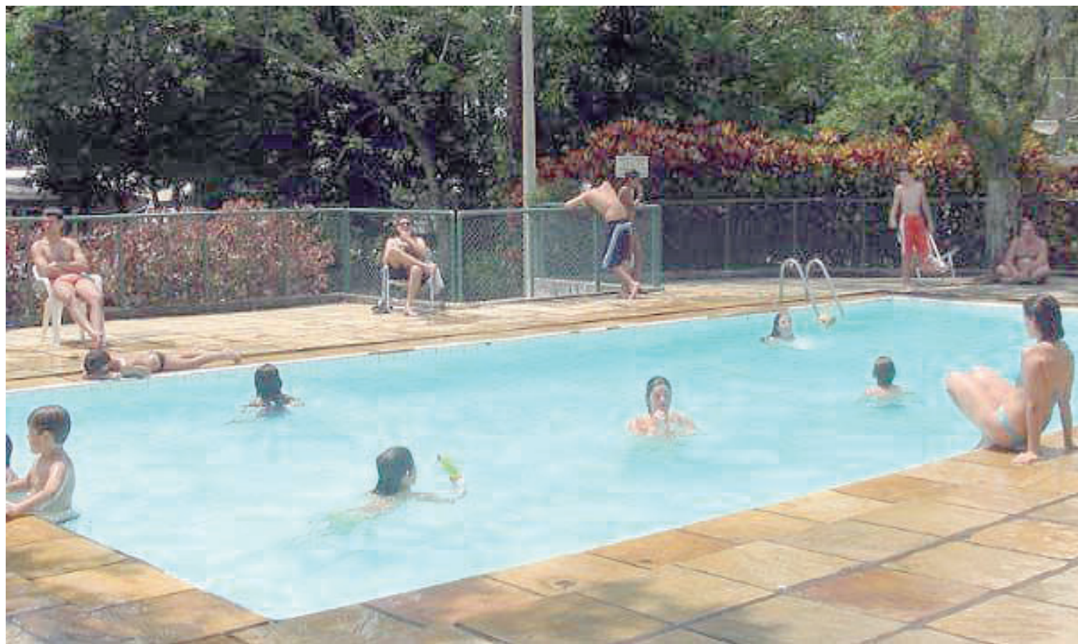
► Além do conforto e variações de esporte e lazer, o camping vai integrar mais uma vez jovens e adultos

Camping – Com instalações-padrão cercadas da mata nativa, o SP-01 oferece aos