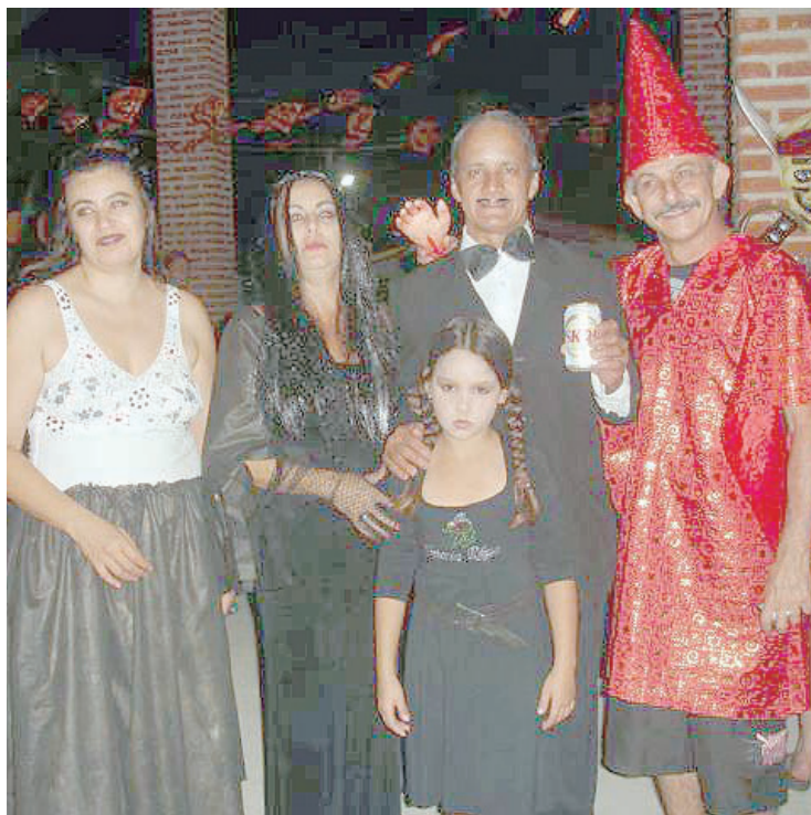
► O Halloween de Bertioga já é uma tradição de bom humor e alegria

Acesso – Os campistas que vêm de São Paulo devem seguir pela rodovia Presidente Dutra, entrar em Mogi das Cruzes e pegar a rodovia Mogi-Bertioga (SP 070). Já os que vêm do Rio de Janeiro podem escolher entre seguir pela Dutra até a rodovia Mogi-Bertioga ou pela rodovia Oswaldo Cruz, que começa em Taubaté, até pegar a Rio-Santos.