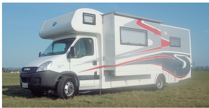
► Funcionalidade e leveza marcam os motor-homes da Itapoã

Leonir - Precisamos de mais investimentos do Ministério do Turismo em novas áreas destinadas a acolher os praticantes