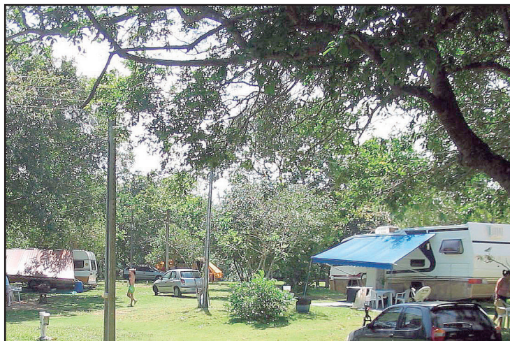
► O Camping de Aracruz, defronte à praia, tem frequência garantida pelos campistas capixabas

Cabe agora às novas gerações darem também a sua contribuição. E isso começa pelo bom exemplo de cumprir com os seus compromissos. Ao longo de