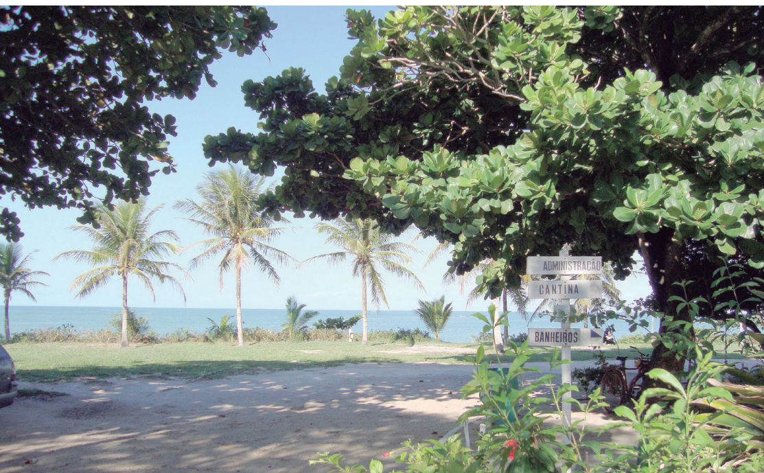
► Defronte à Praia do Farol, o Camping de Prado abre as portas do litoral nordestino