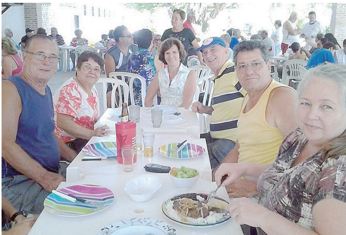
► Animação acima da média foi a tônica do Bobó em Cabo Frio

Acesso – Os campistas que saem do Rio de Janeiro devem seguir pela ponte Rio-Niterói e entrar na BR-101, via Rio Bonito, tomando-se a Via Lagos até São Pedro da Aldeia. Depois basta pegar a RJ-140 até Cabo Frio. Outra opção para quem vem do Rio de Janeiro é atravessar a ponte Rio-Niterói e pegar a RJ-04 até Tribobó. Em seguida é necessário virar à direita, na RJ-106, passando por Maricá, Araruama e Iguaba até chegar a São Pedro da Aldeia.