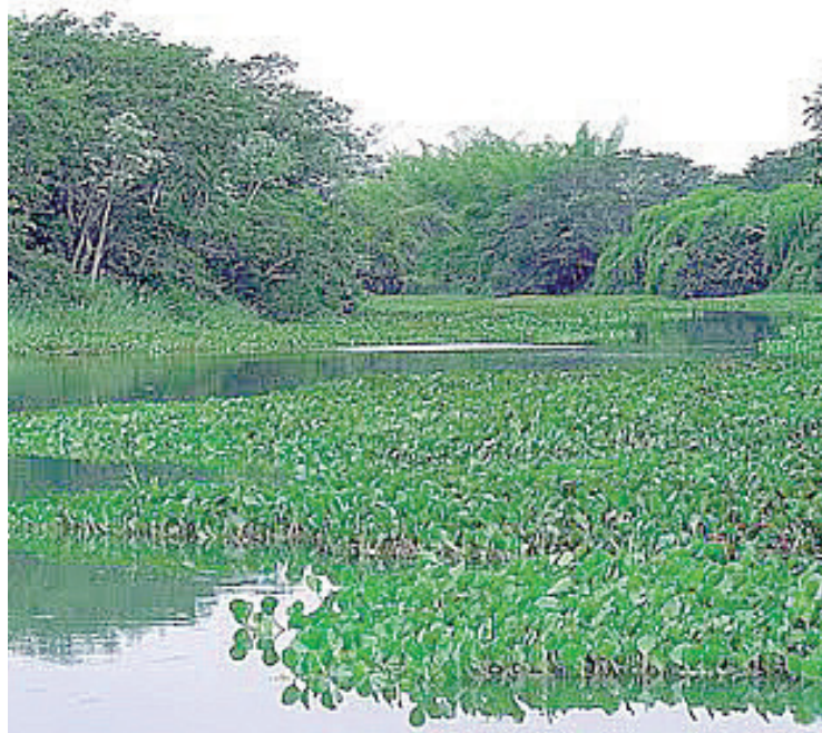
► Parque Nacional da Ilha Grande, entre Paraná e Mato Grosso

O Parque Nacional de Ilha Grande, entre os estados do Paraná e Mato Grosso do Sul, é uma unidade de conservação brasileira de proteção total à natureza. Seu território abrange as Ilhas Grande, Peruzzi, do Pavão e Bandeirantes, no rio Paraná, dividindo-se pelos municípios de Alto Paraíso, Altônia, Guaíra, Icaraíma e São Jorge do Patrocínio, no Paraná, e de Eldorado, Itaquiraí, Mundo Novo e Naviraí, no Mato Grosso do Sul.