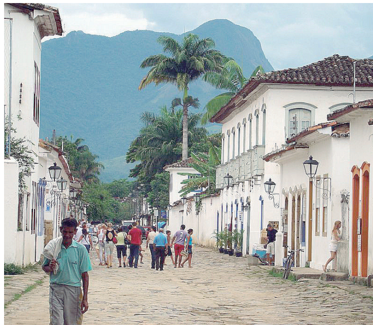
► A cidade de Paraty oferece grande diversidade de artesanato e bons restaurantes

Praia Tambaba, primeira praia nordestina destinada à prática do naturismo. João Pessoa conta com paisagens paradisíacas que podem ser apreciadas em qualquer época do ano. A culinária da região é muito rica. Os visitantes podem experimentar pratos típicos feitos com camarões, lagostas e a carne-de-sol paraibana que faz um imenso sucesso entre os turistas. A cidade oferece também passeios culturais que relembram a história da cidade e a arquitetura colonial portuguesa, como a Igreja e o Convento de Santo Antônio. Para agitar a viagem, o campista pode contar com os animados ritmos nordestinos, como o forró, repentes, folguedos, xaxados e coco de roda.