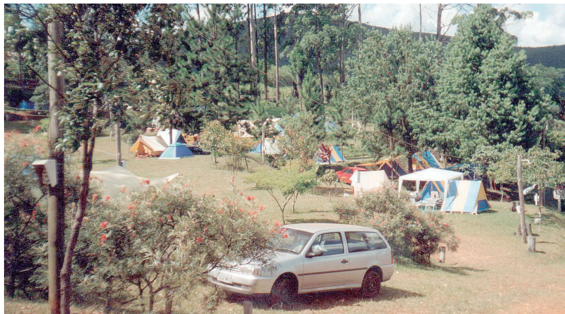
► No roteiro das cidades históricas de Minas Gerais, o Camping de Ouro Preto

Atrativos - A arquitetura barroca é a predominante em Ouro Preto. Igrejas e construções históricas erguidas no século XVIII espalham-se pelas ladeiras da cidade. No roteiro cultural o Museu do Aleijadinho é uma das mais belas opções. O lugar reúne peças atribuídas ao genial artista e documentos sobre sua vida. Vale a pena também conhecer a Igreja de Nossa Senhora do Carmo, projetada por Manuel Francisco Lisboa, pai de Aleijadinho. Os campistas não podem deixar de conhecer o Parque Estadual do Itacolomi, que oferece desde trilhas para caminhadas leves até expedições de aproximadamente 40km, além de belas paisagens. O souvenir típico de Ouro Preto, o artesanato em pedra-sabão, é