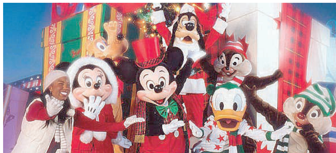
▶ Já estão abertas as reservas para os passeios à Disney, com orçamentos bastante acessíveis

Rua Senador Dantas, 75 – 27º andar – sala 2707