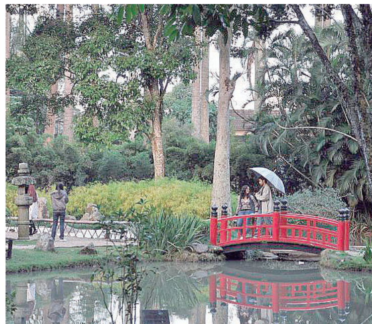
► Para quem acampa no Recreio, visitar o Jardim Botânico é programa de dia inteiro

Entre os diversos pontos para visitas, destacam-se o Centro de Visitantes, a Aleia Barbosa Rodrigues, a Aleia Custódio Serrão, a Aleia Pedro Gordilho, o Chafariz Central (Chafariz das