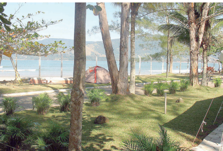
► Tudo pronto para o retorno ao passado em Ubatuba