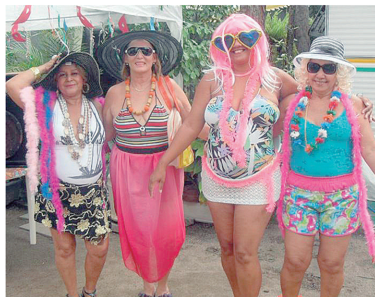
► A festa à fantasia é um sucesso que vai se repetir neste ano

Acesso - Para quem vem pela Rodovia Washington Luiz ou Via Dutra, o melhor caminho é pela Linha Amarela. Depois de vencer os seus