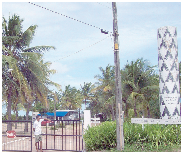
► O Camping de João Pessoa é uma rara oportunidade de acampamento no litoral do Nordeste

Atrativos - João Pessoa é uma cidade de muitos atrativos naturais, um dos mais famosos é a Ponta do Seixas, conhecido como o lugar onde o sol nasce primeiro no continente. Outro local é a barreira do Cabo Branco, onde está localizado o Farol. Na cidade, há também a