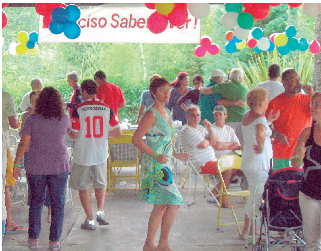
► Mais uma vez, o clima aconchegante de Mury vai combinar confraternização com feijão e samba

Acesso – Do Rio de Janeiro é percorrida uma distância de 150Km, através da BR-101, seguindo em direção a Rio Bonito. Logo depois de contornar o perímetro urbano de Itaboraí, é preciso seguir por Cachoeira de Macacu, sempre subindo a serra em direção a Nova Friburgo. O acesso ao camping é feito no Km 69 da rodovia Rio-Friburgo, dobrando à esquerda, aproximadamente 2 km após o início da descida da serra - agora em direção à cidade - em frente ao totem de limitação de velocidade.