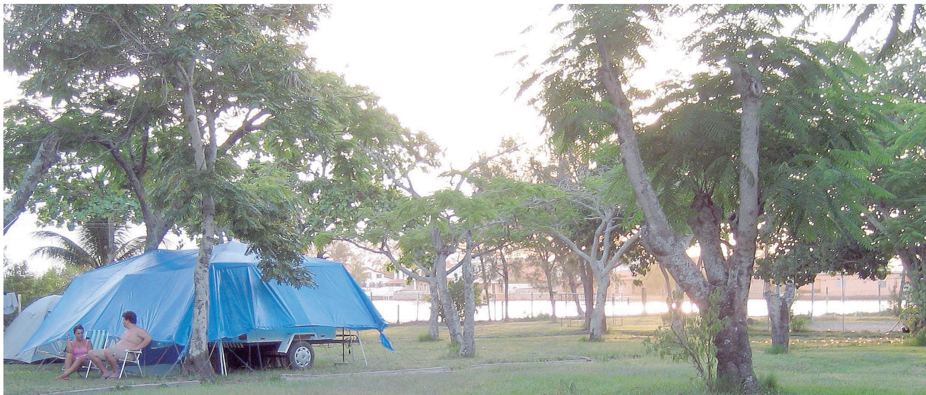
► O Camping de Cabo Frio ainda se refaz da melhor degustação do Bobó de Camarão e já se prepara para um festival de sardinhas (Página 8)