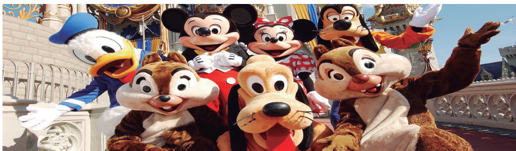
► O sonho da Disney está lançando seus programas para as férias de verão

Rua Senador Dantas, 75 - 27º andar - sala 2707 Rio de Janeiro (RJ) - Tel/Fax: (21) 2240-5390