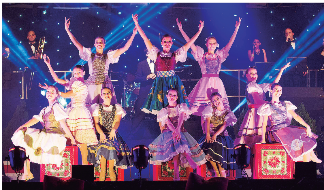
► O Sonho de Natal cresce ano a ano, atraindo milhares de turistas

O espetáculo Simplesmente Natal, em forma de concerto reúne mais de 200 artistas