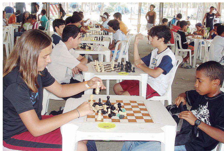
► Mais uma etapa dos circuitos deste ano

No dia 19 deste mês, terá o L Torneio Aberto no camping do Recreio dos Bandeirantes. Conforme informado na última edição do jornal O Campista, segue abaixo além dos resultados dos torneios realizados no dia 14 de setembro, o resultado dos campeonatos do dia 31 de agosto, que foram os XXXIV Torneio Escolar Equipes e o CXLVIII Torneio Aberto.