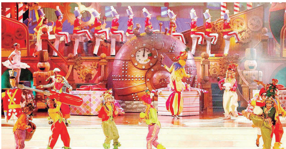
► Nas ruas de Gramado, os espetáculos de Natal se sucedem por mais de dois meses

Outra alteração será o roteiro da Fantástica Fábrica de Natal. A menina Sofia agora terá a companhia de Alice, e o roteiro e as músicas foram totalmente renovadas. “O pal-