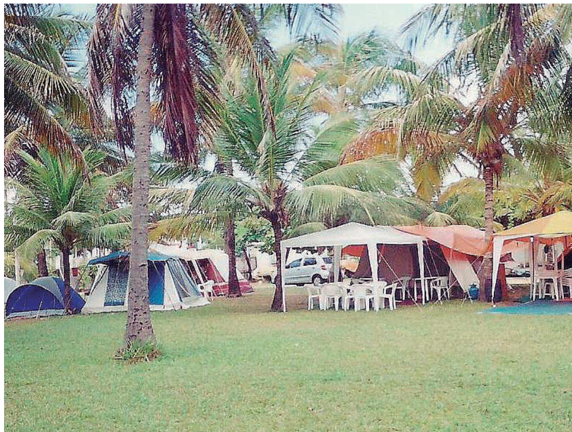
► O Camping de Aracaju é uma rara oportunidade de acampamento no litoral nordestino

Atrativos - Aracaju tem como pontos fortes os atrativos naturais e culturais. O destaque litorâneo fica por conta da famosa praia de Atalaia, point dos finais de semana, que possui restaurantes à beira-mar e onde o artesanato local chama a atenção. Quem busca tranquilidade, pode visitar o litoral sul da cidade, que reúne praias encantadoras, como a de Aruana, Robalo, Naufrago e Mosqueiro. Para aqueles que gostam de esportes radicais, a cidade também tem praias ideais para a prática de surf, como Jatobá e Costa. Se o campista desejar um roteiro mais cultural, uma visita ao centro histórico de Aracaju é indispensável. Completamente revitalizado, o lugar proporciona um verdadeiro passeio pela história, através de seus casarões, praças e mercados.