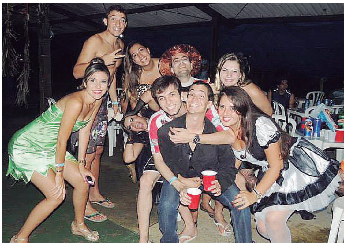
► Mais uma vez, os campistas vão se divertir com a descontração à fantasia

Acesso - Para quem vem pela Rodovia Washington Luiz ou Via Dutra, o melhor caminho é pela Linha Amarela. Depois de vencer os seus 15km, onde há um posto do pedágio para veículos, siga para a Barra da Tijuca passando Pela Av. Ayrton Senna, dobrando à direita na Av. das Américas, em direção ao Recreio. Quem quiser evitar a Linha Amarela, pode optar por uma opção mais longa e curtir o belo visual da orla marítima, seguindo pela Linha Vermelha, em direção a Copacabana, via Av. Atlântica, entrando depois em Ipanema, via Av. Vieira Souto, em direção a São Conrado e Barra da Tijuca. O camping fica a 45 km do centro do Rio, na Estrada do Pontal, 5.900, em frente à praia.