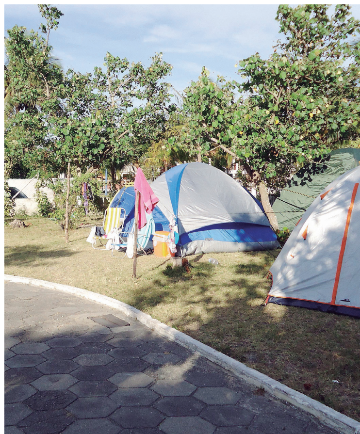
► O camping fica junto das mais lindas praias da região

Para desfrutar a primavera, nada melhor que um balneário da Região dos Lagos, no Rio de Janeiro, para fazer parte do destino dos campistas nos finais de semana e feriados. Arraial do Cabo oferece uma programação desde os banhos de sol em suas lindas praias de águas cristalinas até os melhores pontos para atividades mais aventureiras, como o mergulho, pesca e o surf. Não é à toa que a cidade é conhecida como a Capital do Mergulho.