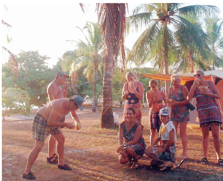
▶ A 25km de Natal, direto pela BR-101, o pomar e o espelho da Lagoa do Bonfim

um perfil mais cultural, o visitante não pode deixar de conhecer lugares como a Matriz de Nossa Senhora da Purificação, o prédio da antiga Cadeia Pública, o prédio da Pousada Colonial e a Casa Colonial do Beco das Garrafas além de belas construções do século XIX que fazem parte do turismo histórico e arquitetônico.