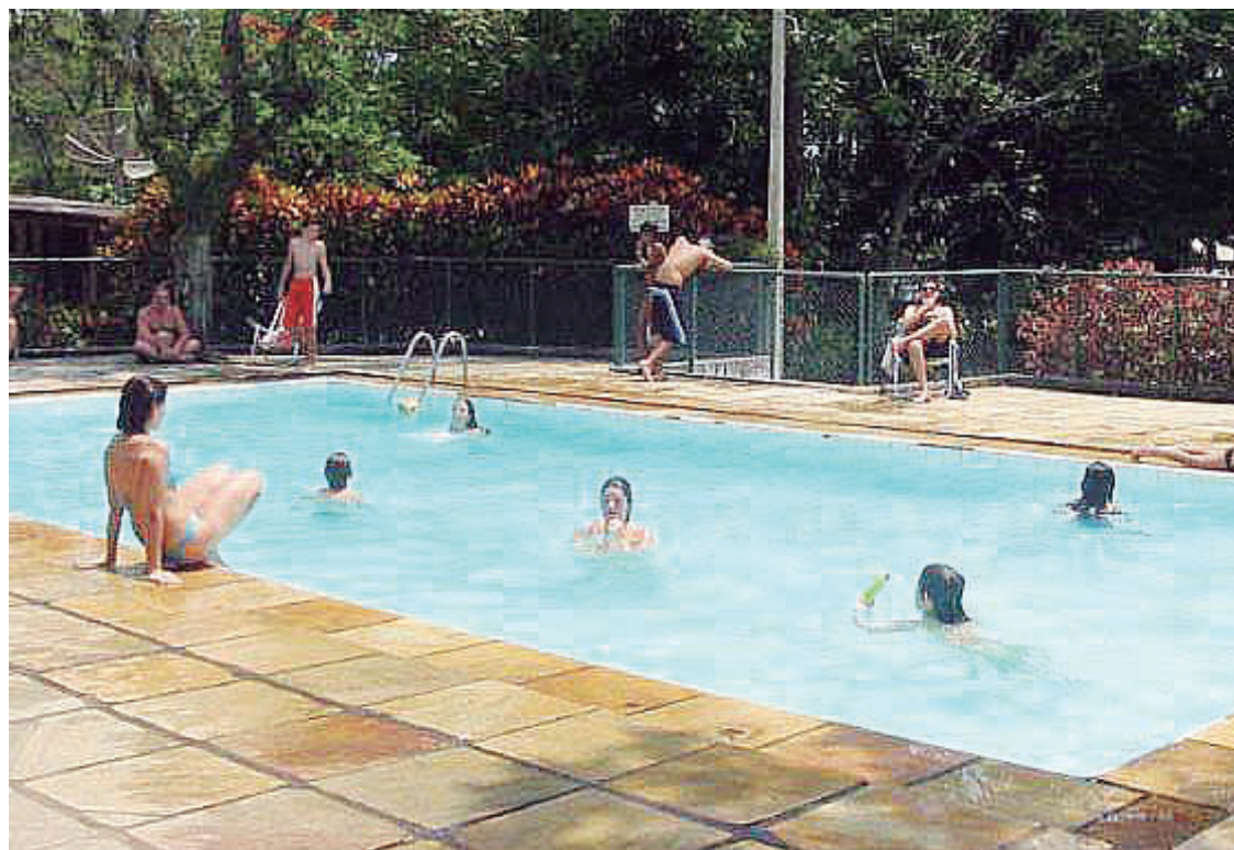
► Cercado de muito lazer e esporte, mais um evento de confraternização no camping

Acesso – A 261 km do Rio de Janeiro e a 185 km da capital paulista, os que vêm dessas cidades precisam seguir pela Rodovia Presidente Dutra até o km 60, em Guaratunguetá, onde está localizado o camping Clube dos 500.