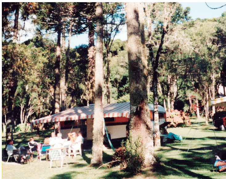
► O Camping de Canela recebe campistas que participam do melhor Natal da Serra Gaúcha (Página 4)

Aproveite os feriados na primavera para curtir seu camping