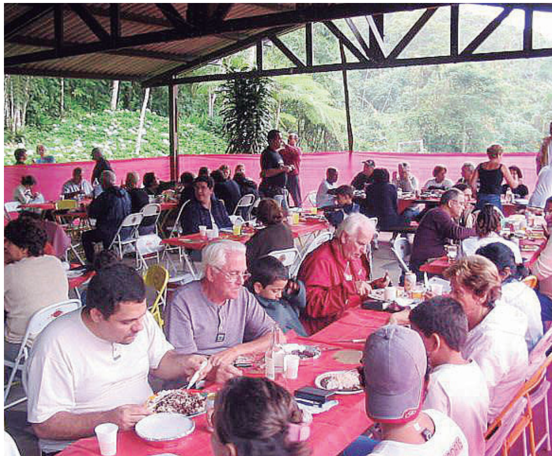
► Cercados de lazer e natureza, mais um Sambão e Feijão