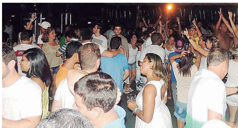
► Os eventos de réveillon deste ano nos campings encerram nosso calendário de festas

Na próxima edição, O Campista irá divulgar os campings que irão realizar as confraternizações de final de ano. Venha com sua família garantir sua estadia nos campings nessa data tão especial.