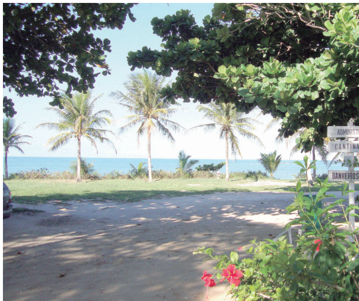
▶ As praias de Prado são a maior atração do camping