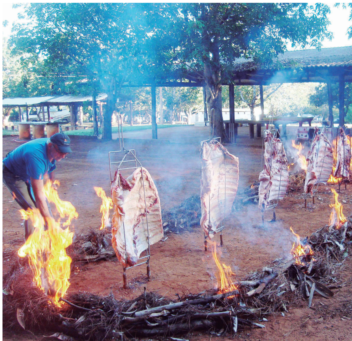
■ A Costelada de Caldas Novas, com mais de 20 anos, é uma das principais atrações gastronômicas do Calendário

UM MOSQUITO NÃO É MAIS FORTE QUE UM PAÍS INTEIRO