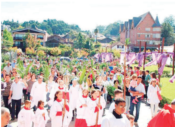
■ A Procissão de Ramos em Gramado encanta os seus visitantes