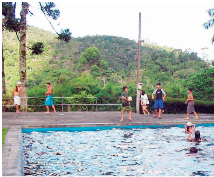
■ O Camping de Mury oferece muitas atividades de lazer aos campistas

A cidade possui também importantes reservas e propriedades rurais como o Parque Natural Municipal David Victor Farina,