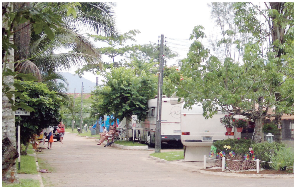
■ A praia de Maranduba, com águas límpidas, fica defronte ao Camping

Acesso – Para quem vem de São Paulo é necessário seguir pela Rodovia Dutra até São José dos Campos, pegar a Rodovia dos Tamoios até Caraguatatuba e entrar na Rodovia Rio-Santos (sentido Rio de Janeiro) até Ubatuba. Aqueles que vêm do Rio de Janeiro devem ir pela Rodovia Dutra e seguir no sentido de Taubaté. Depois é