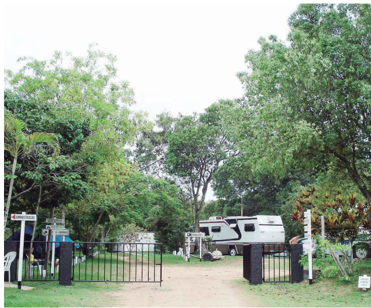
■ O bosque aconchegante de Aracruz se completa com a praia fronteiriça de Putirí