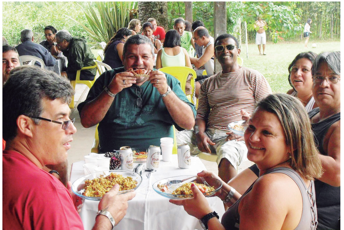
■ O Camping de Mury abre a temporada das confraternizações gastronômicas

Acesso- Saindo do Rio de Janeiro, o acesso se dá pela Ponte Rio-Niterói, seguindo-se pela BR-01 (Niterói-Manilha) contornando pela direita o perímetro urbano de Itaboraí, na direção de Rio Bonito. Em seguida, deve-se dobrar à esquerda para Cachoeiras de Macacu e Nova Friburgo. O acesso ao camping se faz pela rodovia Rio-Friburgo, dobrando-se novamente à esquerda, aproximadamente 2 km após o início da descida da serra - agora em direção à cidade - em frente ao totem de limitação de velocidade (lombada eletrônica).