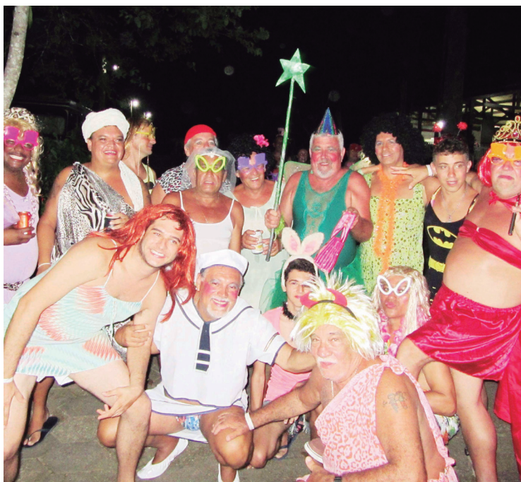
■ Os foliões em Ubatuba se divertiram a valer nos bailes e blocos internos

O camping do Recreio dos Bandeirantes realizou, no domingo, dia 07 de fevereiro, o Bloco das Piranhas, que teve a participação de 200 pessoas. O bloco teve também um carro de som percorrendo as ruas do CCB das 16h30 às 19h. Durante a noite, teve o show da Escola de Samba das Vargens no pavilhão da praia. O show teve início às 19h30 e terminou às 21h. Na segunda-feira, dia 08, foi a vez do baile infantil e desfile para as crianças onde todas as crianças receberão medalhas. O baile teve início às 19h e terminou às 21h. A diversão foi garantida entre os campistas e amigos convidados.