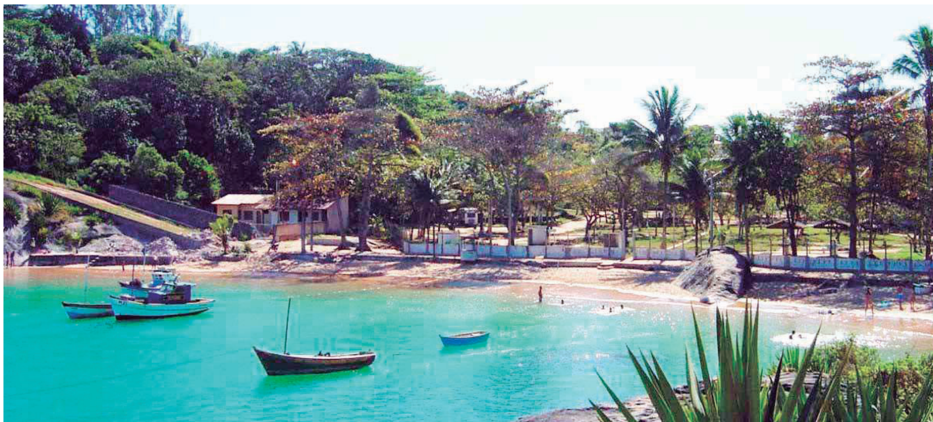
■ O Camping de Guarapari, defronte à enseada de Setiba, oferece aos campistas natureza e tranquilidade

RIO DE JANEIRO - MARÇO DE 2016 - Nº 517 - ANO XLIV