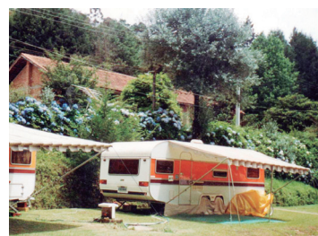
■ Camping de Campos do Jordão

CAMPOS DO JORDÃO (SP-02) – Estrada do Horto Florestal, bairro Rancho Alegre. Instalações-padrão, luz para equipamentos (220v), chuveiros quentes, pavilhão de lazer, lareira e play-ground. NÃO TEMPORADA: R$ 11,40 mais equipamento de R$ 2,90 até R$ 19,30; TEMPORADA (Mai. Jun. e Jul.): R$ 17,90 mais equipamento de R$ 4,50 até R$ 30,20.