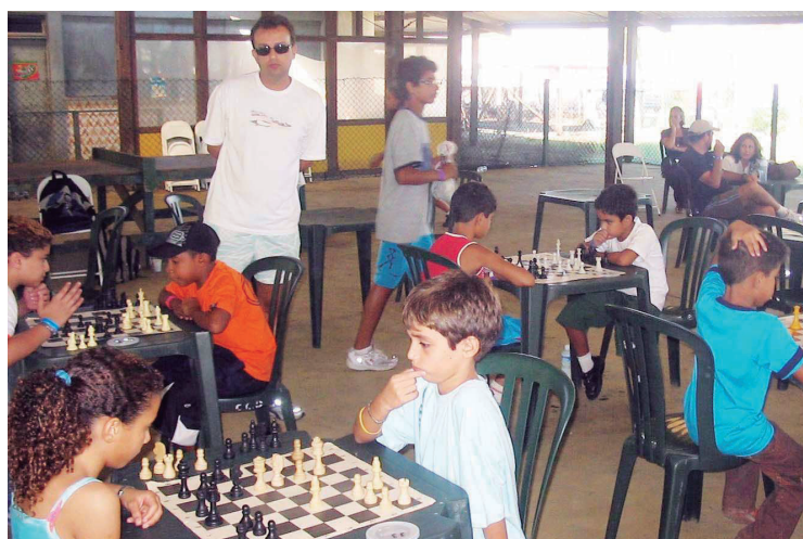
Enxadristas cariocas se movimentam para mais uma temporada do esporte este ano

Em todos os torneios, as inscrições poderão ser antecipadas pela Internet ou registradas nos dias das competições, entre 09h e 09h30, sempre aos domingos. Cada participante deverá comparecer com suas próprias peças de xadrez (Branças e Negras). A seguir, estão as datas das competições neste ano: