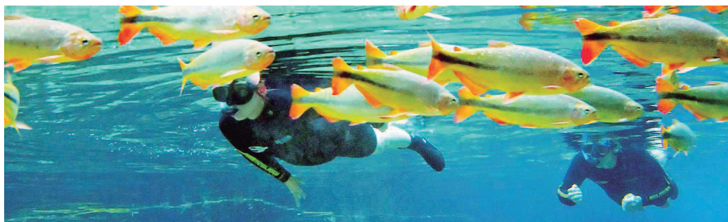
■ As águas cristalinas dos rios de Bonito oferecem um espetáculo indescritível no Pantanal

Programe um passeio originalíssimo pelo Rio Amazonas, a bordo de um iate confortável, partindo de Manaus. A Amazon Santana oferece esta oportunidade entre as belezas e os mistérios da floresta tropical em um roteiro de cinco dias. No programa estão incluídos visita ao Parque das Anavilhanas, passeios de canoas, observação de aves, convivência com botos cor-de-rosa, visita à Aldeia Indígena Dessana, incursões pelo Rio Negro. E muito mais! Consulte a CCTUR.