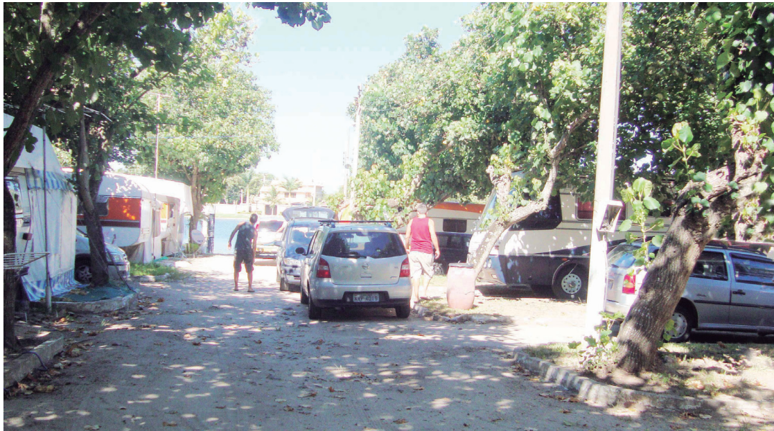
■ Defronte ao Canal do Itajuru, o camping vai completar seus 50 anos

talinas e a natureza exuberante fazem um convite tentador para se conhecer Cabo Frio. Entre as praias, a mais conhecida e badalada é a do Forte, com extensão litorânea de 7,5 km, de areia branca e fina que completa o cartão-postal da cidade. Em seu extremo esquerdo fica o Forte São Mateus, uma construção portuguesa do século XVII, onde o mar é mais calmo, e à direita duas outras praias a delimitam; a Praia das Dunas que é