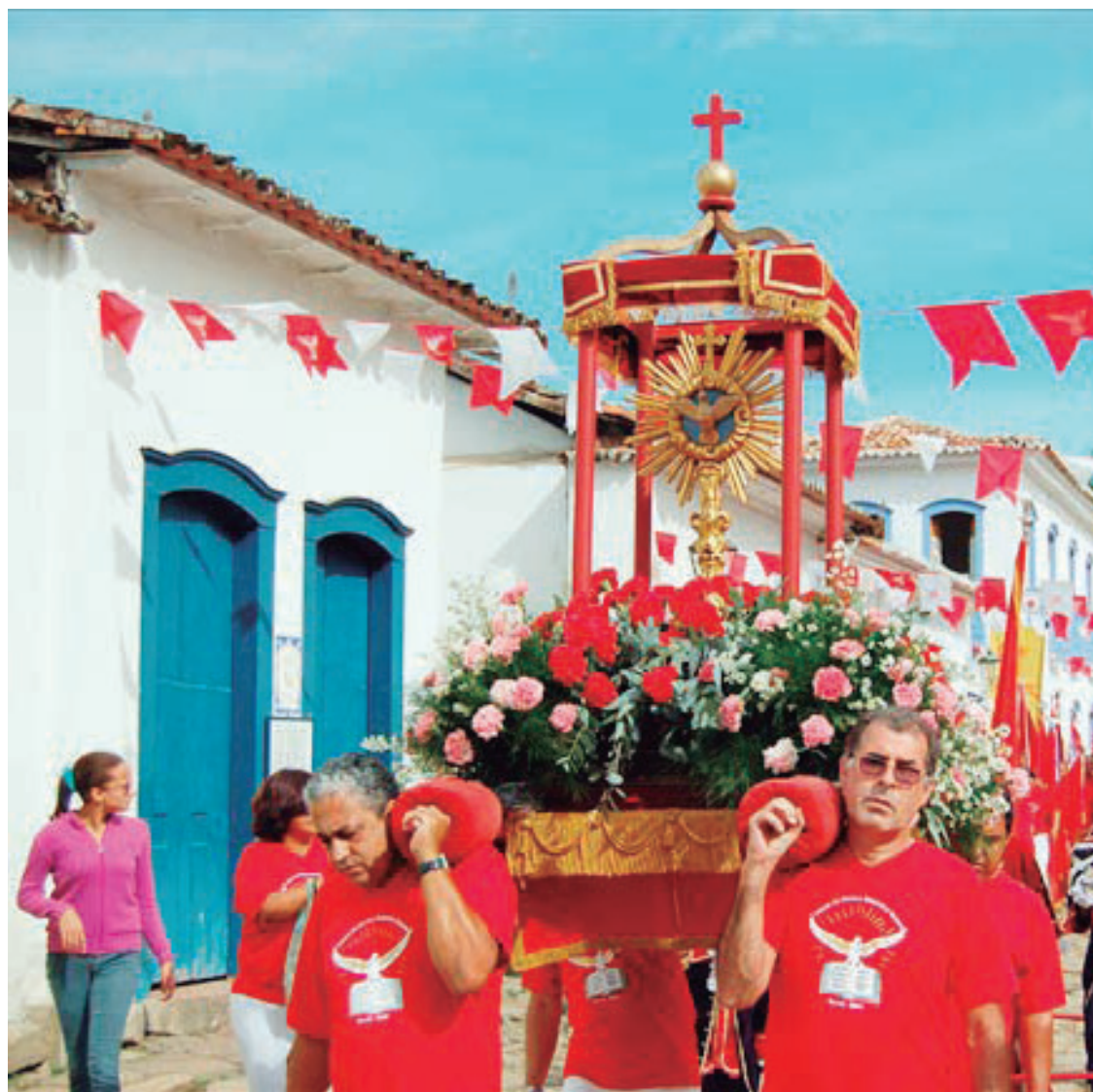
As procissões do Divino pelo centro histórico de Paraty encantam os visitantes da cidade