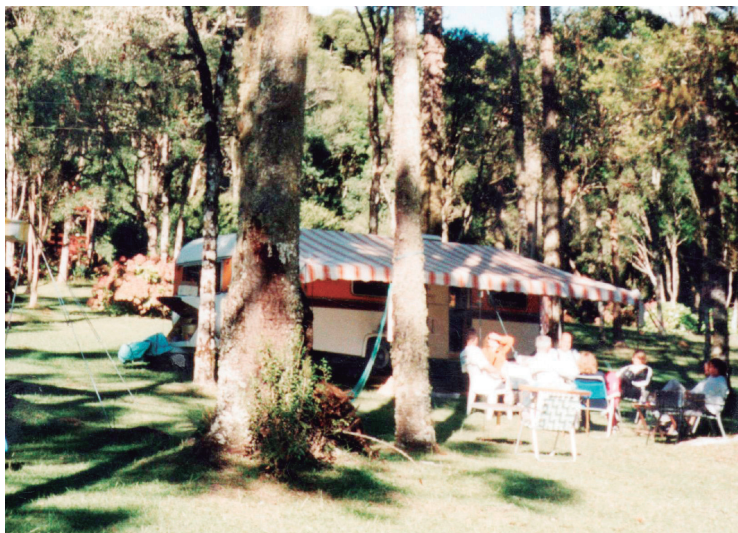
■ O Camping de Canela convida para as festas da Semana Santa na Serra Gaúcha

Acesso - Para se chegar ao camping de Canela, na Rodovia RS-235 que liga Canela a Gramado, basta pegar a estrada asfaltada que dá acesso ao Parque do Caracol. Percorridos quatro quilômetros, subir à direita e de lá percorrer mais um quilômetro até o RS-01.