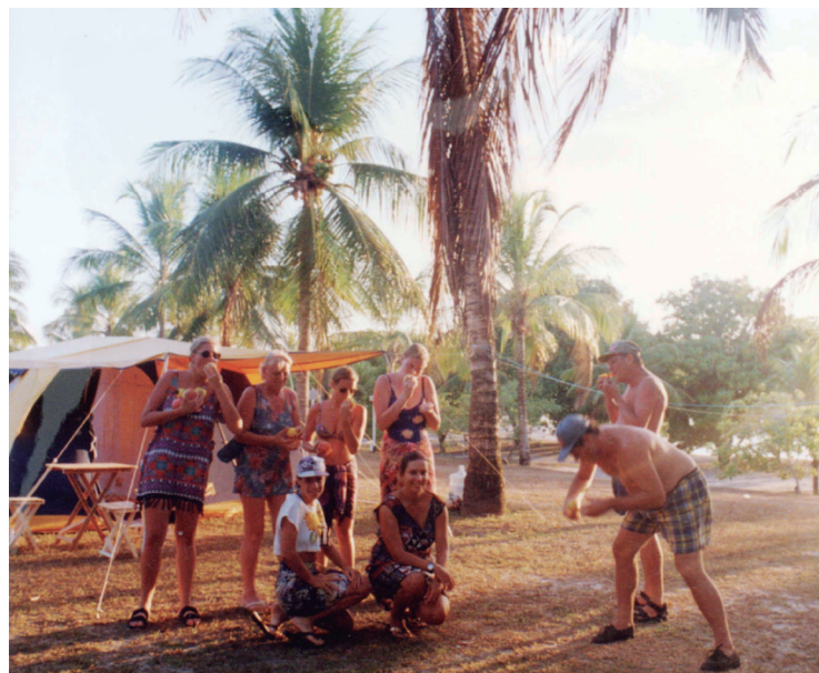
■ Na imensidão da Lagoa do Bonfim, os campistas se divertem com esportes náuticos

o Parque Natural Municipal do Aricanga e a Reserva Biológica de Comboios, que preservam espécies de fauna e flora dos ecossistemas naturais.