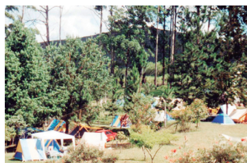
■ Camping de Ouro Preto

OURO PRETO (MG-01) – Estrada dos Inconfidentes, a 2 km do Centro. Tel.: (31) 3551-1799. Instalações-padrão, luz para equipamentos (110 v), chuveiros quentes, quadra de esportes. NÃO TEMPORADA: R$ 10,10 mais equipamento de R$ 1,20 até R$ 16,90; TEMPORADA (16/Dez. a 28/Fev.): R$ 12,10 mais equipamento de R$ 1,60 até R$ 20,30.