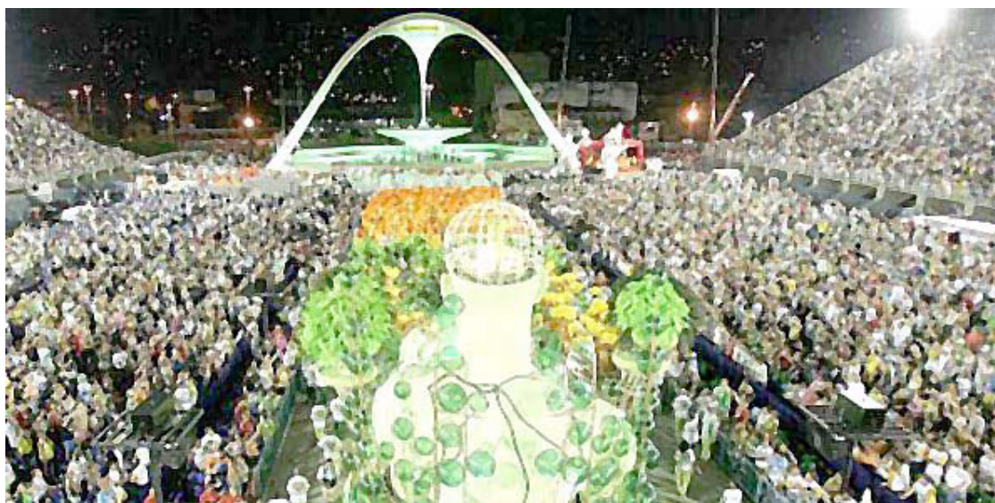
► O espetáculo dos desfiles na Sapucaí é o ponto alto do carnaval carioca

O desfile de um dos blocos mais tradicionais do Carnaval Carioca, o