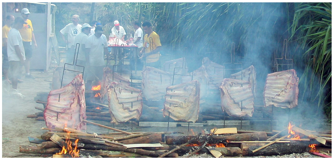
► O Camping do Recreio abre a temporada gastronômica com a sua segunda Costelada

A grande chance do feriadão neste ano está para os cariocas, que vão combinar em abril os feriados da Sexta-Feira Santa (dia 18), com o Dia de Tiradentes, no dia 21 (Segunda-Feira) e o dia dedicado a São Jorge, na Quarta-Feira (dia 23).