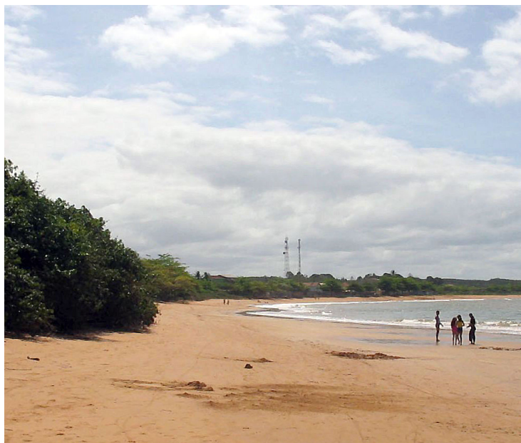
► A Praia de Putirí, fronteira ao Camping de Aracruz

Atrativos - Arraial do Cabo é conhecida como a "Capital do Mer-