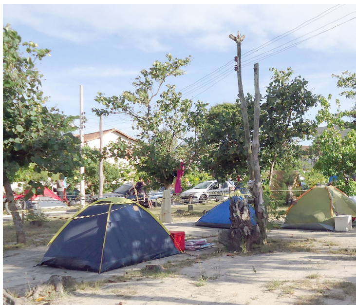
► Em Arraial do Cabo, o forte das atrações são os passeios e esportes náuticos