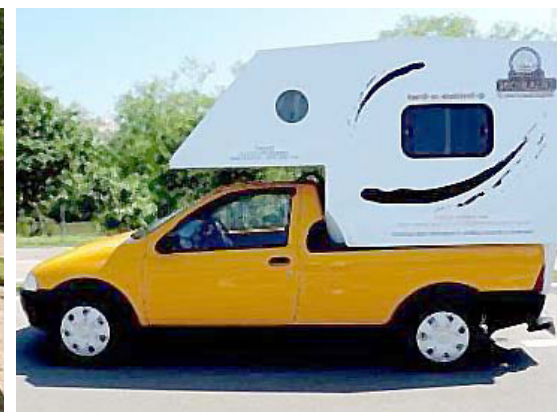
► A Camper Duaron oferece várias opções para cabines duplas ou simples, universal ou sob medida (Página 7)

Visite o site do CCB www.campingclube.com.br