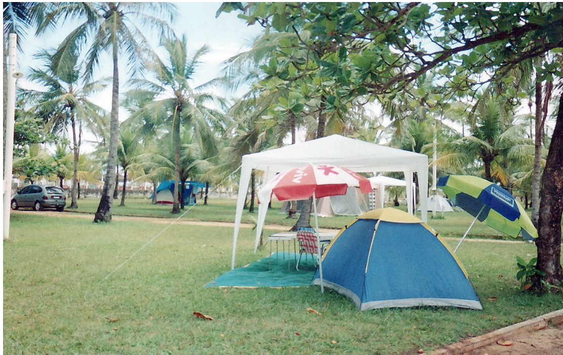
► O Camping de Aracaju é uma rara opção de acampamento no litoral do Nordeste

Na região central da cidade, a Praia de Atalaia é a responsável pelo maior movimen-