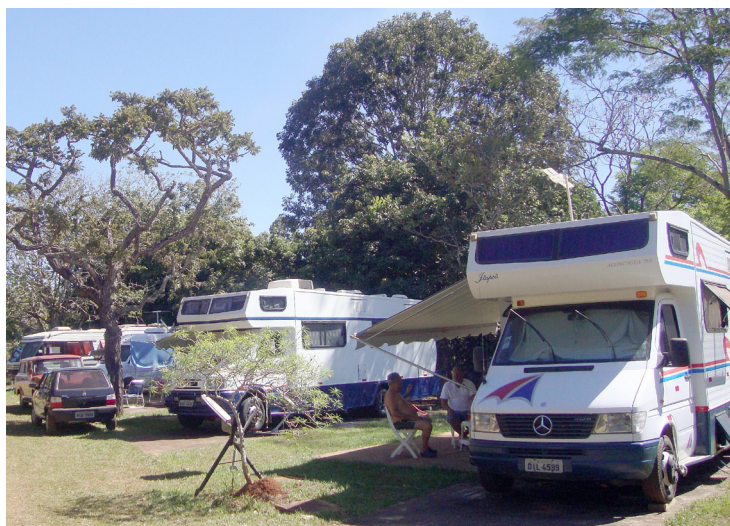
► O verão de Caldas Novas oferece sombra e água quente

Atrativos – A cidade atrai turistas do mundo inteiro pela comprovada capacidade terapêutica de suas águas termais que chegam até 51° e possuem proprieda-