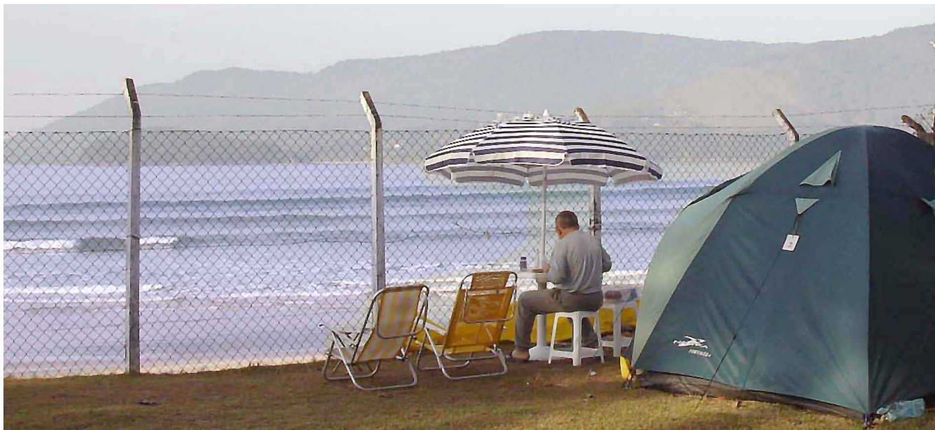
► Em Ubatuba, o campista pode optar pelo carnaval contagiante da cidade ou pela paz do camping e da praia (Página 3)