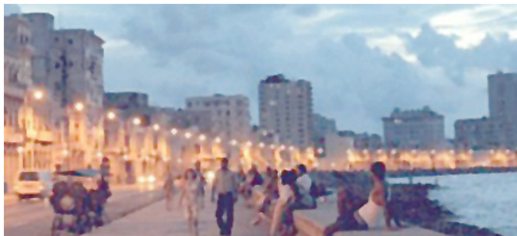
▶ Em Havana, a capital cubana, as praias se mantêm lindas e iluminadas à noite

- Embarque no Navio Iberostar Grand Amazon e participe de roteiros inesquecíveis pelo Rio Amazonas e afluentes, proporcionando hospedagem e infraestrutura com o mesmo charme e luxo dos cruzeiros internacionais. Consulte a CCTUR para mais informações.