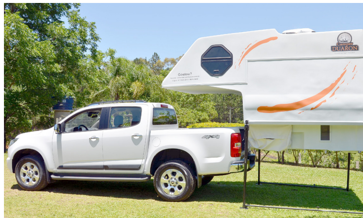
► Os modelos da Duaron primam pela praticidade e sofisticação

Os campers para cabine dupla são universais para todas as camio-