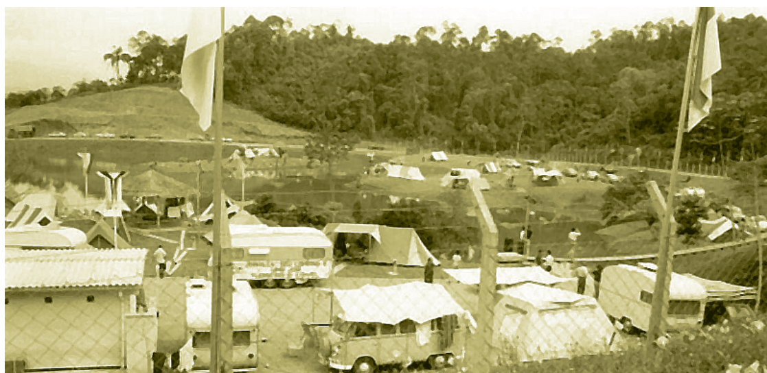
► O Camping de Joinville abrigou milhares de turistas em seus dez anos de glória

Em 1982, um outro prefeito preferiu não reformar o convênio e desativou o camping que, pelo visto, há mais de 30 anos deixa saudades entre os joinvilenses.