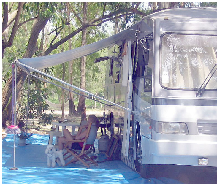
► O Camping de Arroio Teixeira oferece um bosque de tranquilidade e uma praia serena

gulho" e possui muitos pontos deste tipo, alguns em locais de famosos naufrágios além de museus que também podem ser visitados com guias especializados. Uma grande atração da cidade é o passeio de barco pela Gruta Azul e pela Praia do Farol que revelam a beleza natural da região. A Praia Grande, no Centro, é uma das mais disputadas por turistas. Com suas águas geladas de 12 a 20 graus, se caracteriza por ser perfeita para passeios de moto e buggy na areia, e pelo bellissimo por do sol. Em relação aos pontos históricos, Arraial tem muito a oferecer, como a Igreja Nossa Senhora dos Remédios, a 500m do centro, na Praia dos Anjos, como curiosidade, vale a pena conhecer a Estátua da Sereia Lorelei, uma antiga lenda da cidade, que fica localizada em um lago artificial, construído na Praça Daniel Barreto.