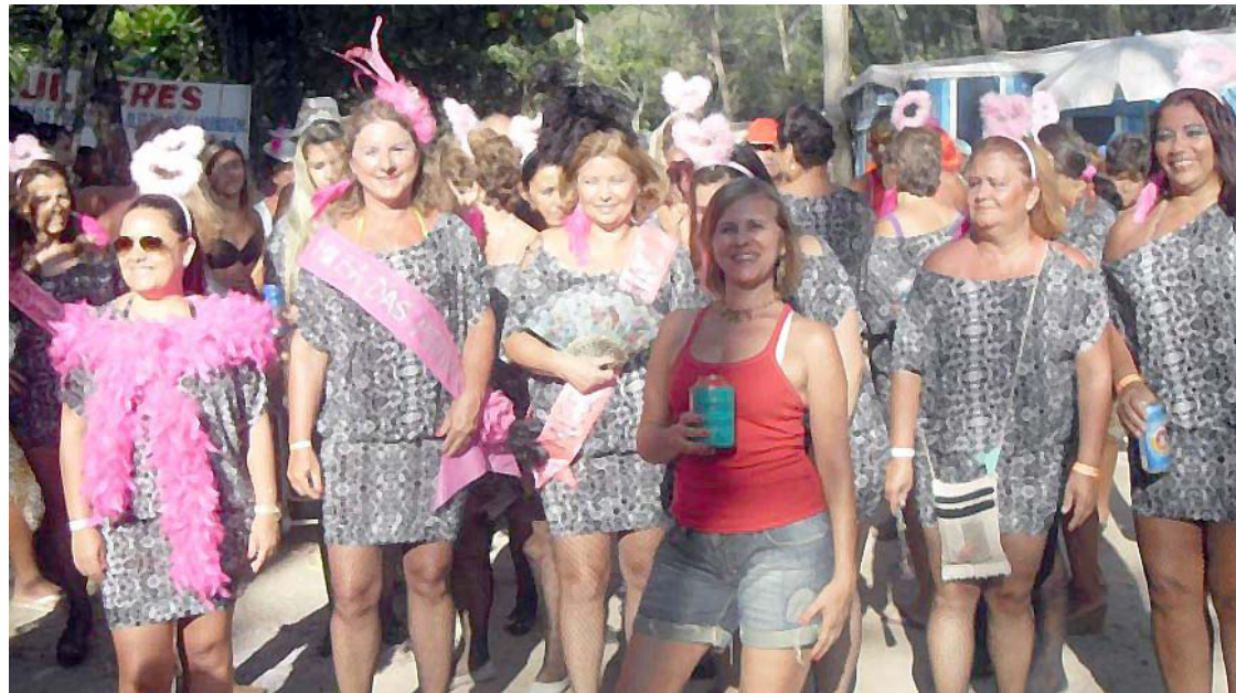
► No Camping do Recreio, existem opções de descanso ou de blocos internos

Acesso - Para quem vem pela Rodovia Washington Luiz ou Via