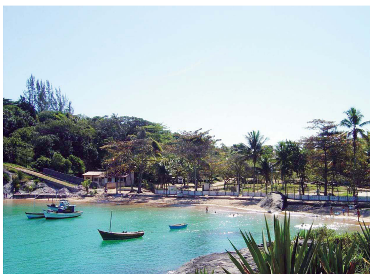
■ Aproveite o sol da primavera no Camping de Guarapari

Festa Fantasy anima o RJ-10 este mês Pág.07