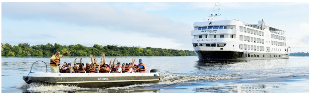
■ Experimente as emoções de um Réveillon diferente a bordo do Grand Amazon. Consulte a CCTUR

Desfrute de uma Noite de Réveillon inesquecível a bordo do navio Grand Amazon, da Iberostar, em um cruzeiro pelo Rio Amazonas partindo de Manaus. São cinco noites de programa com três noites a bordo, com requinte e conforto. Saída de Manaus no dia 28 de dezembro. Apenas R$ 6.999,00 por pessoa à vista ou entrada de R$ 1.401,00 mais nove parcelas de R$ 622,00. Consultas e reservas com a CCTUR.