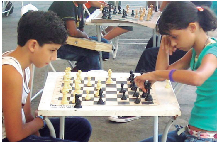
■ O bom do xadrez é o entrosamento entre as gerações

Camping – Um dos mais belos campings da rede, o camping de Mury (RJ-08), fica a poucos quilômetros de Friburgo. Localiza-se em meio a muito verde, com uma área de 45 mil m 2 . O RJ-08 tem capacidade para mais de 200 equipamentos e módulos específicos para trailers e motor-homes em trânsito. Além das instalações-padrão, possui campo de futebol society, quadra de vôlei, piscina natural, sauna, churrasqueira e pavilhão de lazer. Dentro do camping, há também uma queda d'água de fonte natural.