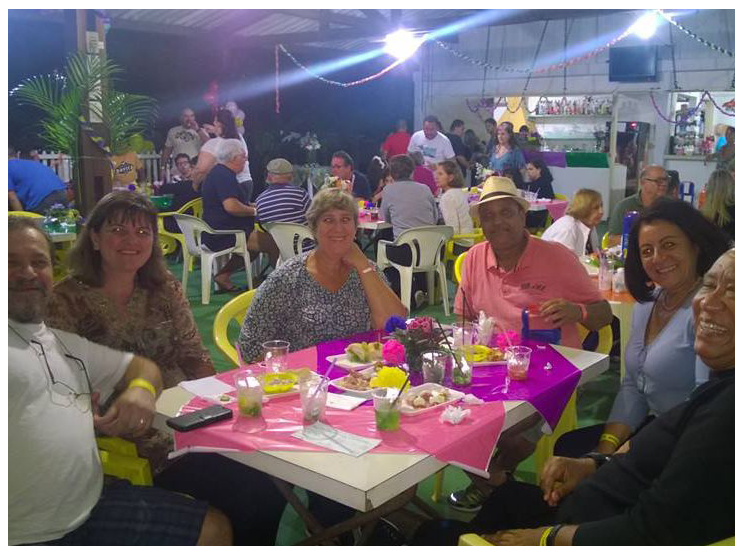
■ Sob a chancela da cantina renovada, os campistas saudaram a estação das flores

COMPLETO - NOVÍSSIMO - TRAILCAR 1996 - MOTOR TRASEIRO MERCEDES BENZ 1995 INTERCULADO - ÚNICO DONO - DIREÇÃO HIDRÁULICA - 3 BATERIAS DE 150 AH (NOVAS) - GERADOR YAMAHA 6 KVA/GASOLINA/ PARTIDA REMOTA - CONVERSOR SINUELO 12V / 110V / 1,75 KVA - ACESSÓRIOS COMPLETOS DE COZINHA / BANHEIRO / LAVANDERIA / SOM - 2 TVS 14" - ANTENA WINEGARD - CÂMERA DE RÉ - ENGATE TRASEIRO - MOBILIÁRIO - CORTINAS - TOLDO DE LONA ACRÍLICA - 7 PNEUS CONSERVADOS. MÁRIO RENATO AZEREDO: (62) 3246-7200 / 9 9971-1061