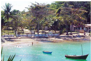
■ Camping de Guarapari

ARACRUZ (ES-04) – Estrada da Barra do Sahy, Praia do Putirí. Tel. Público (27) 3250-7050. Instalações–padrão, luz para equipamentos (220v), quadra de esportes, play–ground, praia fronteira. NÃO TEMPORADA: R$ 12,80 e mais equipamento de R$ 3,00 até R$ 23,40; TEMPORADA (16/Dez. a 28/Fev.): R$ 17,40 mais equipamento, de R$ 4,40 até R$ 35,10.