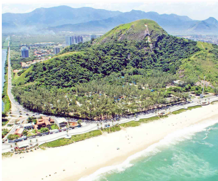
■ Ano a ano, o Recreio se moderniza com suas atrações urbanas e turísticas