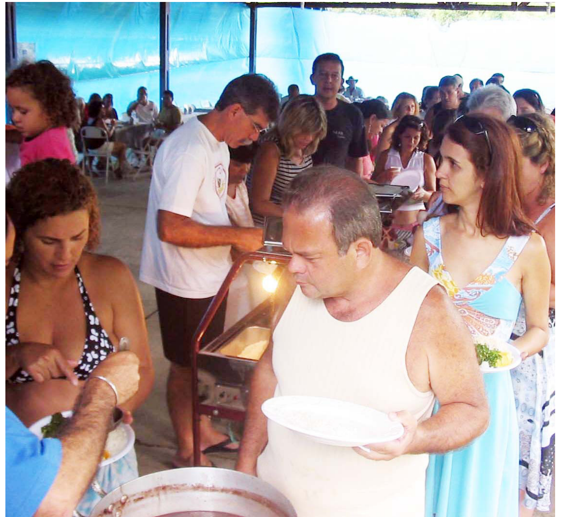
■ O pavilhão de lazer do camping convida os campistas à confraternização

O xadrez vem conquistando espaço com os torneios realizados no camping do Recreio dos Bandeirantes há muitos anos. Este tipo de jogo estimula a inteligência, dando a capacidade de raciocinar logicamente e também traz diversos benefícios a saúde, principalmente para os idosos no combate ao Mal de Alzheimer.