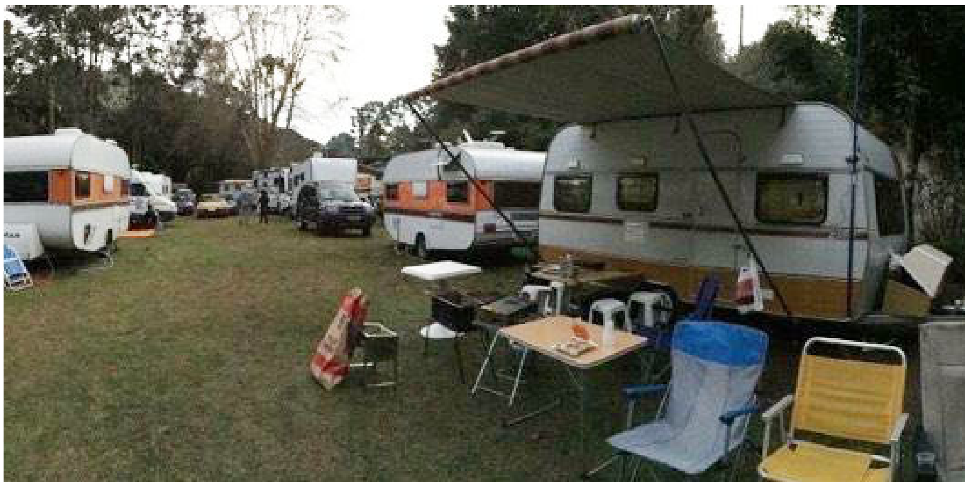
■ A grande novidade da Primavera/Verão no Camping de Campos do Jordão será o relançamento da cantina, sob nova direção

RIO DE JANEIRO - OUTUBRO DE 2016 - Nº 524 - ANO XLIV