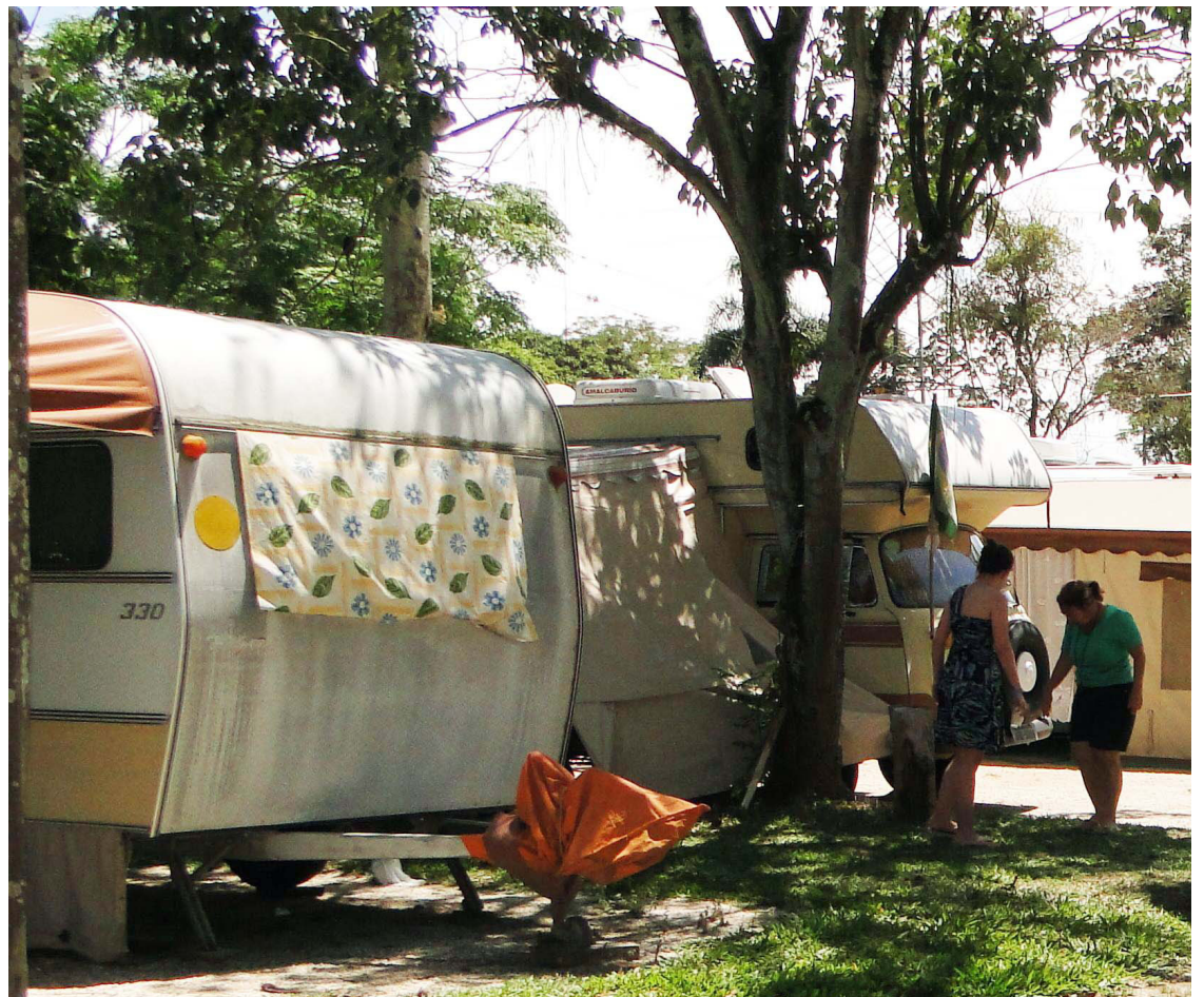
■ Diversos programas turísticos, culturais e religiosos são viáveis a partir da hospedagem no camping

Guaratinguetá também é bastante conhecida pelo lado religioso, já que é o local de nascimento de Frei Antonio de Sant'Ana Galvão, o primeiro santo do Brasil. Por isso, alguns dos lugares mais visitados no município são a a casa e o Museu de Frei Galvão, onde é possível encontrar um pouco da arte sacra, artesanato regional, documentos e objetos históricos e exposições. Em Aparecida, o destaque fica mesmo por conta da Basílica que recebe milhares de fiéis todos os meses.