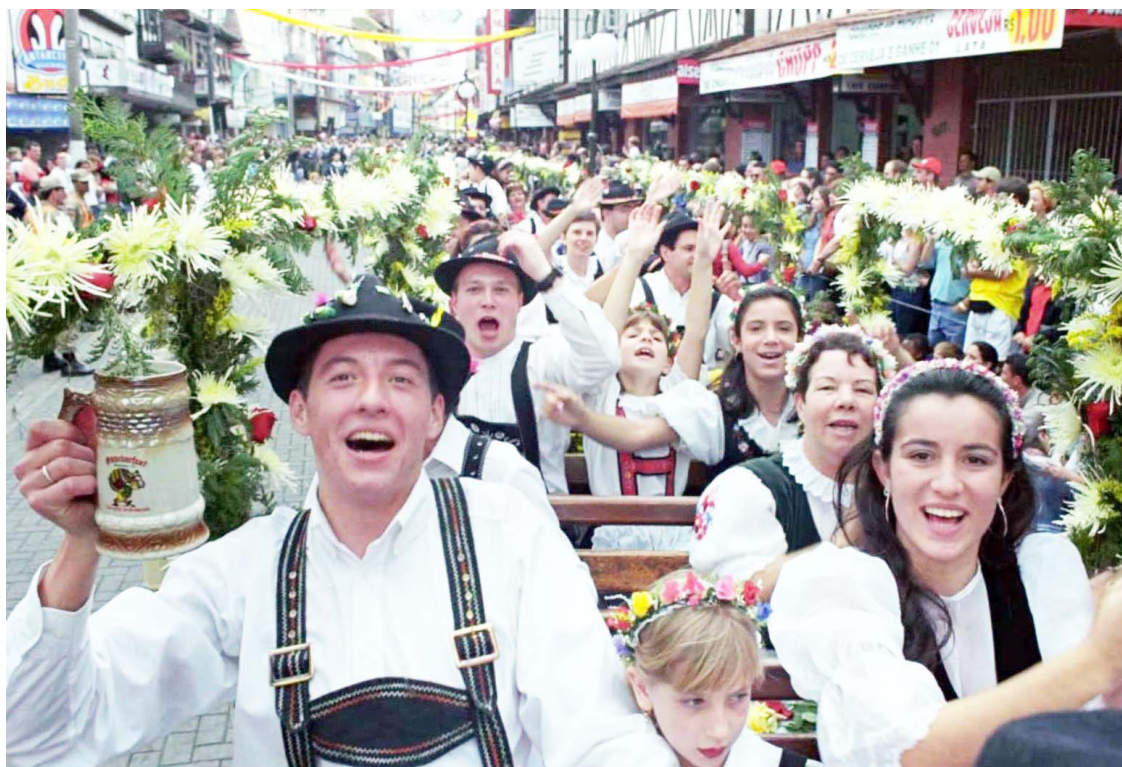
■ A cada temporada, cresce em animação e atrações a maior festa de cerveja do país

http://www.oktoberfestblumenau.com.br/festa-2016/programacao/ . Aproveite!