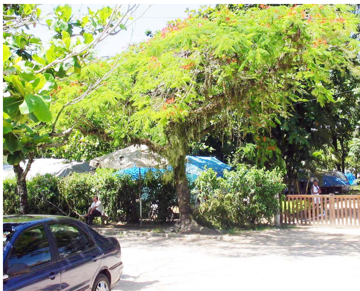
■ A estada no Camping de Paraty facilita as sucessivas atrações culturais da cidade