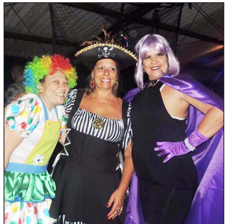
■ Além da alegria contagiante dos campistas, é de se admirar o capricho das fantasias

E para os dançarinos mais animados, a partir da meia-noite haverá aulas de zumba, a dança da moda que alegrou bastante os campistas durante os eventos olímpicos no camping.