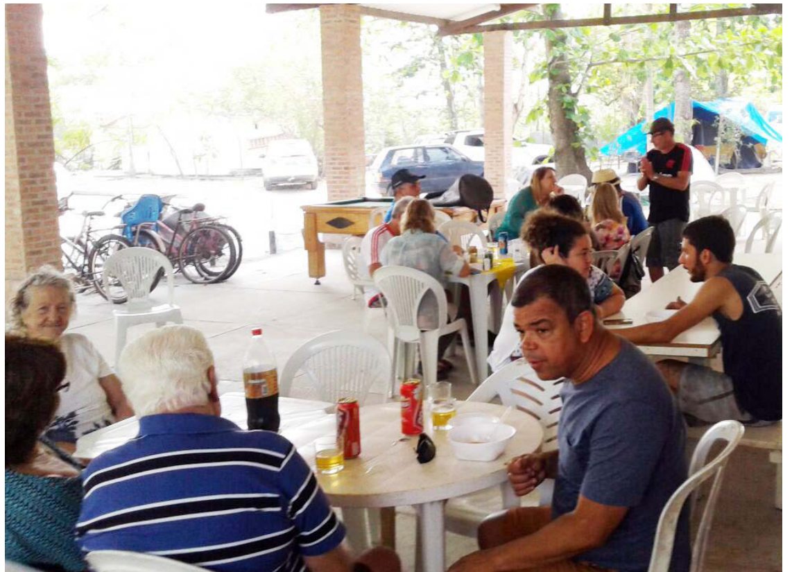
■ Mais uma vez, o pavilhão da cantina abrigou a confraternização entre os campistas