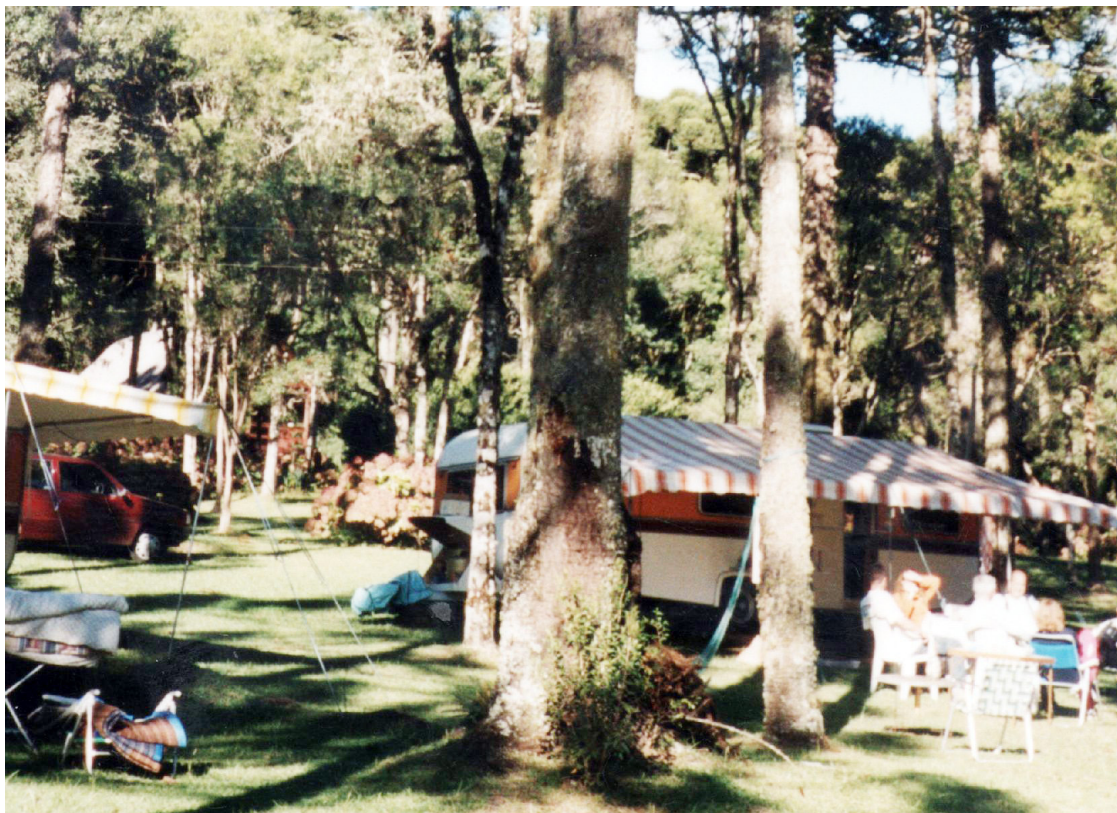
■ Com a amenidade do inverno que se foi, o camping fica mais convidativo

Camping - O camping do CCB está localizado a 837m de altitude, em Canela, numa bela área de 100.000 m 2 , na Estrada do Caracol, margeado por um riacho que corre sobre pedras, formando uma piscina natural. Num bonito bosque de araucárias, o RS-01 conta com um pavilhão de lazer com quadras de esportes, churrasqueiras cobertas, piscinas naturais e cancha de bocha, além das instalações-padrão.