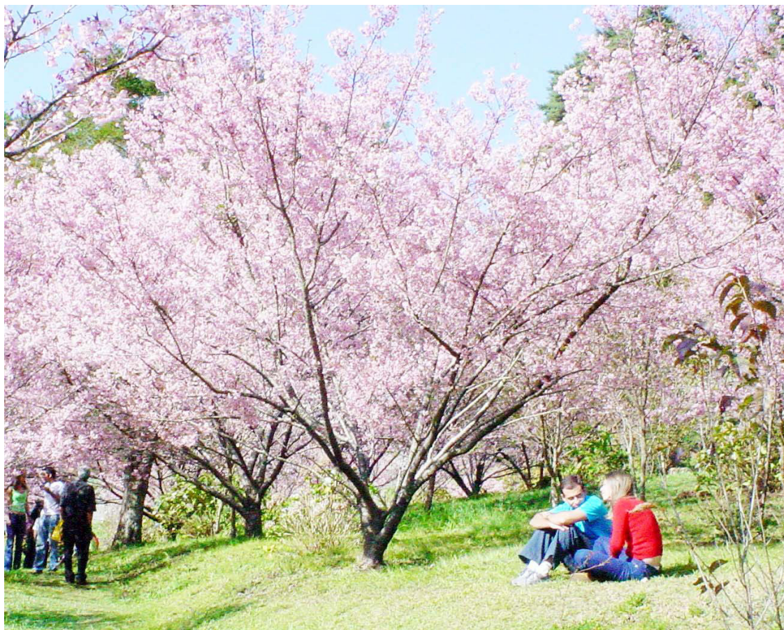
■ Além do requinte da rotina urbana, o espetáculo das flores, com as cerejeiras são maravilhosas

O acesso ao SP-02 para quem vem do Rio de Janeiro ou São Paulo é seguir pela Via Dutra. Campos do Jordão fica a 192 km da capital paulista, via Quiririm-Taubaté (SP-50) e a 184 km via Caçapava ou São José dos Campos (SP-123). Outra alternativa para quem vem de São Paulo é pela Rodovia Ayrton Senna e para quem sai de Belo Horizonte, o melhor é passar por Taubaté.