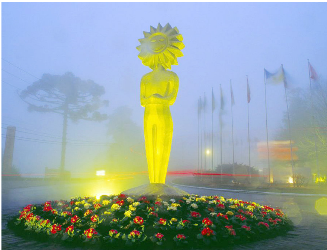
■ Depois de quatro décadas de sucesso, o Kikito já tem onde guardar a sua história

Gramado ganhou um novo atrativo: o Museu do Festival de Cinema de Gramado – MFCG. O empreendimento está localizado ao lado do Palácio dos Festivais e da Igreja São Pedro. Possui uma privilegiada área de 584 m 2 em um dos melhores pontos da região das hortênsias, oferecendo vista panorâmica para o centro da cidade com direito a cafeteria e loja de souvenir. Trata-se de um espaço único, digno da importância do maior e mais tradicional festival de cinema brasileiro, projetado para registrar a história e trajetória de mais de quatro décadas da sétima arte no nosso país, buscando aliar o interesse pelo cinema com mais uma ótima opção de turismo cultural na serra gaúcha. O Museu terá espaços dedicados às atrizes Zezé Motta, Maitê Proença e o ator Lima Duarte, os mesmos serão estátuas de cera que estão em produção para serem apresentadas em uma nova fase, no início do ano que vem. Com capacidade para receber 2.800 pessoas diariamente, o MFCG conta com a Curadoria