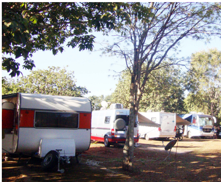
■ O Camping de Caldas Novas oferece a pausa de tranquilidade entre os passeios termais

mês é o Paraty Eco Festival 2016, que acontecerá entre os dias 12 a 23. Este é um evento que veste a cidade de moda sustentável, com costura de conteúdo, beleza, cultura e inclusão social. O evento de moda retorna este ano com diversas atividades misturando beleza, consciência ecológica, criatividade e consideração às culturas tradicionais.