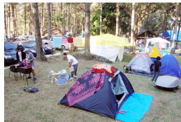
■ Camping da Serrinha

SERRINHA (RJ-06) – Entrada pelo km 311 da Via Dutra. Município de Resende. Tel.: (24) 3381-7042. Instalações– padrão, iluminação elétrica apenas para as dependências, chuveiros quentes, quadra de esportes, play-ground, sauna rústica, pavilhão de lazer, piscinas naturais, ducha de rio, quiosques e lago. Ponto de energia para carga bateria de trailers. NÃO TEMPORADA: R$ 10,10 mais equipamento de R$ 2,50 até R$ 18,20; TEMPORADA (16/Dez. a 28/Fev.): R$ 15,50 mais equipamento de R$ 3,90 até R$ 24,20.