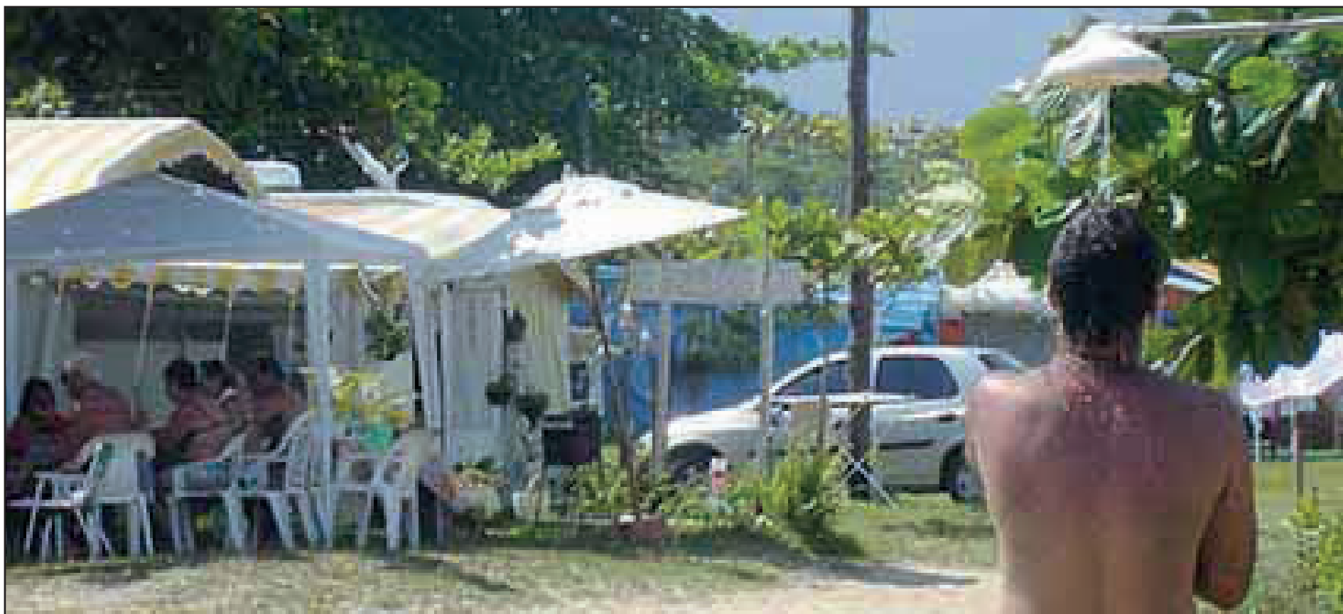
► O Camping de Bertioga, defronte à Praia da Enseada e a 6 km do centro da cidade, proporciona lazer com tranquilidade aos campistas

RIO DE JANEIRO - JANEIRO DE 2018 - Nº 539 - ANO XLV