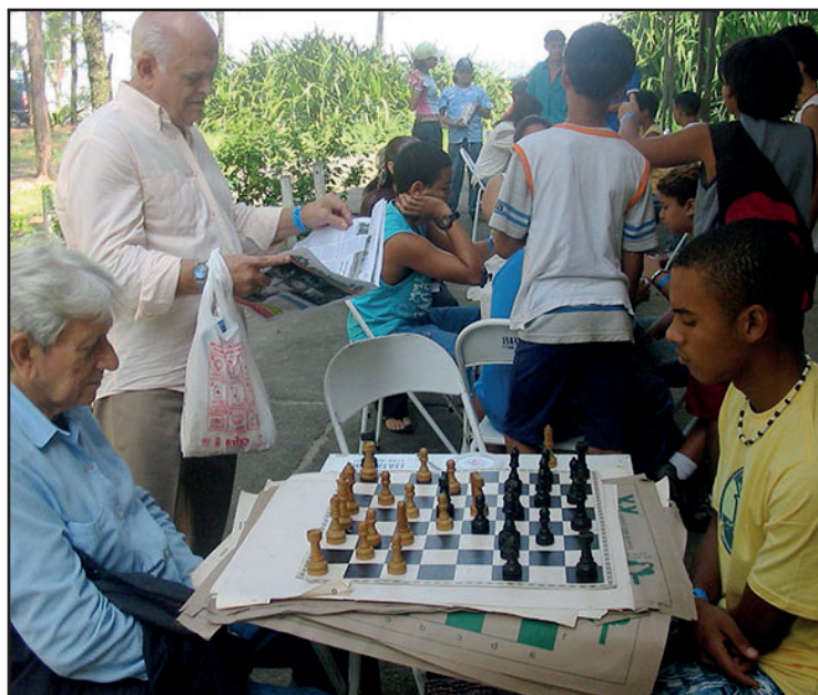
► A partir de março, enxadristas infantis e adultos se confraternizam em um domingo por mês

putados em três categorias, até 20 anos, adultos e veteranos, e os escolares em quatro, juvenil, infantil, mirim e pré-mirim. As premiações finais conferidas com troféus e medalhas para os competidores e troféus para os estabelecimentos