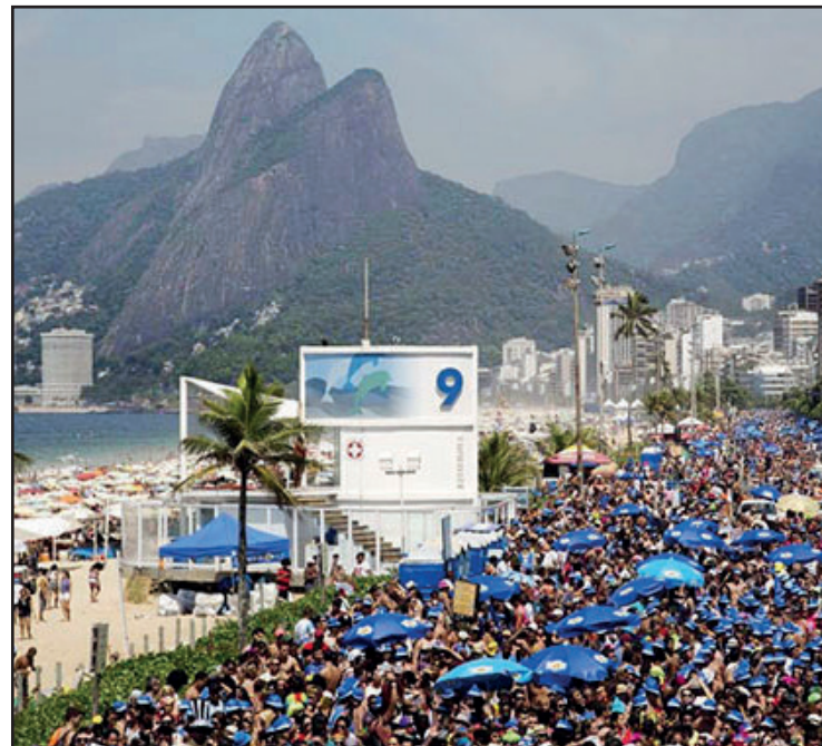
► Seja na Sapucaí, no centro da cidade ou nos bairros, escolas de samba e blocos de rua oferecem diversão a valer