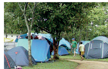
▶ Camping do Clube dos 500

CAMPOS DO JORDÃO (SP-02) – Estrada do Horto Florestal, bairro Rancho Alegre. Instalações – padrão, luz para equipamentos (220v), chuveiros quentes, pavilhão de lazer, lareira e play-ground. NÃO TEMPORADA: R$ 13,40 mais equipamento de R$ 3,60 até R$ 26,20; TEMPORADA (Mai. Jun. e Jul.): R$ 21,00 mais equipamento de R$ 5,20 até R$ 42,80.