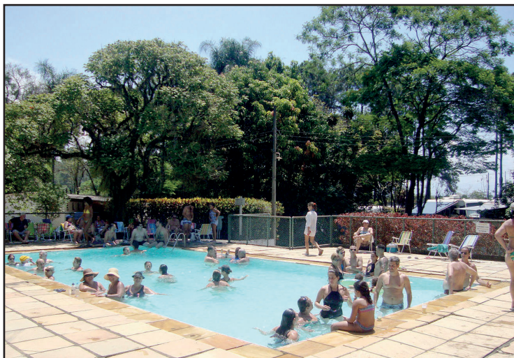
► Além da variedade de lazer no camping, a cidade oferece programas turísticos para todos os gostos e idades

Guaratinguetá também é muito conhecida pelo lado religioso, já que é o local de nascimento de Frei Antônio de Sant’Ana Galvão, o primeiro santo do Brasil. Por isso, alguns dos lugares mais visitados