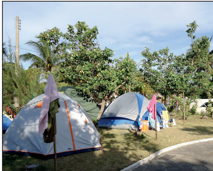
► As mais lindas praias da região estão próximas do Camping de Arraial do Cabo

A caminho de lá dê uma passada pela colônia finlandesa de Penedo onde funciona a Vila do Papai Noel e