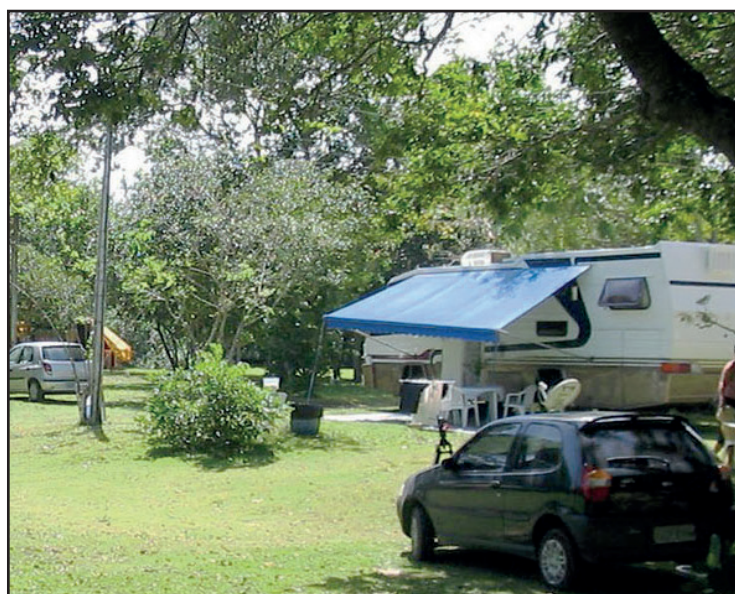
► A área de Aracruz concilia a tranquilidade do bosque para acampar com a praia fronteira de Putiry

a Fábrica de Chocolates. O local tem simpáticas lojinhas de artesanato e ótimos restaurantes.