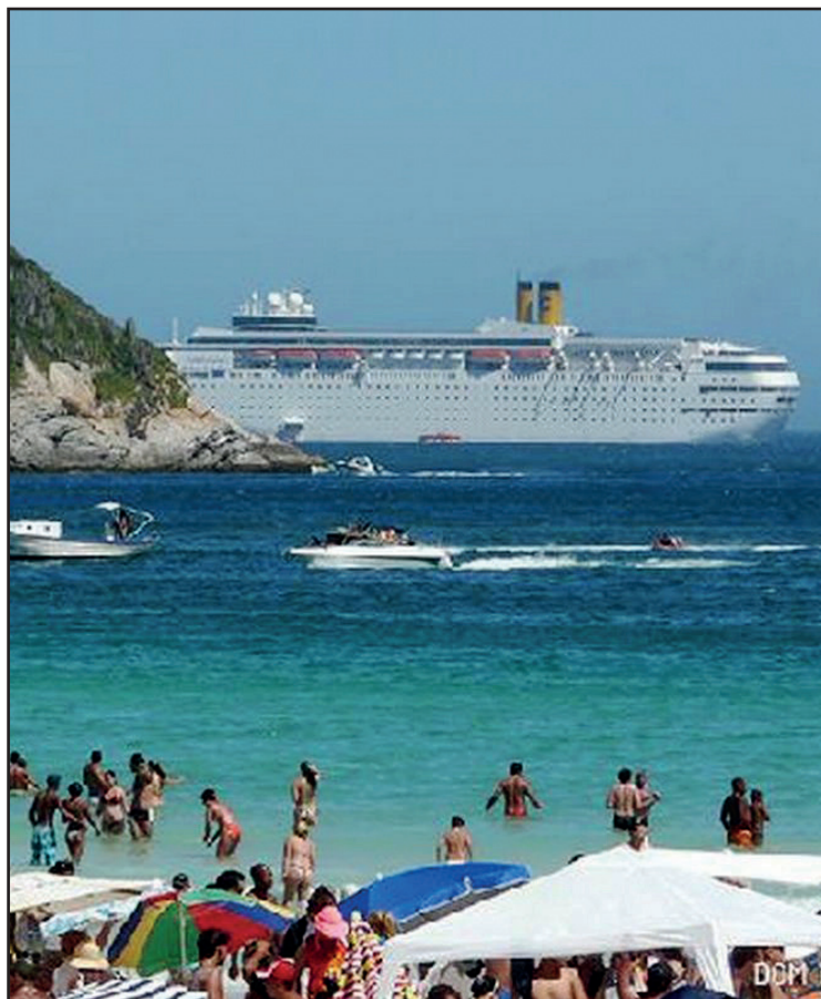
► A praia do Forte, no centro de Cabo Frio, fica bem próxima do nosso camping na cidade

A Região dos Lagos é um grande polo turístico que atrai visitantes dentro e fora do Brasil. Com uma população fixa de 400 mil habitantes, a população da região se multiplica na alta temporada.