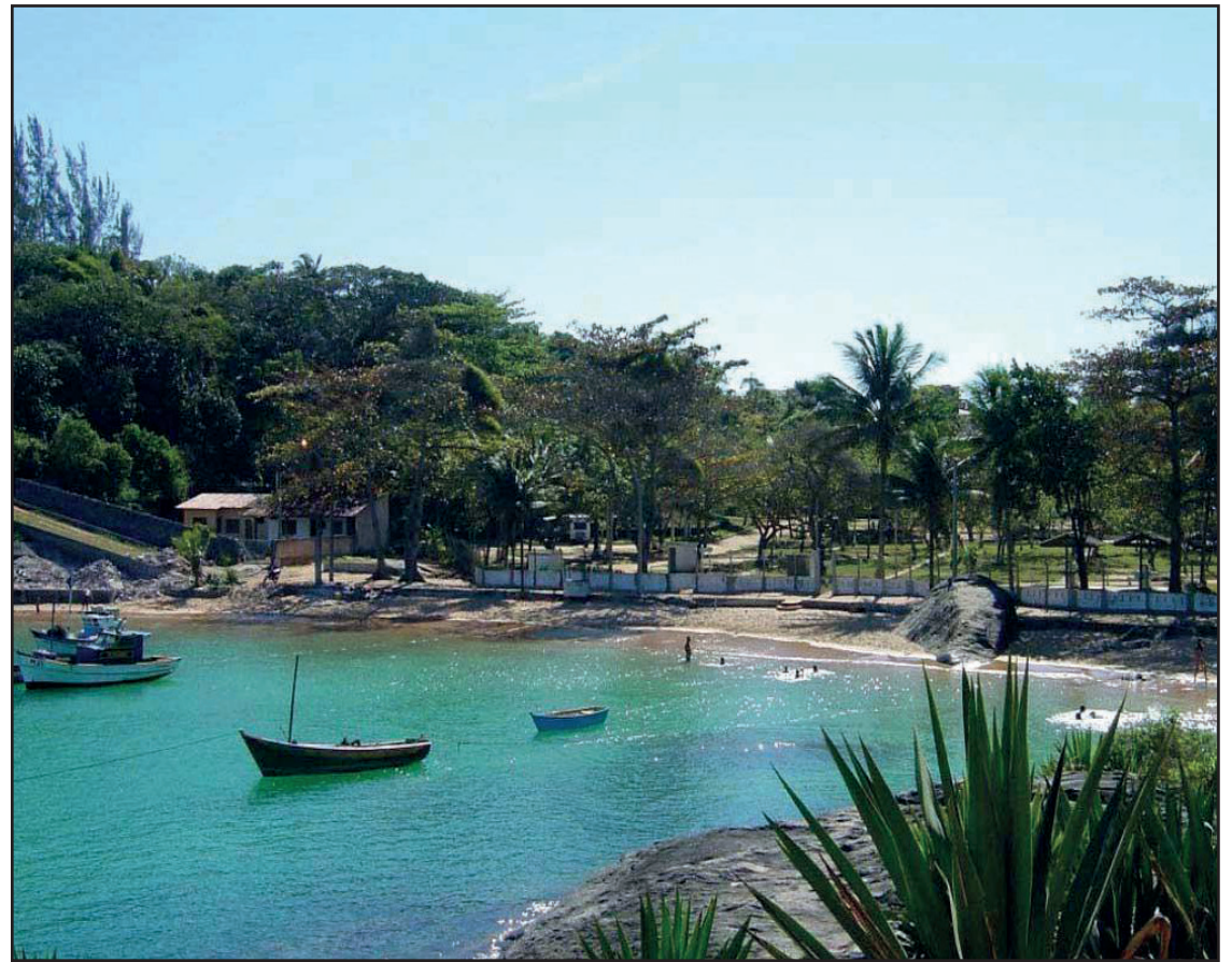
► No agito do Carnaval, o Camping de Guarapari oferece a tranquilidade da enseada fronteira

Abrindo o Carnaval, o camping de Ubatuba vai realizar na noite de sábado, dia 10, o concurso de fantasias e de blocos com entrega de faixas e troféus aos vencedores, entre o primeiro, segundo e terceiro lugar. Com direito a decoração típica, o evento será organizado pelos próprios associados no pavilhão de festas. No domingo, dia 11, o camping está programado para uma folia musical a partir das 20 horas animando todos os campistas e convidados presentes. Caso haja alguma dúvida relacionada ao evento, você pode obter maiores informações através do telefone: (12)3843-1536.