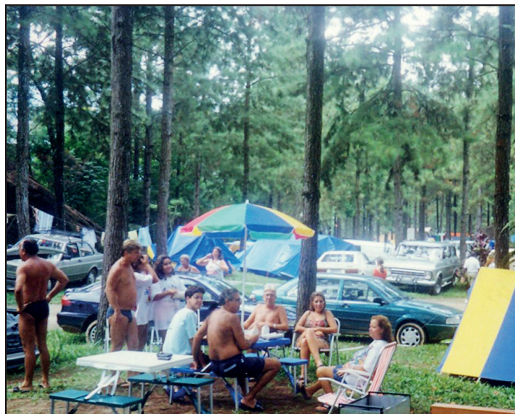
► O Camping da Serrinha é uma das áreas mais propícias aos campistas que preferem descansar no Carnaval