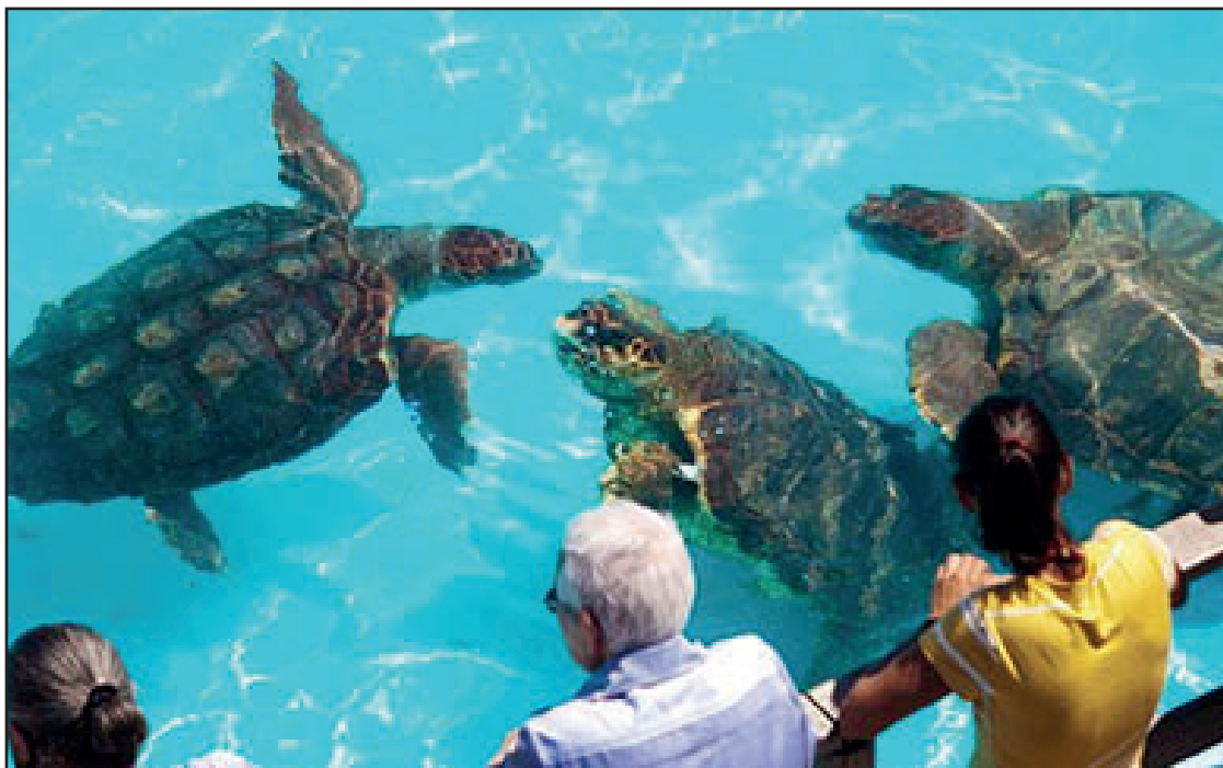
► Uma das maiores atrações da cidade, além das praias, é claro, o Aquário de Ubatuba é um programa imperdível

Atrativos – Para a prática do surfe, a Praia Itamambuca é a mais procurada, pois faz parte do circuito internacional. Para chegar até lá