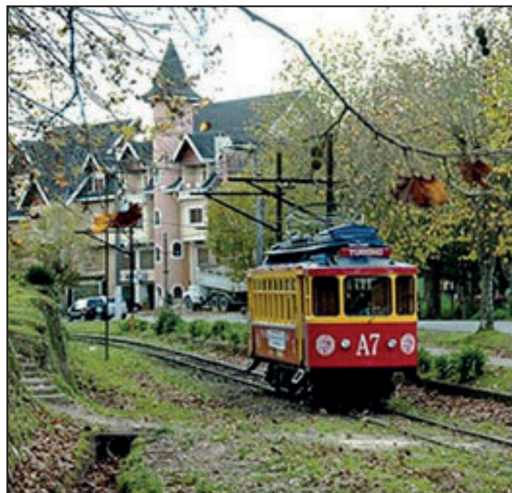
► Nada mais romântico e atraente do que uma pausa para este passeio da cidade

Como opção de hospedagem, temos o camping de Campos do Jordão, que está localizado no bairro Rancho Alegre, bem ao lado do Horto Florestal, a 7 km do centro da cidade. A paisagem do camping é deslumbrante, com araucárias ao redor. Além das instalações-padrão, o camping conta ainda com cantina reformada e com um cardápio de qualidade, chuveiros quentes e quadra de vôlei.