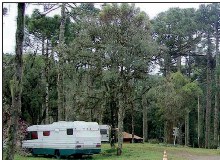
► O bosque do Camping de Canela é um refúgio perfeito para quem prefere um verão ameno

Mury é uma opção refrescante para fugir do calor Pág.06