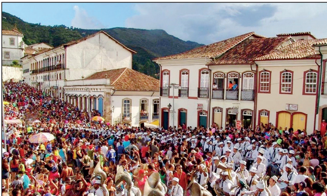
► O centro histórico dá passagem a um dos melhores carnavais de rua do país

Quando falamos de folias de Carnaval, falamos de Ouro Preto, que reserva o melhor carnaval do Estado, reunindo turistas de diver-