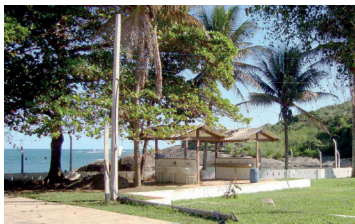
▶ Camping de Guarapari

ARACRUZ (ES-04) – Estrada da Barra do Sahy. Praia do Putirí. Tel. Público (27) 3250-7050. Instalações-padrão, luz para equipamentos (220v), quadra de esportes, play-ground, praia fronteira. NÃO TEMPORADA: R$ 13,40 e mais equipamento de R$ 3,20 até R$ 24,50; TEMPORADA (16/Dez. a 28/Fev.): R$ 18,20 mais equipamento, de R$ 4,60 até R$ 36,80.