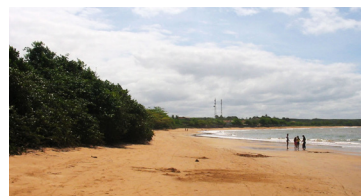
► Camping de Aracruz

ARACRUZ (ES-04) – Estrada da Barra do Sahy. Praia do Putirí. Tel. Público (27) 3250-7050. Instalações-padrão, luz para equipamentos (220v), quadra de esportes, play-ground, praia fronteiria. NÃO TEMPORADA: R$ 13,90 e mais equipamento de R$ 3,30 até R$ 25,40; TEMPORADA (16/Dez. a 28/Fev.): R$ 18,80 mais equipamento, de R$ 4,80 até R$ 38,20.