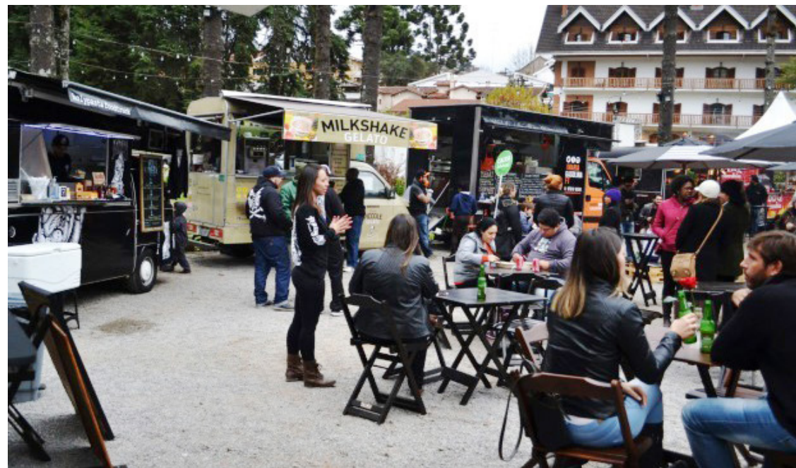
► No centro da cidade, os foodtrucks oferecem variedade e descontração

nam molhos leves com ervas aromáticas, frutas frescas, flores e shitake, entre outros saborosos ingredientes para degustar.