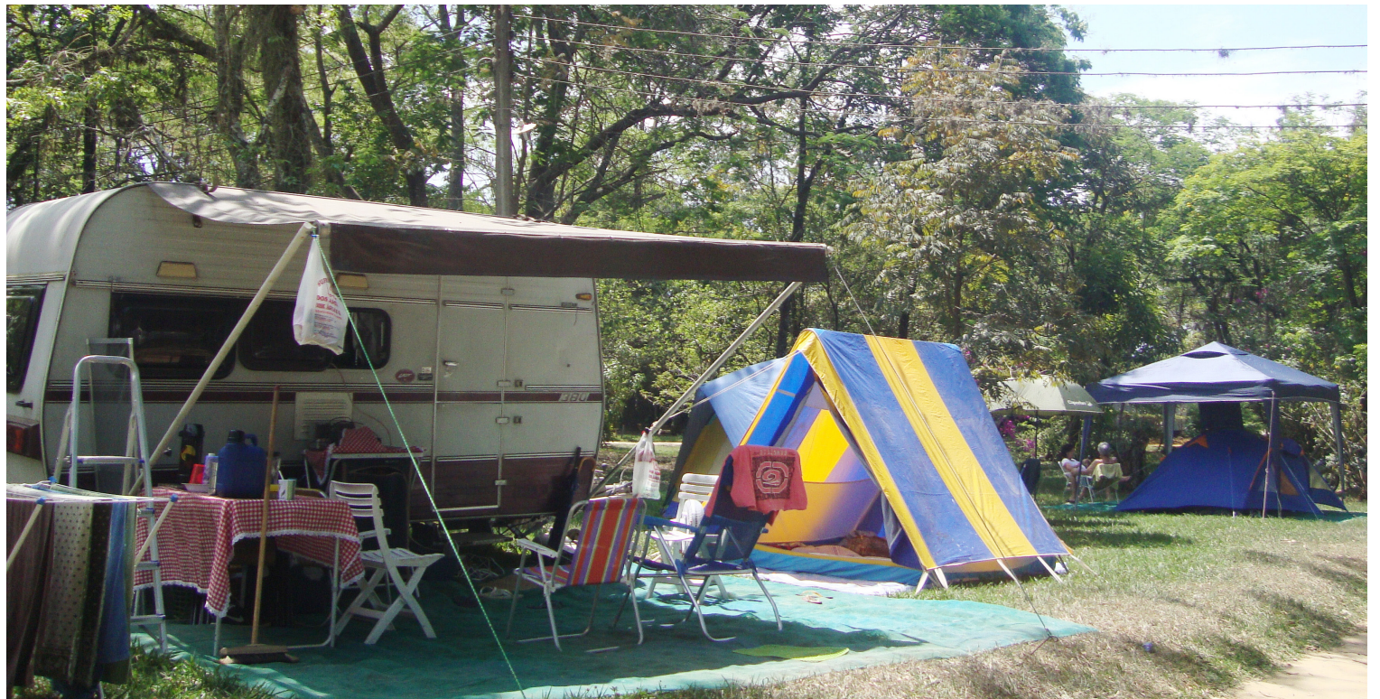
► O Camping do Clube dos 500 está pronto para o feriadão de Nossa Senhora Aparecida, com a Chopada Alegre no sábado (página 03)

Reveja o calendário de eventos nos campings (Pág.12)