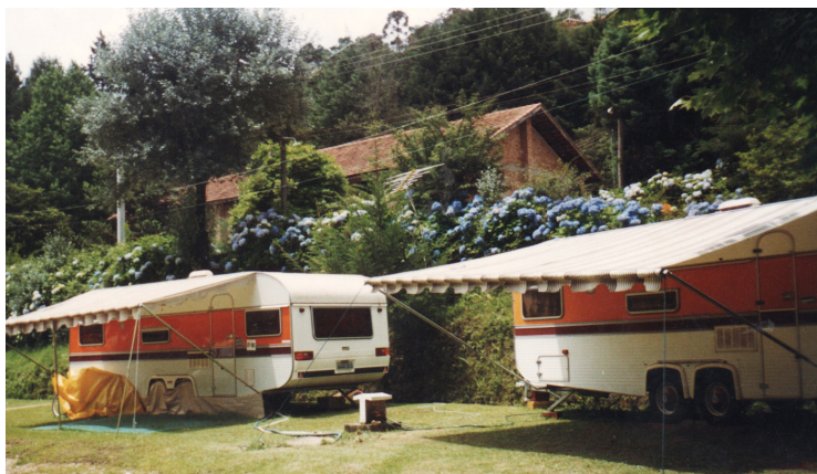
► O camping é uma alternativa acessível para um turismo sofisticado