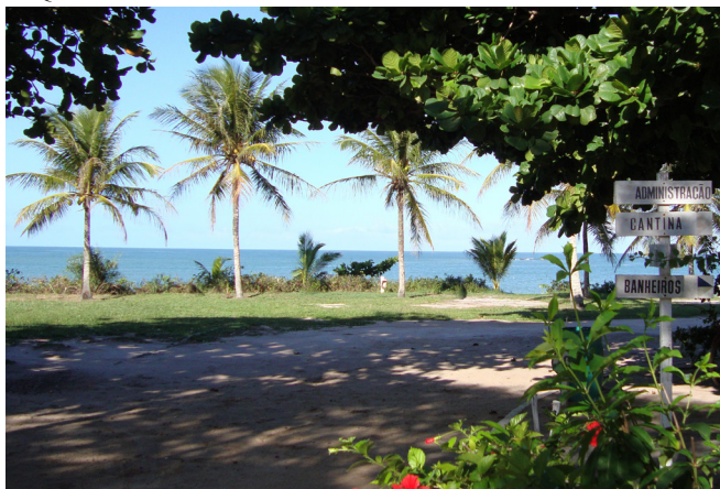
► O camping de Prado é uma rara oportunidade de se acampar no litoral do Nordeste