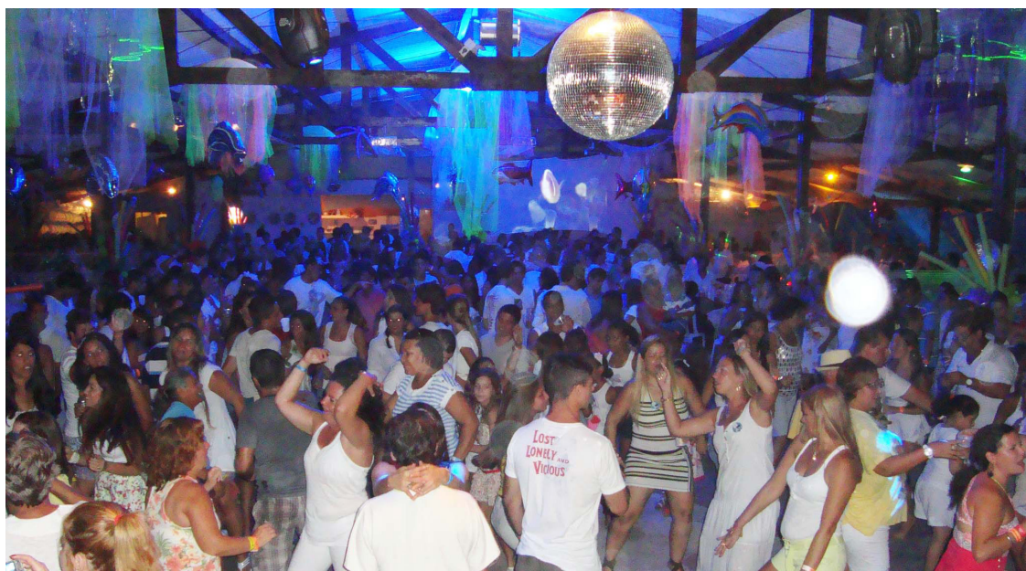
► As noites de Réveillon em várias campings encerram o calendário de eventos do Clube

Em todos os campings da rede, campistas e convidados celebram a chegada do Natal e Ano Novo com festividades dentro e fora dos campings. Shows e festejos com direito a assistir a queima de fogos nas praias fronteiras.