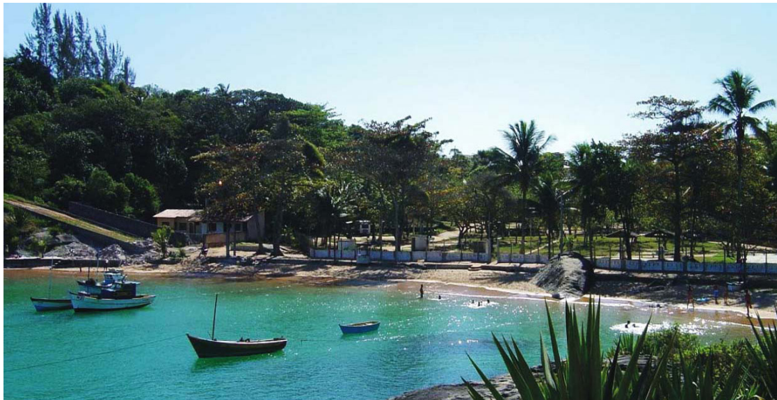
► Além de viabilizar o turismo da cidade, o camping dispõe de uma enseada fronteiriça para se curtir

Tentadora para o rico artesanato em concha e outras ofertas que certamente serão utilizadas como lembrança ou no embelezamento do lar. O lado histórico do Município reserva pontos tradicionais.