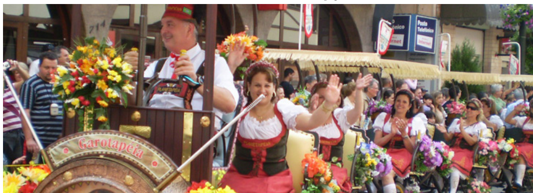
► Antecipe-se às promoções para visitar a Oktoberfest neste ano