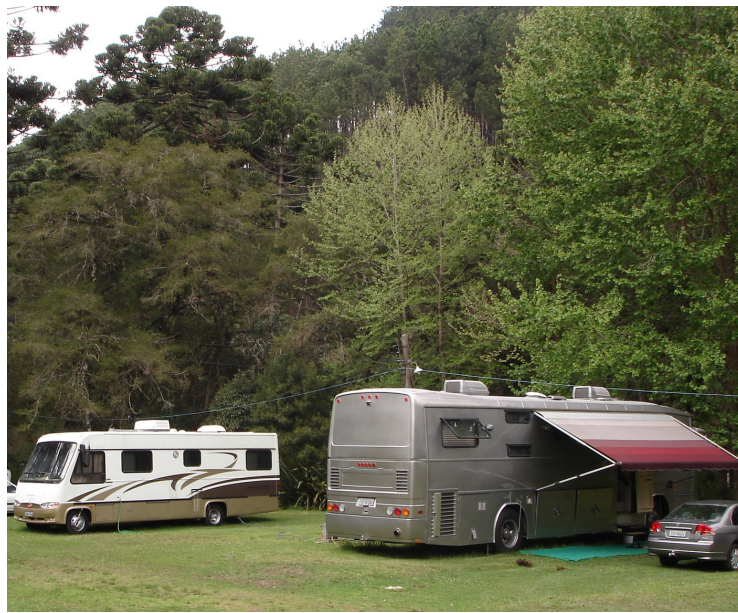
► Acampar em Campos do Jordão é alternativa acessível para um turismo sofisticado (Pág.06)

Visite o site do CCB www.campingclube.com.br