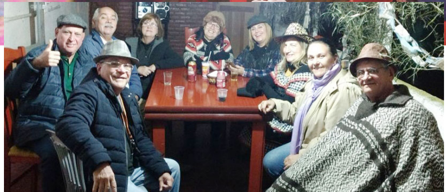
► Tanto em Mury, como no Recreio, foi total a animação de crianças e adultos