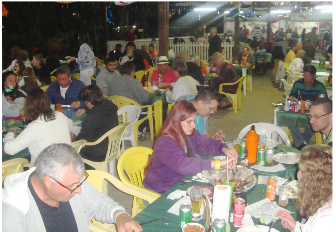
► Ao som do DJ Davi, os campistas se confraternizam no pavilhão do camping

Disque Camping: (21) 2532-0203 ou (21) 3549-4978