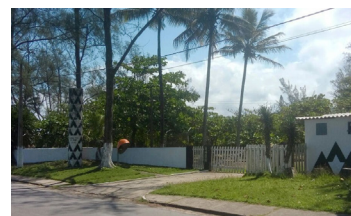
► Camping de Itanhaém

CLUBE DOS 500 (SP-01) – km 60/SP da Via Dutra, Guaratinguetá (SP). Tel.: (12) 3122-4175. Instalações-padrão, luz para equipamentos (220v), chuveiros quentes, pavilhão de lazer, quadras de esportes, piscinas cloradas e play-ground. NÃO TEMPORADA: R$ 13,90 mais equipamento de R$ 3,75 até R$ 27,00; TEMPORADA (16/Dez. a 28/Fev.): R$ 14,70 mais equipamento de R$ 3,80 até R$ 29,90.