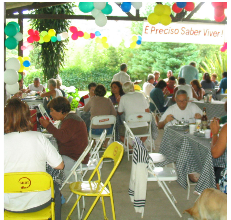
► O Cozido deste ano vai encerrar os eventos do mês

Acesso - O RJ-08 fica a 150 km do Rio de Janeiro, através do acesso feito pela BR-101, seguindo em direção a Rio Bonito. Logo depois de contornar o perímetro urbano de Itaboraí, é preciso se-