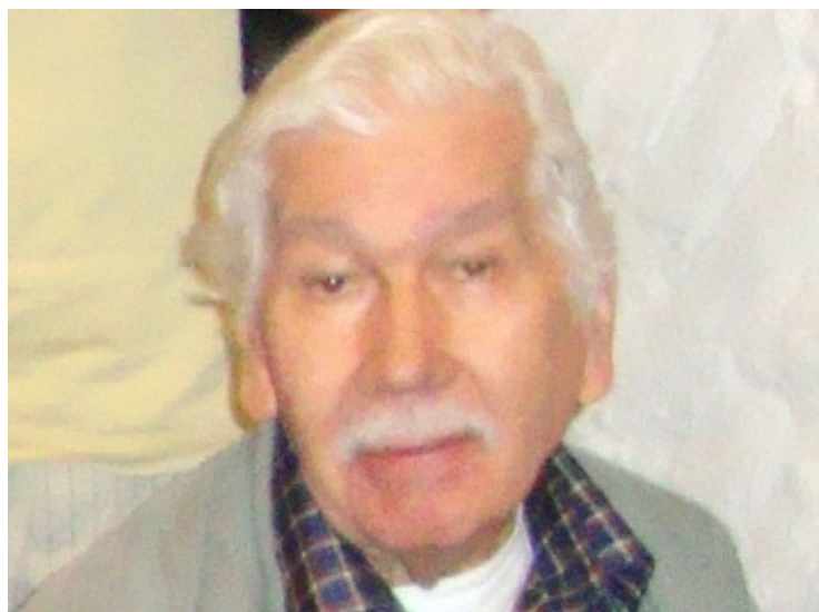
► Palheta é um capítulo na história do CCB

Ao se aposentar, mudou-se com a família para Niterói, no Rio de Janeiro, partilhando suas ações positivas com os companheiros fluminenses e cariocas, logo passando para o grupo de