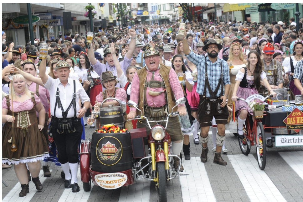
► Muita alegria e descontração são o forte do festival

Local: Blumenau (SC) Data: 03 a 21/outubro/2018 Informações: http://oktoberfestblumenau.com.br/ CCTUR: (21) 2240-5390 Disque Camping: (21) 2532-0203 ou (21) 3549-4978