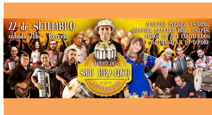
► O Forró do "Seu" Branco oferece animação e variedades no ritmo

Perde o CCB um grande amigo, uma conduta irreparável.