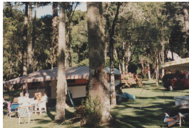
► Um bosque preservado de araucárias emoldura o camping de Canela

ça de alimentação. No Recreio há também as famosas praias. Points de surfistas e de gente bonita, o camping está em um local privilegiado, próximo aos redutos da juventude carioca, como a famosa Prainha, a Praia de Grumari e Praia da Macumba, fronteira ao camping.