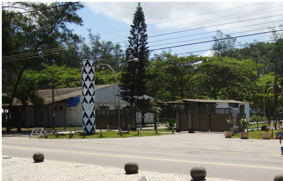
► Defronte à praia e no entorno de um turismo variadíssimo, o camping do Recreio dos Bandeirantes