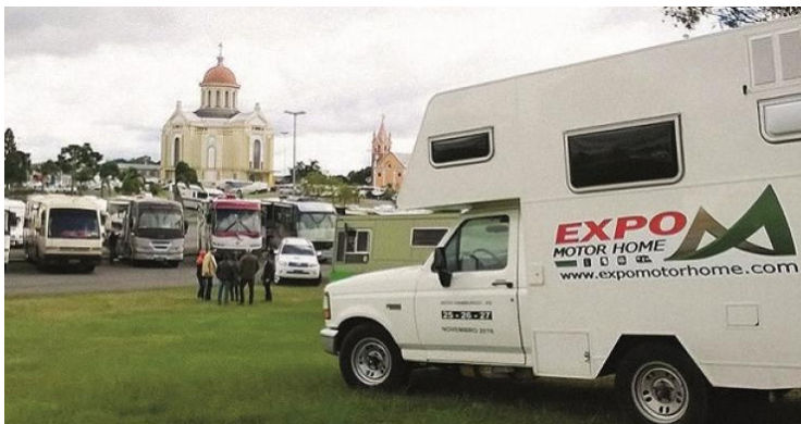
► Com certeza, a exposição deste ano vai superar os números do ano passado

Disque Camping: (21) 2532-0203 ou (21) 3549-4978