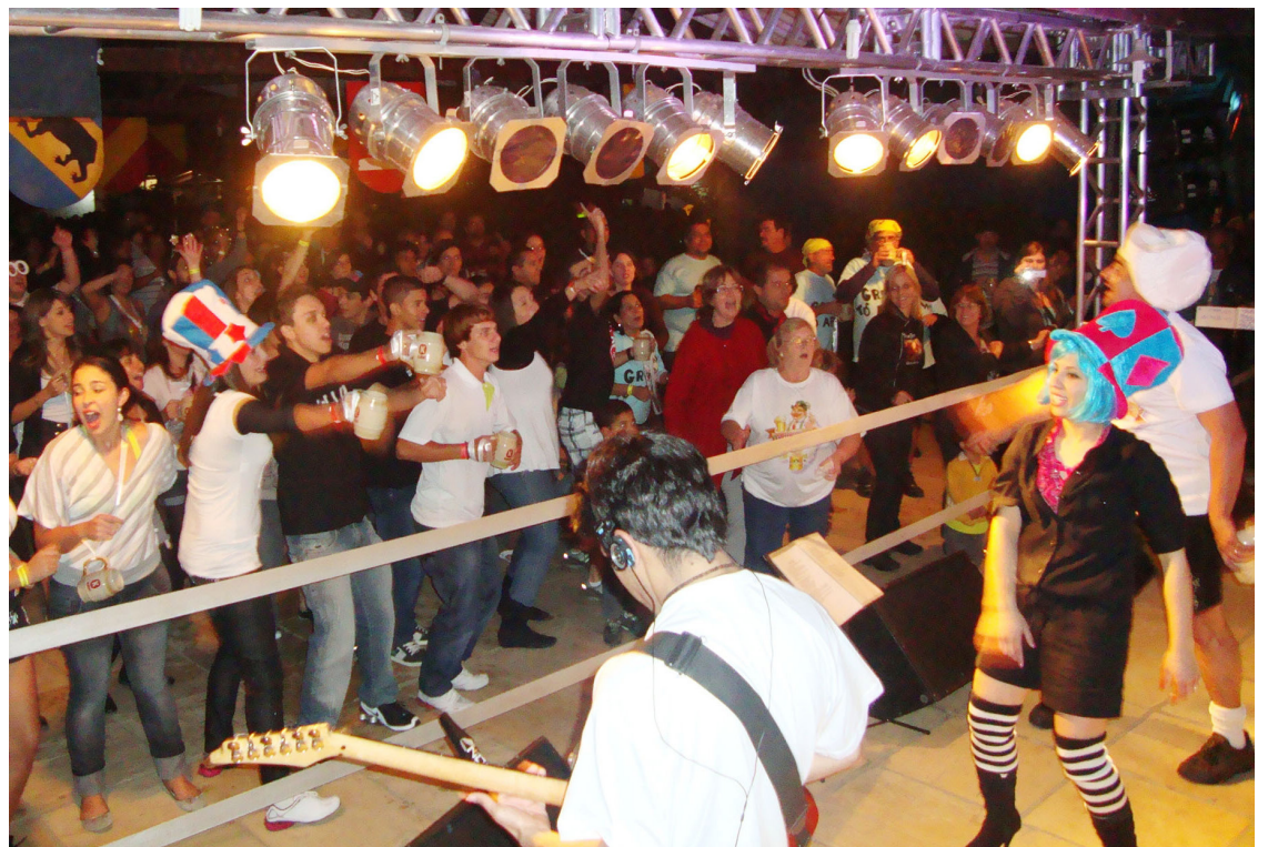
► A Banda Túreck estará animando mais uma vez a confraternização dos campistas

Disque Camping: (21) 2532-0203 ou (21) 3549-4978