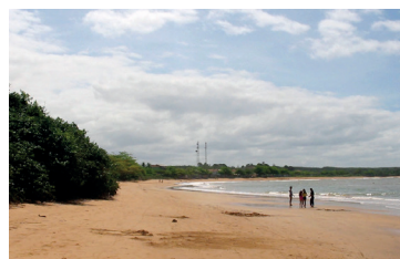
► Camping de Aracruz

ARACRUZ (ES-04) – Estrada da Barra do Sahy, Praia do Putirí. Tel. Público (27) 3250-7050. Instalações-padrão, luz para equipamentos (220v), quadra de esportes, play-ground, praia fronteiria. NÃO TEMPORADA: R$ 13,90 e mais equipamento de R$ 3,30 até R$ 25,40; TEMPORADA (16/Dez. a 28/Fev.): R$ 18,80 mais equipamento, de R$ 4,80 até R$ 38,20.