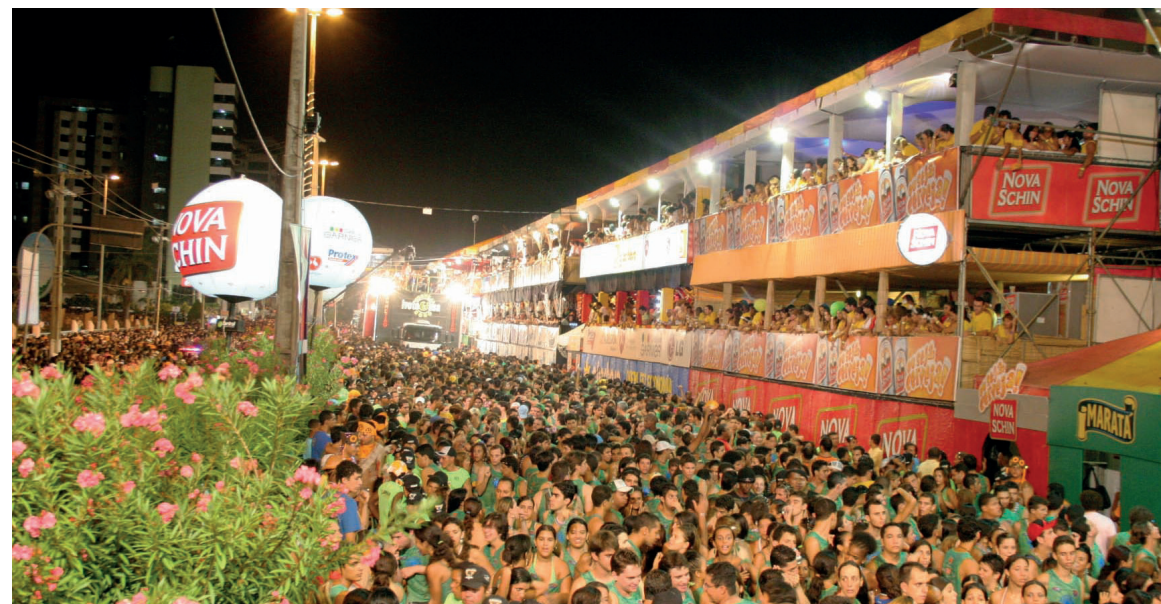
► Um dos pioneiros do Carnaval fora de época, o Pré Caju melhora a cada ano

Acesso – O SP-01 fica a aproximadamente 185 km da capital paulista e 261 km do Rio de Janeiro. Para chegar ao camping é necessário seguir pela Ro-