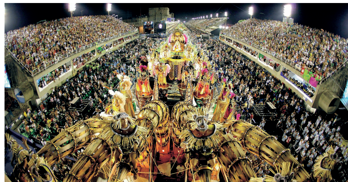
► No Rio de Janeiro, as Escolas de Samba são a atração máxima do Carnaval

dovia Presidente Dutra até o km60, em Guaratinguetá, onde está a unidade. Ao norte do camping estão localizadas as cidades de Campos do Jordão, Piquete e Delfim Moreira. Ao sul, bem próximo, ficam Lagoinha, Cunha e Aparecida.