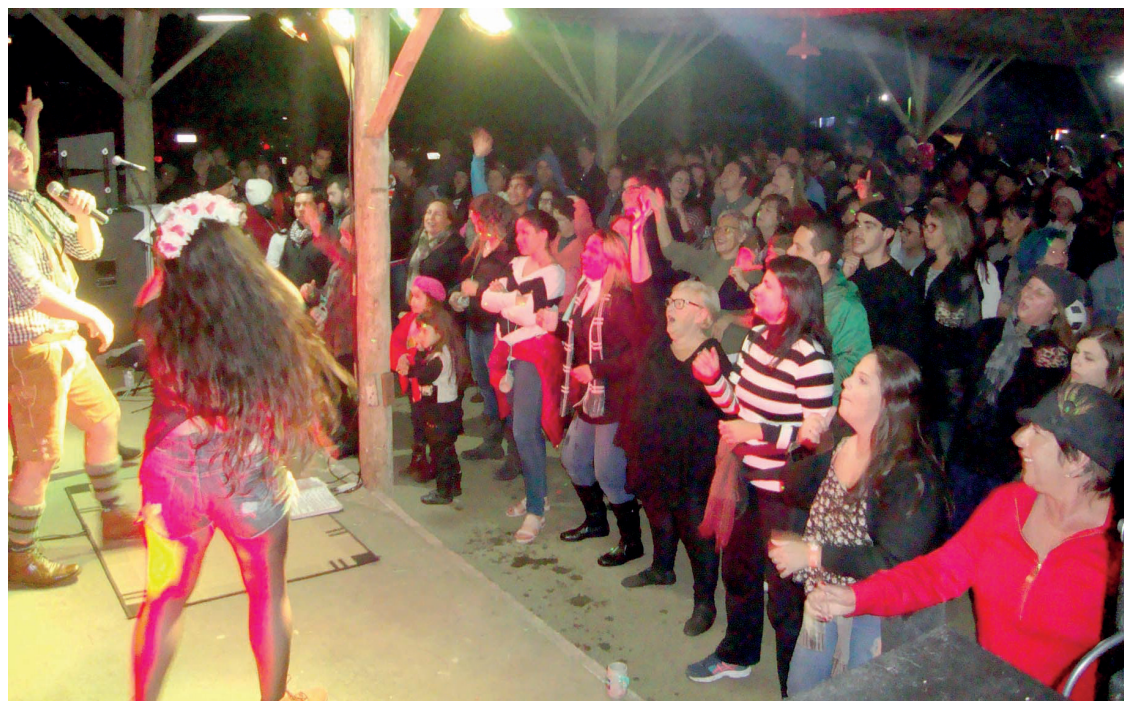
► A mais tradicional festa do Clube, a Noite de Queijos e Vinhos, será no feriadão de 22 de junho

Os feriados mais democráticos para o lazer, aqueles que acontecem em uma sexta-feira, são os de 25 de janeiro (São Paulo), 19 de abril (Nacional – Sexta Santa), 20 de setembro (Rio Grande do Sul – Farroupilha) e 15 de novembro (Nacional – Pro-