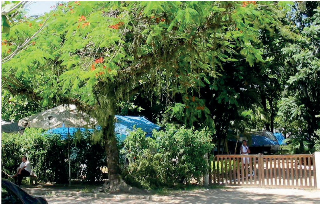
► O Camping de Paraty hospeda campistas o ano inteiro para as atrações que se sucedem