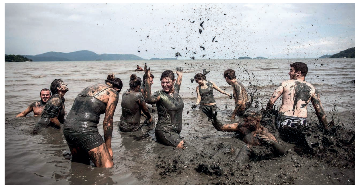
► Entre os mais tradicionais de Paraty, o bloco da lama atrai foliões de todos os cantos