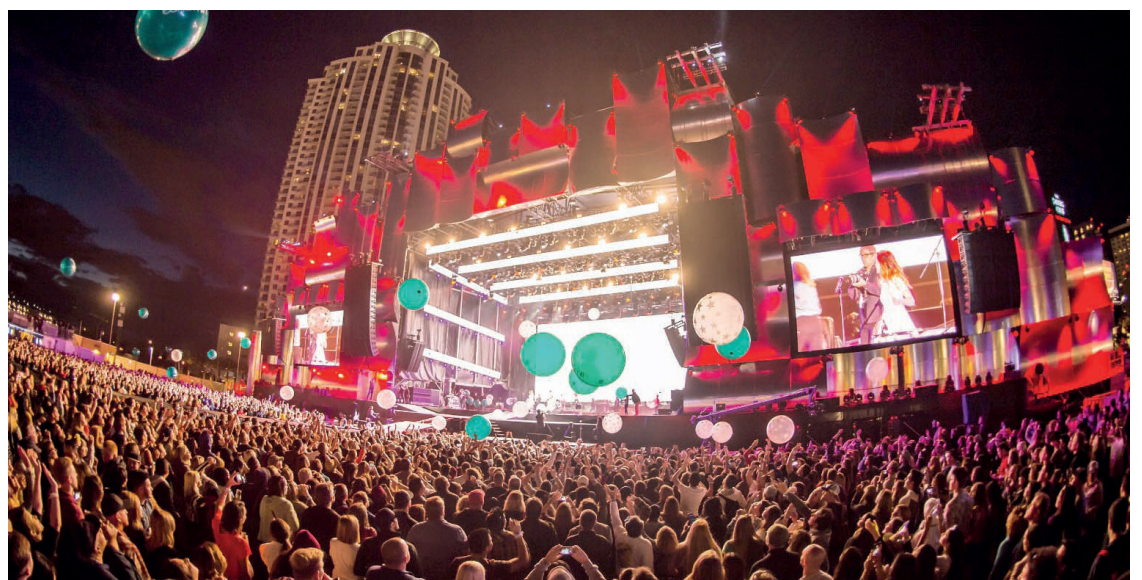
► A grade das atrações já apresenta os primeiros nomes para o evento