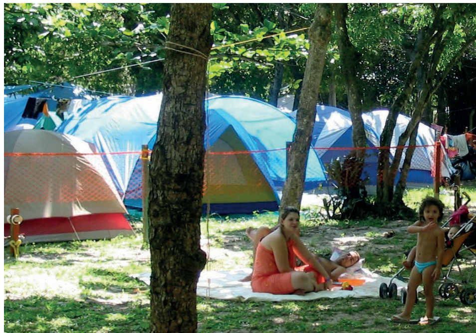
► Defronte à praia do Pontal, o Camping do Recreio se aninha no Recôncavo do Renagel