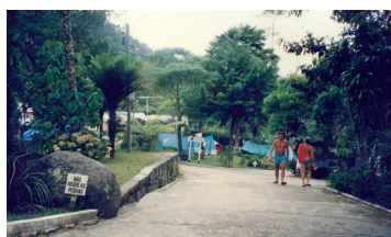
► Camping de Mury

MURY (RJ-08) – Parque Mury/Debossan. Entrada no km 69 da Estrada Rio-Friburgo, à esquerda da “lombada eletrônica”. Tel.: (22) 2542-2275. Instalações-padrão, luz para equipamentos (220v), chuveiros quentes, quadra de esportes, pavilhão de lazer, sauna, piscinas naturais, ducha de rio e play-ground. NÃO TEMPORADA: R$ 19,40 mais equipamento de R$ 5,00 até R$ 38,20; TEMPORADA (16/Dez. a 28/Fev.): R$ 23,70 mais equipamento de R$ 6,00 até R$ 41,50.