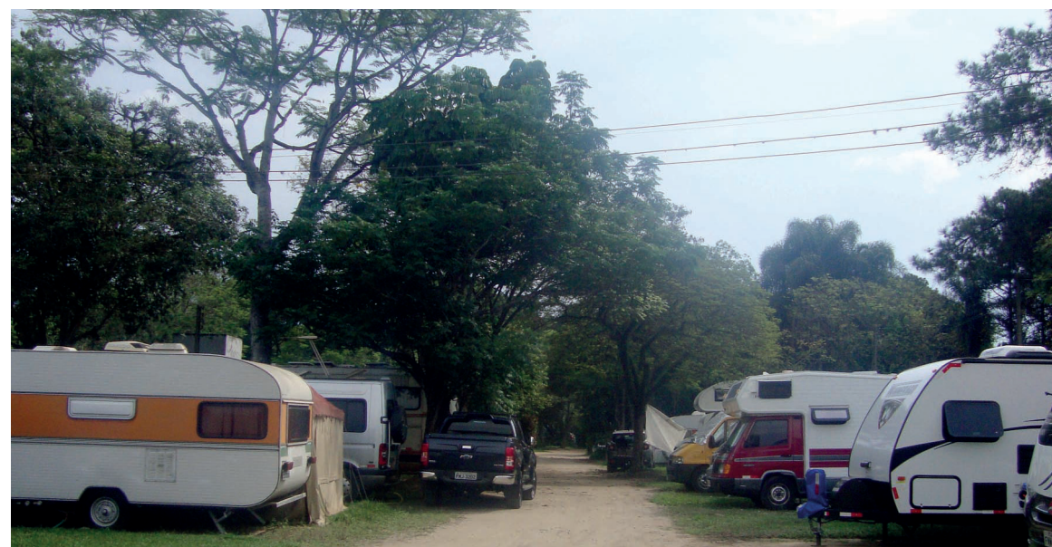
► Para quem prefere descansar no Camping do Clube do 500, os blocos de rua na cidade não chegam a incomodar