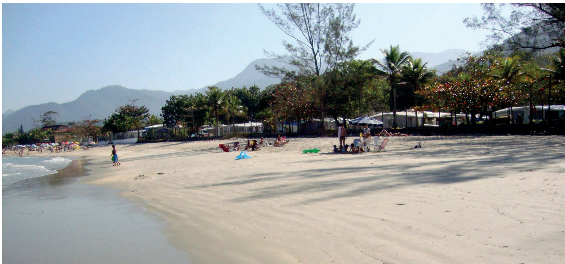
► O Camping de Ubatuba atende a todos no Carnaval, desde a mansidão da praia aos blocos internos dos campistas

RIO DE JANEIRO - JANEIRO DE 2019 - Nº 551 - ANO XLVI