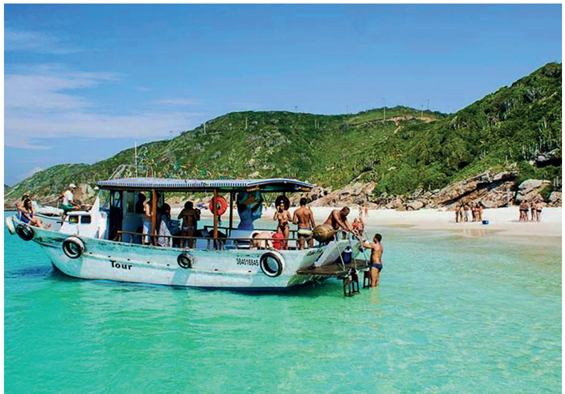
► Os passeios marítimos estão entre os mais procurados na cidade