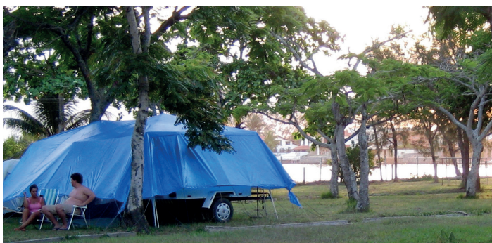
► O Camping de Cabo Frio, na beira do Canal, facilita as saídas de barco