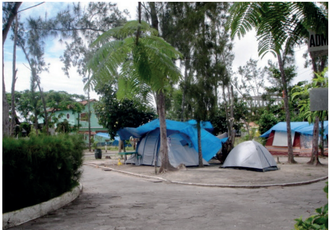
► Na pequena Arraial do Cabo, nosso camping está no centro das atrações

Disque Camping: (21) 2532-0203 ou (21) 3549-4978