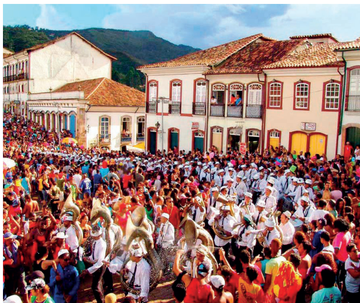
► Os blocos de rua em Ouro Preto estão entre os melhores do país (Pág. 6)

Recreio dos Bandeirantes: programe-se já para o Rock In Rio Pág.05