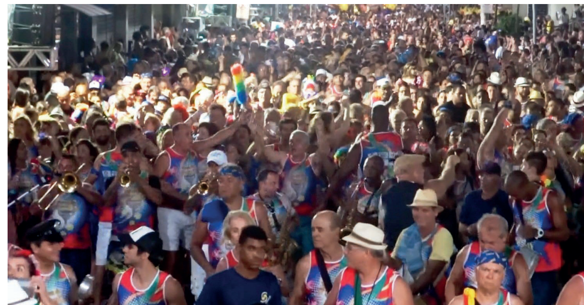
► Em Guarapari, além do camping, os blocos de rua funcionam dia e noite