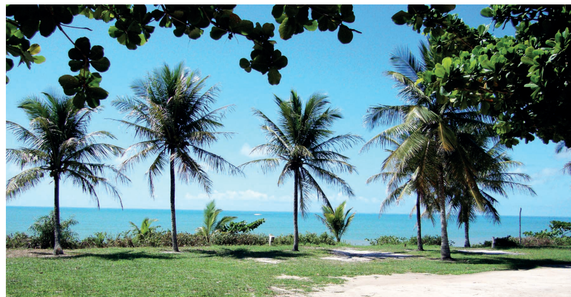
► O Camping de Prado é um oásis no carnaval agitado na cidade