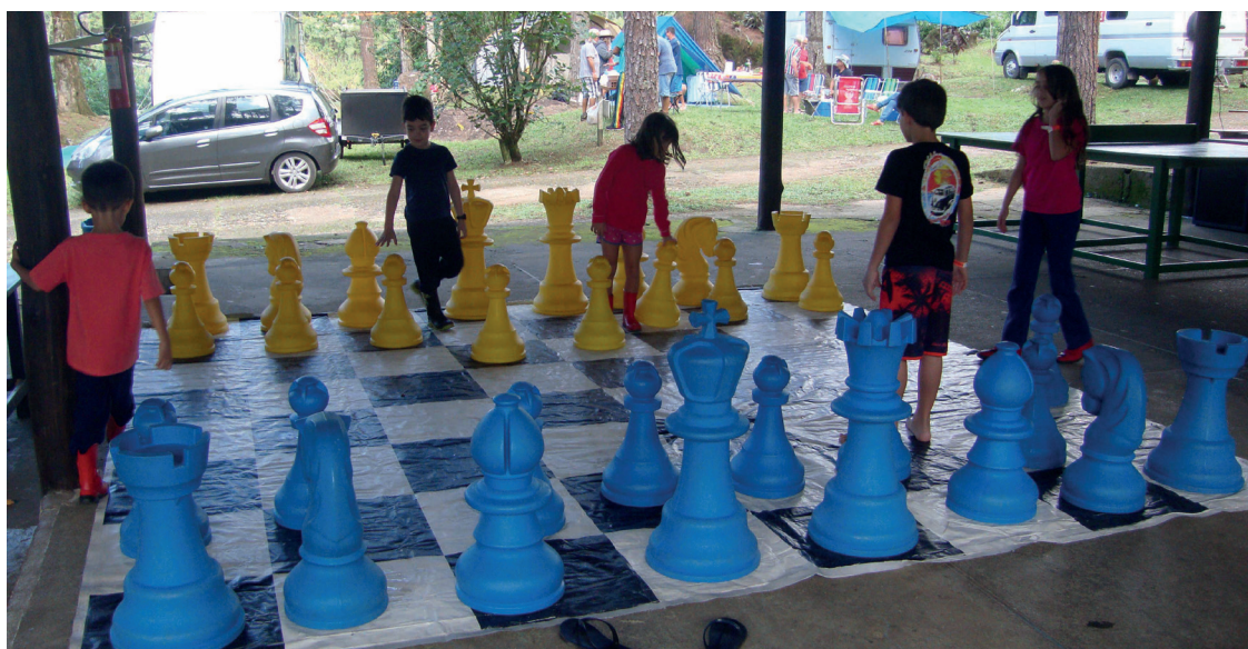
► Na Clínica da Serrinha, o tabuleiro gigante de xadrez atraiu especialmente as crianças

A outra função aconteceu no Camping do Recreio dos Bandeirantes, no último dia 30 de junho, com a realização do CLXXXIV Torneio Aberto e do XLII Torneio Escolar Individual, para as categorias Mirim, Infantil e Juvenil, que terão seus resultados publicados na próxima edição deste período.