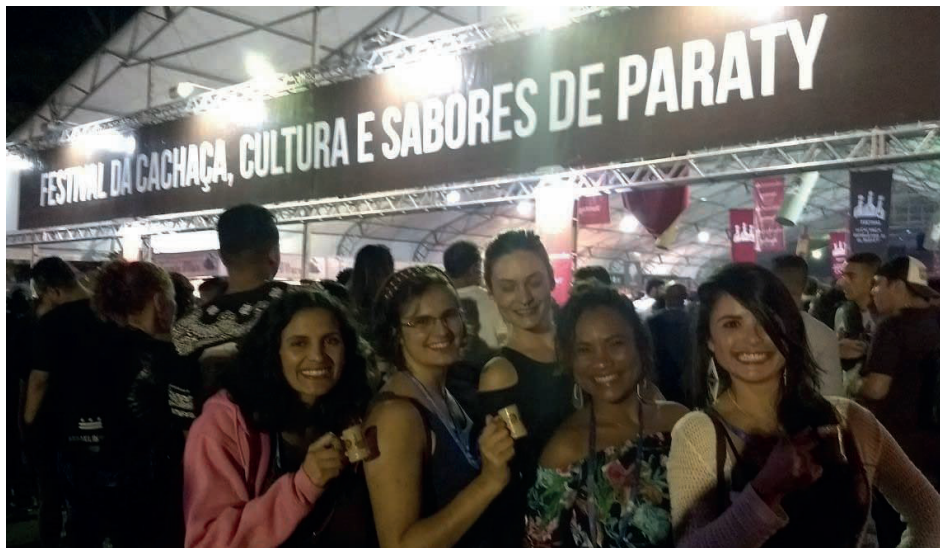
► O calendário de eventos da cidade se sucede em atrações para todos os gostos

Festival da Cachaça: www.festivaldapingadeparaty.com.br