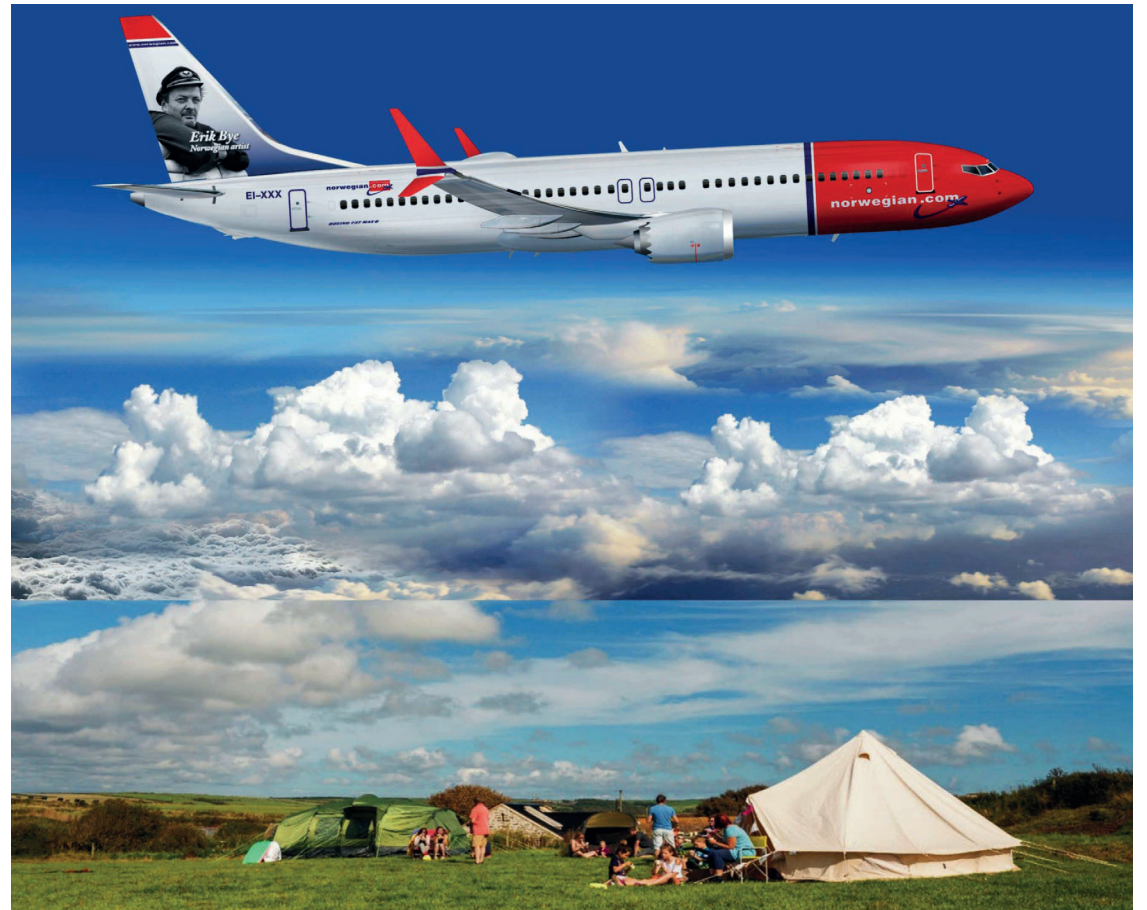
► Primeiro você marca seu assento em moderno avião, depois é só clicar “campings na Inglaterra” e montar o seu roteiro

Os interessados em viajar à capital britânica podem informar-se na própria companhia: 11-5056-9837@99196-1129 ou consultar a CCTUR através do número : (21) 2240-5390. As tarifas estão sujeitas a alterações sem aviso prévio.