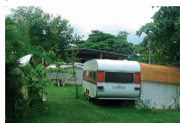
► Camping de Bertioiga

BERTIOGA (SP-05) – Av. Anchieta, 10.500 – Jardim Rafael. Tel.: (13) 3311-9329. Em implantação. Praia fronteiria. NÃO TEMPORADA: R$ 14,70 mais equipamento de R$ 4,00 até R$ 28,60; TEMPO-