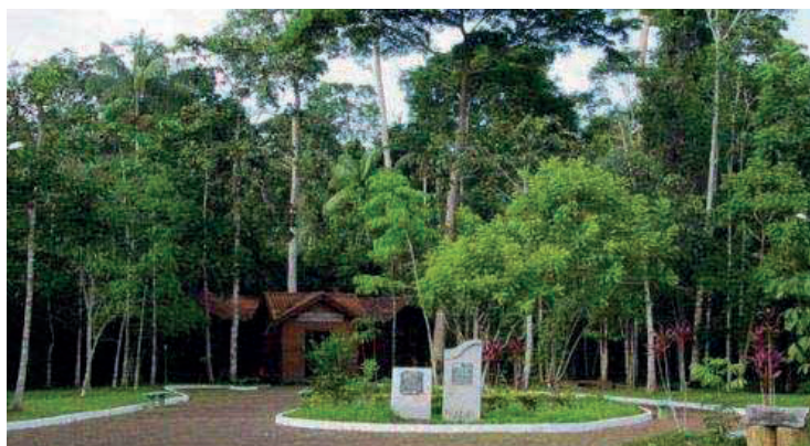
► O Parque Chico Mendes é um oásis ecológico no turbilhão urbano da Barra/Recreio

O parque possui inúmeras trilhas naturais, que não exigem esforço físico para percorrer, pois se encontram às margens de uma lagoa em área de baixada. Devido a tais características, possibilita uma caminhada segura para pessoas de diferentes idades. Na caminhada passa-se por margens de lagoas, onde o solo é bastante arenoso e expõe muitos mariscos e conchinhas