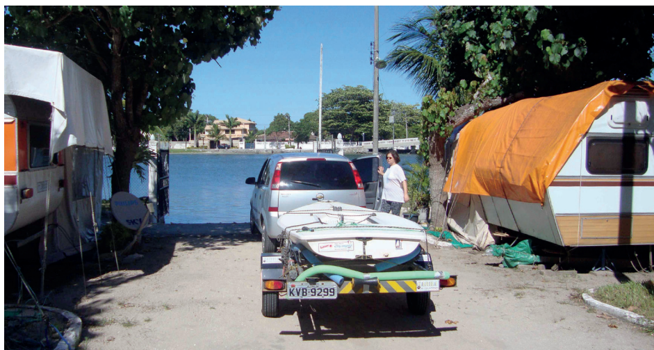
► Em Cabo Frio, a ligação direta com o canal leva você ao mar ou à lagoa

apresentam no palco montado no lago de Lumiar.