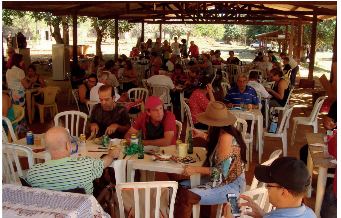
► Durante o almoço na Costelada, o momento maior é a confraternização entre os campistas