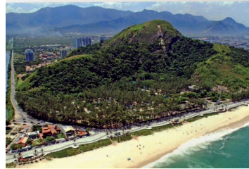
► Camping do Recreio dos Bandeirantes

PARATY (RJ-04) – Praia do Pontal. Tel.: (24) 3371-1050. Instalações – padrão, iluminação elétrica somente para as dependências, chuveiros quentes, praia fronteiria. Camping de área reduzida. NÃO TEMPORADA: R$ 14,70 mais equipamento de R$ 3,50 até R$ 26,80; TEMPORADA (16/Dez. a 28/Fev.): R$ 19,90 mais equipamento de R$ 5,00 até R$ 40,40.