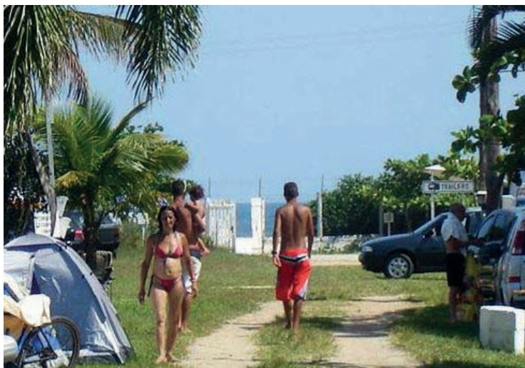
► Além do prazer de acampar em ambiente saudável....

Instalada no rio Itatinga, com equipamentos alemães e americanos, deu ao porto de Santos o status de único do mundo a possuir sua