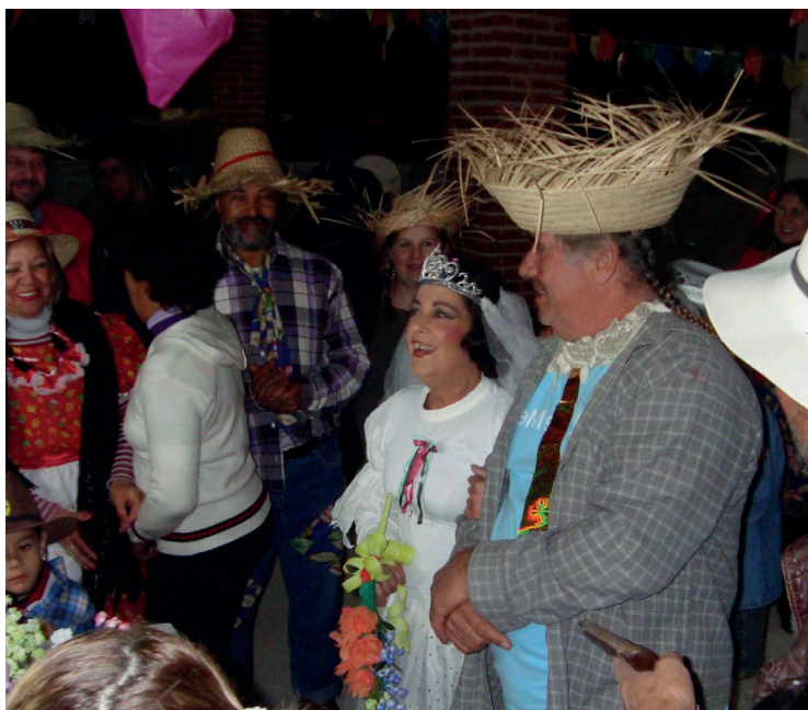
► O casamento na roça não pode faltar na confraternização