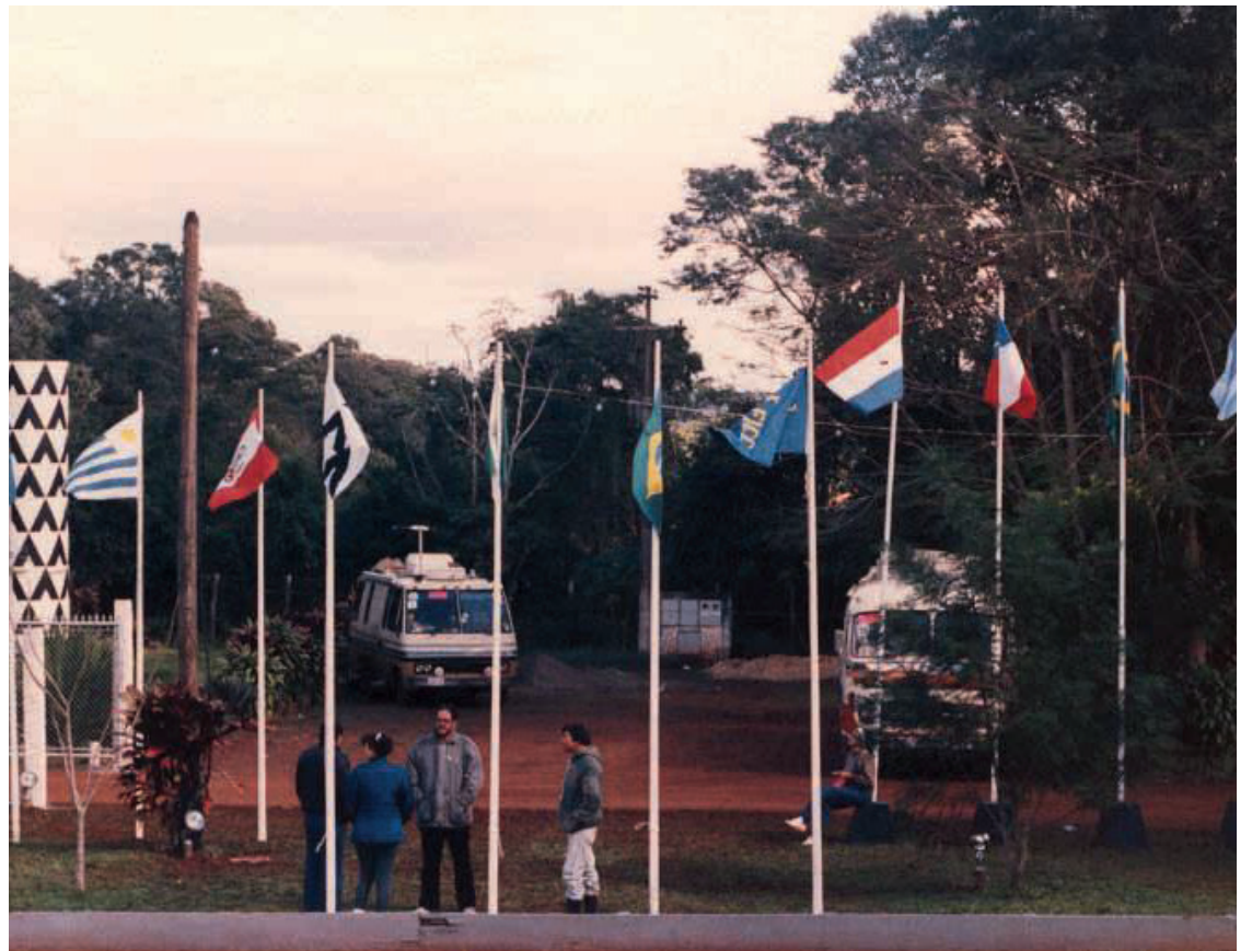
► A criação da FESACC, em 1990, em Foz do Iguaçu, intensificou o campismo em nível continental

Atualmente, o CCB possui unidades funcionando em doze estados, promovendo uma ligação de Norte a Sul do país. Hoje em dia, o Camping Clube do Brasil é o principal e a maior entidade associativa de campismo no país. Seu nome representa sinônimo de lazer relacionado ao meio ambiente, oferecendo qualidade de vida e possibilitando em seus campings o contato direto com a natureza e a interação entre as pessoas.