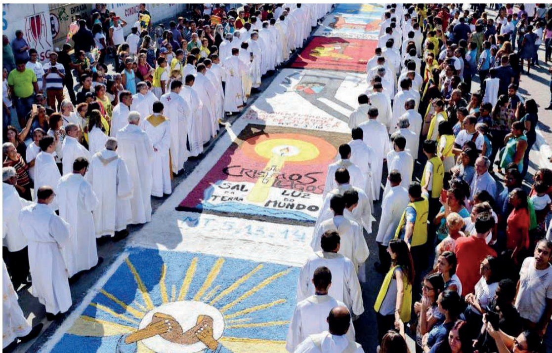
► Os tapetes de sal em São Gonçalo (RJ), um dos mais extensos na América do Sul, atraem muitos turistas nos eventos de Corpus Christi nós.

Este segmento é um conceito mundial, que agrega pessoas de todas as idades e potencializa este mercado como todo. Um grande exemplo dessa atividade em nosso país é a Festa do Divino em Paraty, realizada todo ano, geralmente em maio, onde a cidade celebra 09 dias inteiros de missas, ladainhas, leilões, rifas, bingos, bebidas, comidas, danças típicas, e shows musicais. É notável observar-se que o Divino vem mantendo, ao longo dos séculos, o mesmo espírito comunitário, religioso e folclórico, entre