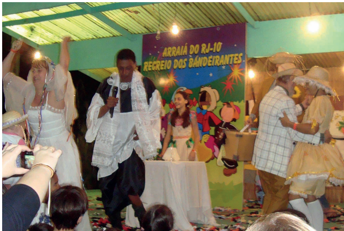
► Campistas de todos os cantos revivem as tradições caipiras

O visitante, ao chegar, vê as muradas e portões do parque, com entrada para o estacionamento e outra para pedestres. Próximo ao estacionamento está o centro de visitantes, onde fica um playground com brinquedos para crianças e mesas com