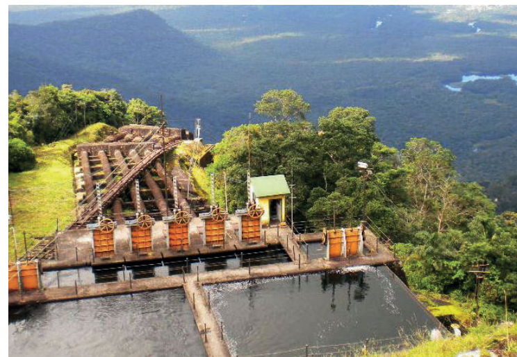
► ... a visita à Usina de Itatinga é um programa muito interessante

Acesso – Os campistas que vêm de São Paulo devem seguir pela rodovia Presidente Dutra, entrar em