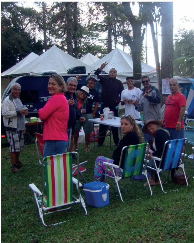
► Os dias ensolarados do feriadão proporcionam mais encontros e reencontros

Foi, de fato, uma festa e tanto. No feriadão de Corpus Christi, no mês de junho passado, em noite de lua cheia para minguinte, quase quinhentos associados e convidados, entre idosos, jovens e infantes se divertiram a valer na XLVII Noites de Queijos e Vinhos no Camping da Serrinha, ao som da Banda Túreck, imperdível, como sempre.