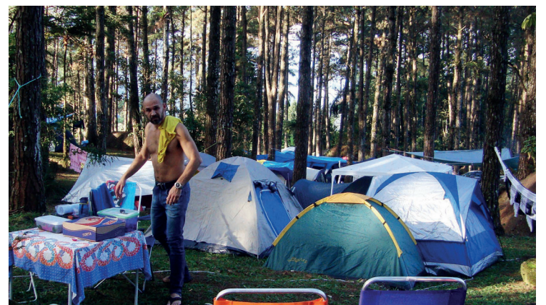
► Assim como os trailers e motor-homes, as barracas também estão voltando, modernas e confortáveis