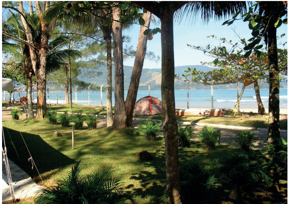
► No Camping de Ubatuba, ou em outros próximos, o feriadão de 9 de julho é propício para acampar mais e rever os amigos