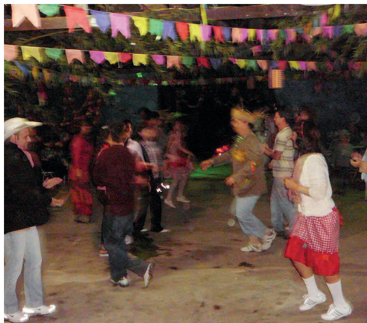
► Os campistas se divertem a valer ao som da quadrilha

No dia 13, sábado, abrindo a temporada de arraiais do CCB, Ubatuba irá realizar sua festa, a partir das 20 horas, no pavilhão da cantina onde serão disponibilizadas comidas típicas, músicas e brincadeiras. Neste dia, o pavilhão estará todo decorado tipicamente para o evento.