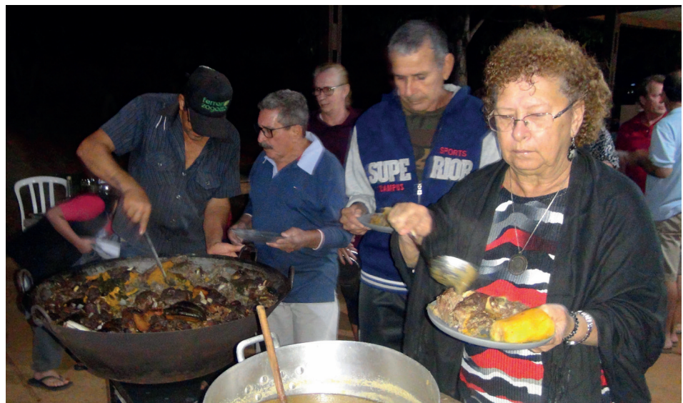
► Depois de seis horas vedado num buraco, o carneiro está pronto para servir