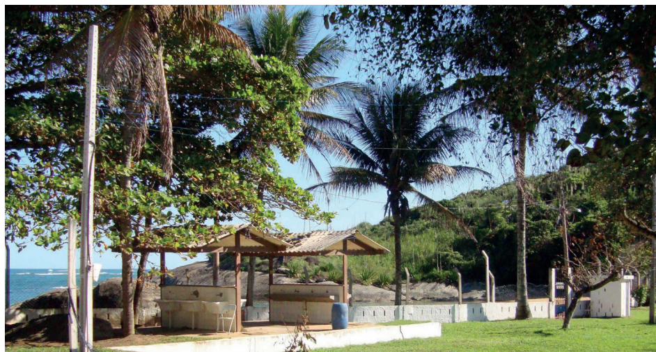
► O camping “pé na areia” de Guarapari está entre os mais visitados da rede