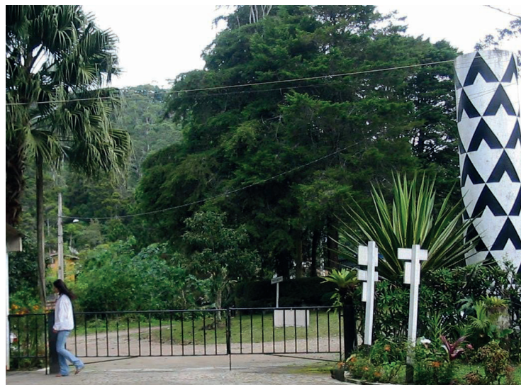
► Na região de Mury, este mês, os prazeres da cultura e da gastronomia (Pág.7)

Noites dos Queijos e Vinhos foi sucesso na Serrinha Pág.05