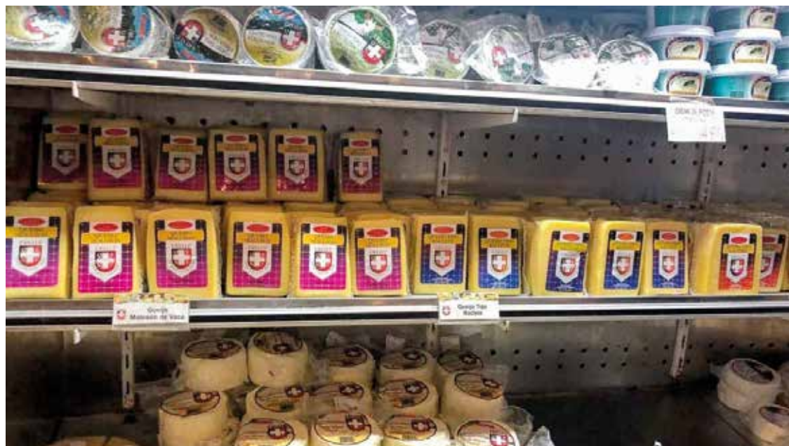
► A qualidade da produção dos queijos enaltece a indústria nacional