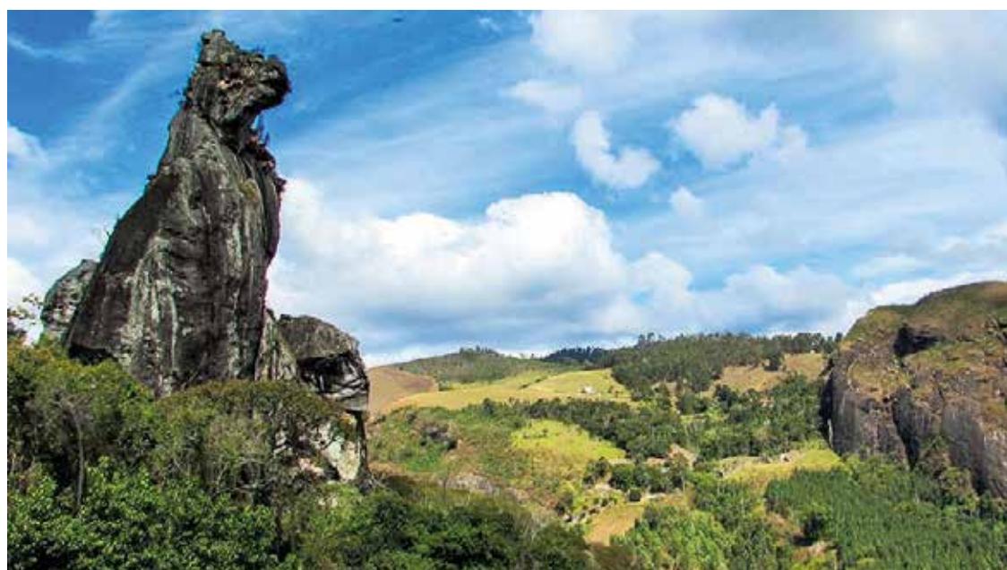
► Não bastasse o passeio em si, é deslumbrante o traço da formação rochosa

Disque Camping: (21) 2532-0203 ou (21) 3549-4978