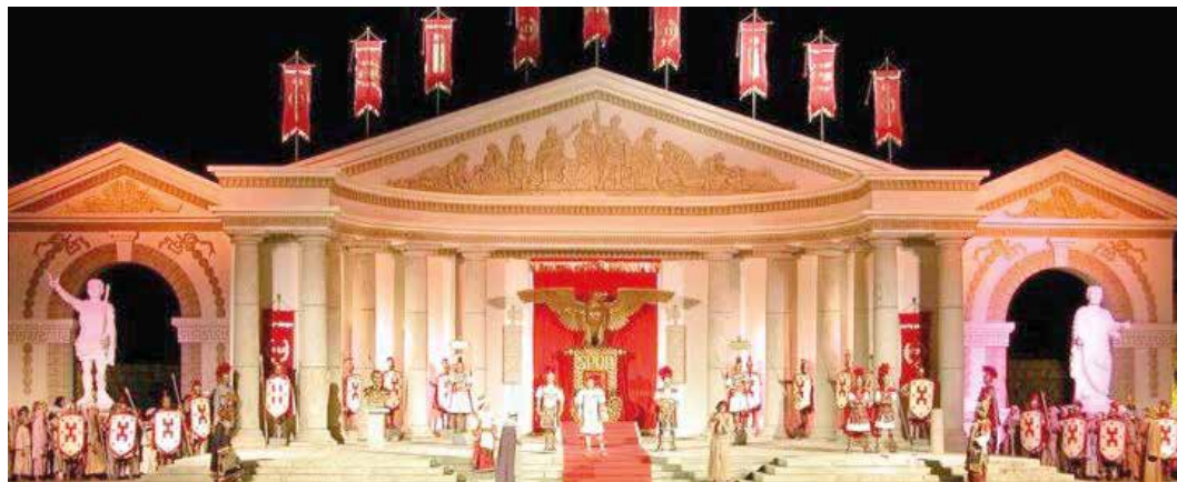
► Há mais de 50 anos, a encenação da Paixão de Cristo atrai turistas à região

(Transcrito do jornal O Globo, de 14/04/2020)