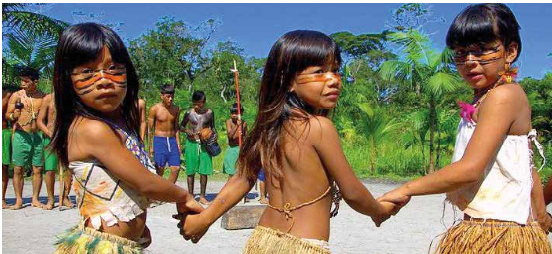
► Os índios Guaranís em Bertioga preservam sua arte e costumes sociais

As visitas à reserva são feitas necessariamente com um monitor turístico ou ambiental credenciado pela Fundação Nacional do Índio (Funai), em passeios que, geralmen-