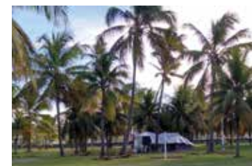
► Camping de Aracaju

Nova (perímetro urbano). Tel.: (79) 3243-3957. Instalações-padrão, luz para equipamentos (220v), chuveiros quentes, quadra de esportes, praia fronteira. NÃO TEMPORADA: R$ 12,90 mais equipamento de R$ 3,40 até R$ 25,40; TEMPORADA (16/Dez. a 28/Fev.): R$ 17,80 mais equipamento de R$ 4,60 até R$ 31,20.