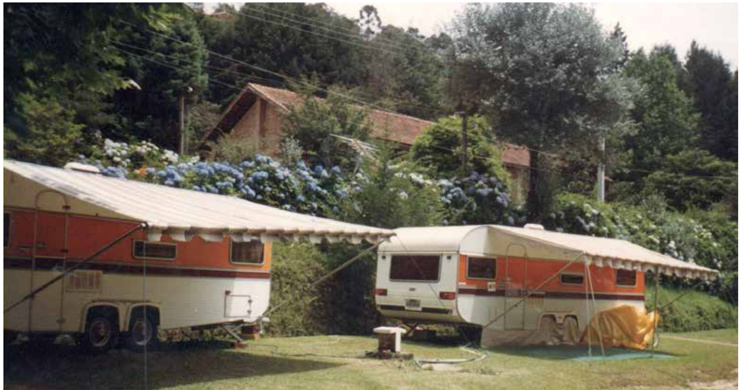
► Além das atrações culturais e gastronômicas na cidade, o camping de Campos do Jordão está próximo de vários programas de natureza