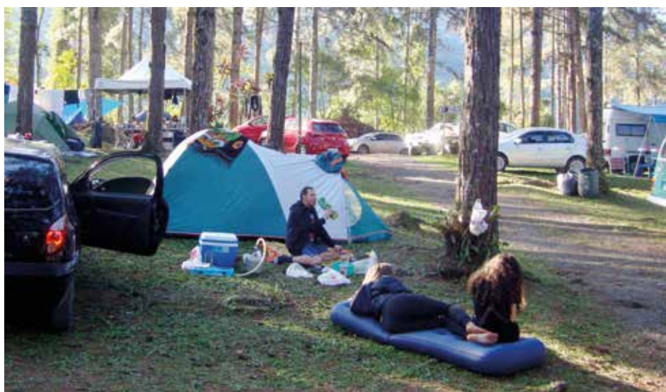
► Rios, piscinas, poços e um denso bosque embelezam o Camping da Serrinha