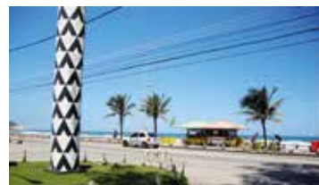
► Camping do Recreio dos Bandeirantes

PARATY (RJ-04) – Praia do Pontal. Tel.: (24) 3371-1050. Instalações – padrão, iluminação elétrica somente para as dependências, chuveiros quentes, praia fronteira. Camping de área reduzida. NÃO TEMPORADA: R$ 14,70 mais equipamento de R$ 3,50 até R$ 26,80; TEMPORADA (16/Dez. a 28/Fev.): R$ 19,90 mais equipamento de R$ 5,00 até R$ 40,40.