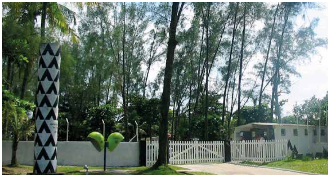
► Defronte à Praia de Cibratel, o Camping de Itanhaém

Atrativos: Além de belas praias como cartão postal da cidade, possibilita aos visitantes passeios pelas ilhas oceânicas, que são points de mergulho de classe internacional e coroam o turismo náutico da cidade. Tempos atrás, foi palco para as gravações da versão original da novela “Mulheres de Areia”, exibida pela Rede Globo. A cidade do interior de São Paulo ficou conhecida em todos os países e depois curtida no mundo após ce-