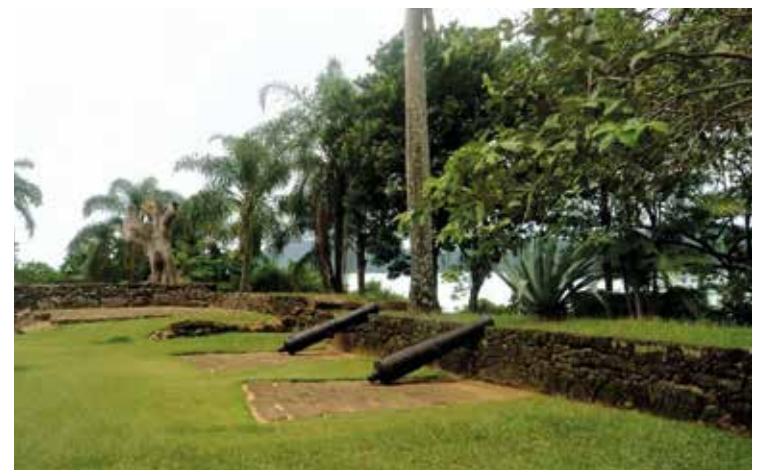
▶ Além do conteúdo histórico do Forte, vale apreciar a vista lá de cima

O Forte protegeu a cidade em meio ao processo de independência do Brasil. Hoje, o prédio preserva áreas como a Casa do Comandante, a ala do Quartel da Tropa e o Quartel dos Inferiores. Atualmente os três prédios são tombados pelo IPHAN e o local abriga também um pequeno