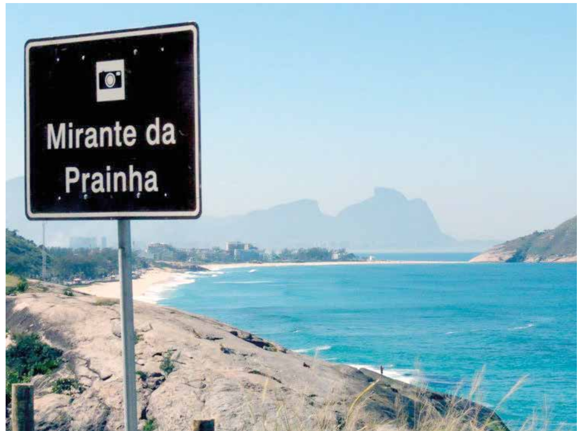
▶ Ao fundo, à esquerda, entre a placa e a rocha, o nosso Camping do Recreio

Disque Camping: (21) 2532-0203 ou (21) 3549-4978