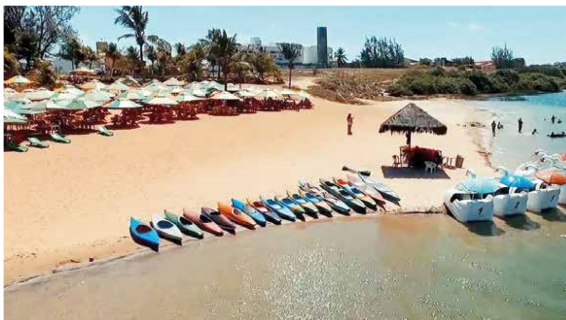
► A Lagoa de Arituba fica a 10km do Camping da Lagoa do Bonfim, bem próxima do litoral

Quem vai até a Lagoa de Arituba e curte um pouco mais de aventura não pode deixar de conferir o Aerobunda. A brincadeira consiste em “voar” de uma torre metálica de 10 metros de altura preso apenas em um suporte com cinto de segurança. A roldana da torre vai deslizar de uma margem à outra da lagoa e você escolhe o ponto em que se