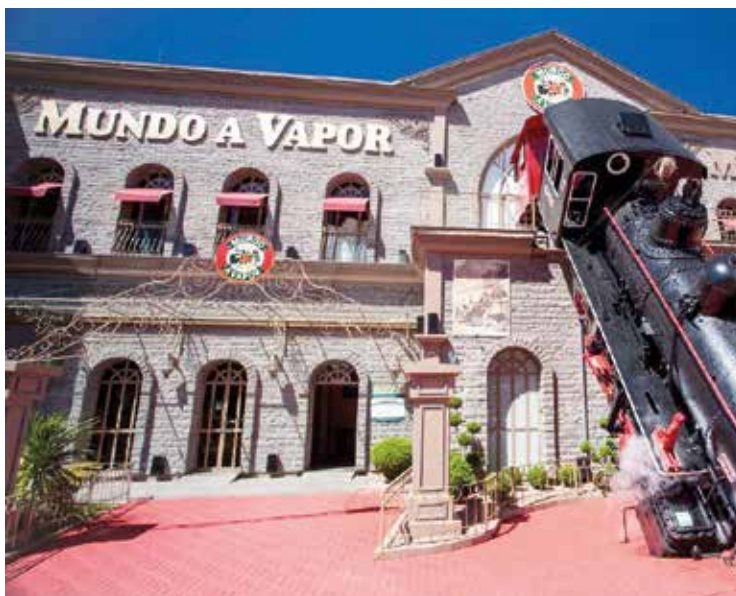
► O Mundo a Vapor fica bem próximo do nosso camping de Canela

A Semana Farroupilha de Canela acontece anualmente em setembro, sendo este ano, com data ainda a ser definida, por conta da Pandemia do Covid-19. A programação, é coordenada pela Prefeitura por meio da Secretaria de Turismo e Cultura e conta com um número