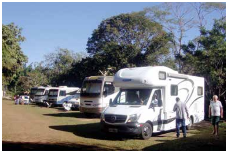
► Caldas Novas oferece um dos invernos mais quentes em nosso país

Visite o site do CCB: www.campingclube.com.br