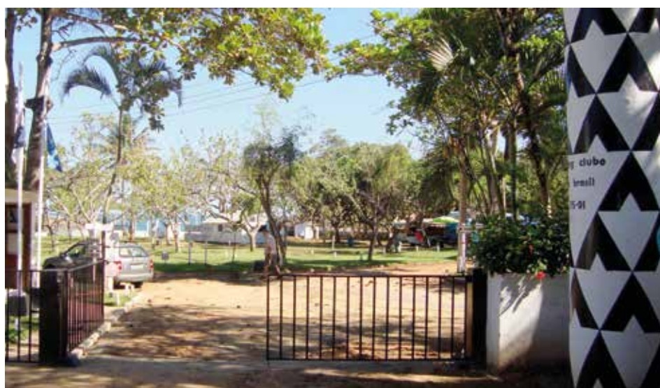
► No Camping de Guarapari, a tranquila enseada enfrenta a Setiba