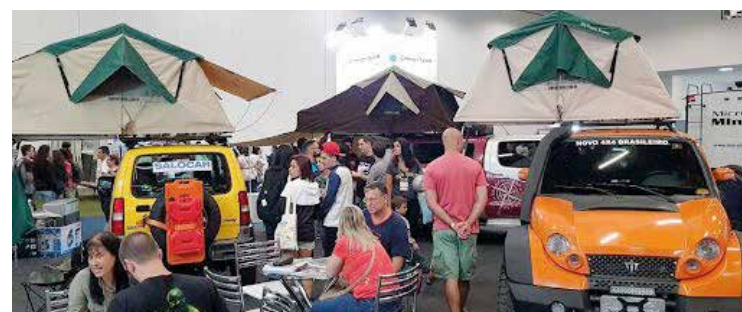
► Em dias melhores, com certeza, modernize seus equipamentos na Feira

Disque Camping: (21) 2532-0203 ou (21) 3549-4978