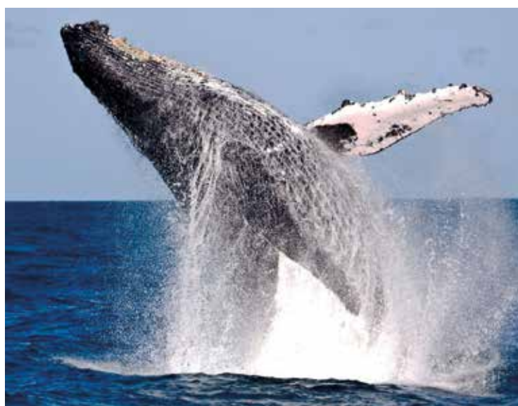
► É sempre emocionante apreciar o balé das baleias à nossa frente

Camping – O BA-03 fica de frente à Praia do Farol e possui ins-