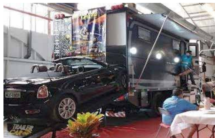
► Em novembro, vá conhecer os lançamentos dos veículos de campismo