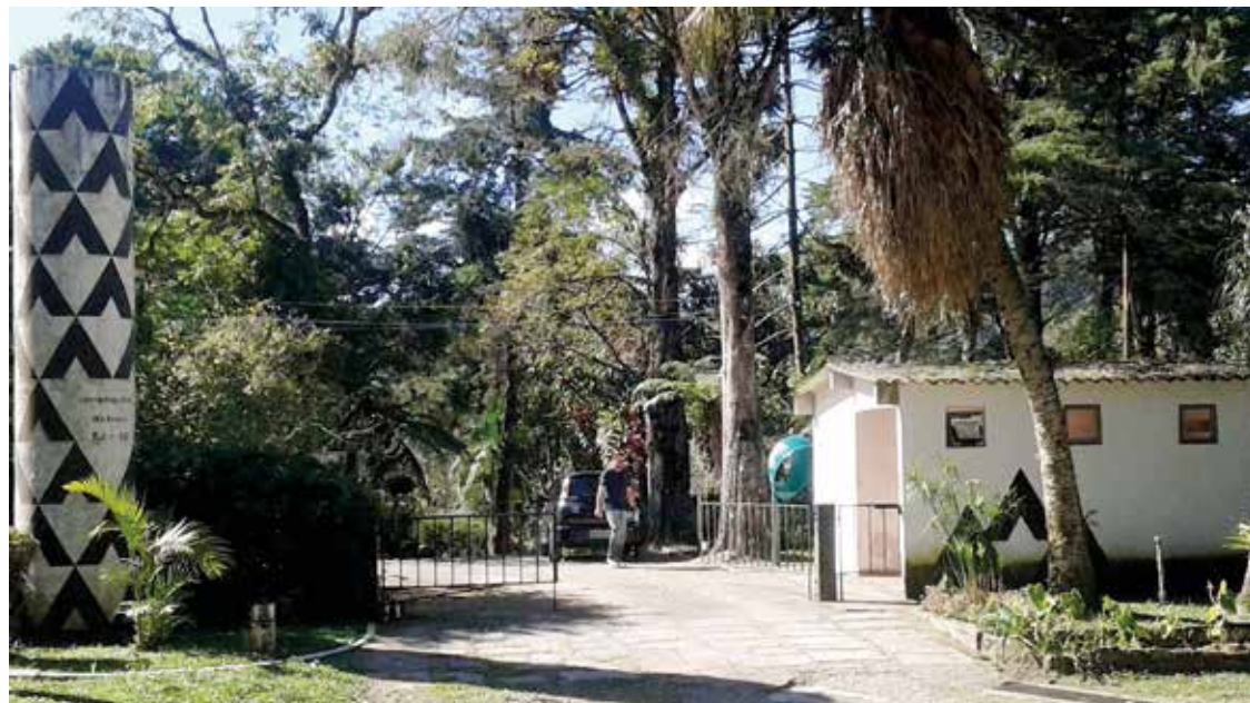
► O Camping de Mury atende como base para as atrações na região