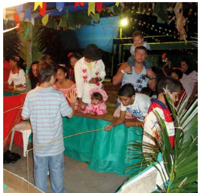
► Os arraiaás nos campings são sempre apreciados pelos associados mirins

No camping do Recreio, último sábado, os campistas celebram a festa a partir das 20 horas, no pavilhão de festas do camping, com comidas típicas em barracas montadas com serviço de caldos, molhos, milho verde, canjicas e bebidas