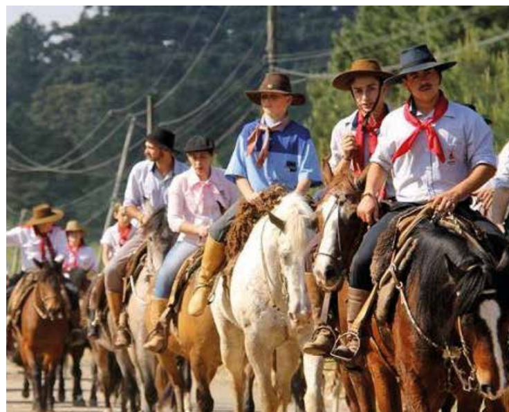
► Nos festejos da Farroupilha, as cavalgadas elevam o civismo gaúcho

Camping - O RS-01 está localizado a 837 m de altitude, em Canela, Serra Gaúcha, na Estrada do Caracol, margeado por um riacho