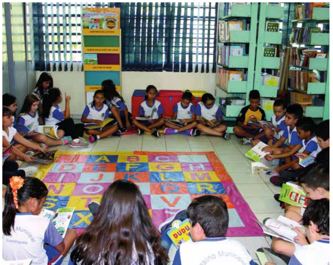
► A Festa Literária é um dos principais eventos culturais da cidade

Disque Camping: (21) 2532-0203 ou (21) 3549-4978